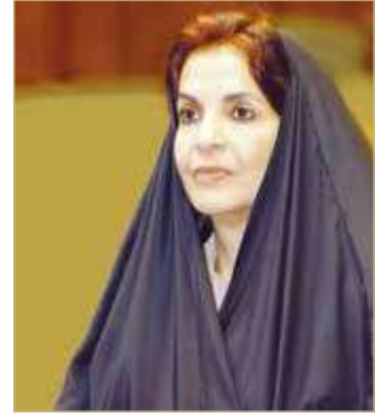
الأميرة سبيكة بنت إبراهيم آل خليفة

بعثت قريبة عاهل البلاد رئيسة المجلس الأعلى للمرأة صاحبة السمو الملكي الأميرة سبيكة بنت إبراهيم آل خليفة برقية تهنئة إلى عضو المجلس الأعلى للمرأة الشيخة زنا بنت عيسى بن دعيج آل خليفة بمناسبة صدور الأمر الملكي السامي بتعيينها أميناً عاماً لمجلس التعليم العالي. وقالت سموها إن "هذا التكليف الرفيع والباعث على الفخر والاعتزاز يؤكد ما توليه الإرادة السامية من اهتمام وتكريم وتقدير لكفاءات ومساهمات نساء البحرين الكرام في نهضة بلادهن، وهو أمر نراه مائلاً أمامنا بشواهد المشرقة على كافة أصعدة التنمية والتطوير في ميادين العمل الوطني". وأعربت في هذا الخصوص عن بالغ