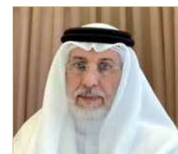
نوار آل محمود