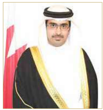
سمو الشيخ خليفة بن علي بن خليفة آل خليفة

لقاء جلالته أهالي "الجنوبية" وسام فخري... وفرصة لتجديد البيعة