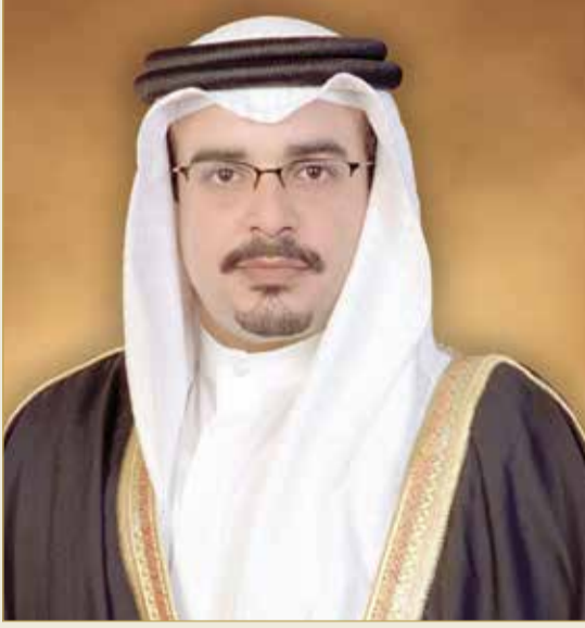
سمو ولي العهد رئيس الوزراء