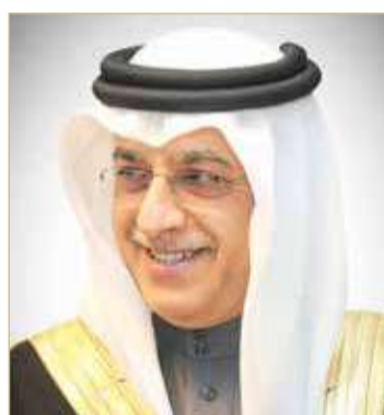
سلمان بن إبراهيم

ونوه الشيخ سلمان بن إبراهيم آل خليفة بدعم ممثل جلالة الملك