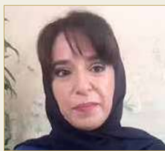
الشيخة حصة بنت خليفة آل خليفة

للحصول على المعارف والمهارات في هذا المجال مثل الانترنت ومتابعة الندوات والمؤتمرات ذات الصلة، إضافة إلى أن جامعة البحرين ومعهد البحرين للدراسات المالية والمصرفية يوفران شهادات أكاديمية ودورات تدريبية في هذا المجال. ودعت الهاشمي رائدات الأعمال البحرينية إلى الاستفادة من التكنولوجيا المالية في مشاريعهن منذ انطلاقتها، والاستفادة من الإمكانيات الكبيرة التي توفرها في تطور المشروع وتميزه وتعزيز تنافسيته، مشيرة إلى خطأ الاعتقاد أن التكنولوجيا المالية للمشاريع الكبيرة فقط. وأوضحت أن تقدم مملكة البحرين في قطاع الانترنت والاتصالات يسرع من وتيرة استفادة المملكة من التطبيقات التقنية الحديثة بما فيها التكنولوجيا المالية والبيانات الكبيرة وسلسلة الكتل "بلوك تشين" وغيرها، لافتة في الوقت ذاته إلى أهمية تعزيز الوعي بالتحديات التي يحتملها تطبيق تلك التقنيات من جهة أخرى مثل الاختراقات والهجمات السيبرانية وغيرها.