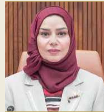
رئيسة مجلس النواب

سيظلون أوفياء لجلالته ولهذا الوطن الشامخ، ساعين إلى تحقيق المزيد من الخير والتطور والازدهار والرفي لمملكة البحرين الغالية وشعبها الوفي، سائلة المولى عز وجل أن يحفظ جلالته الملك، ويديم عليه موفور الصحة