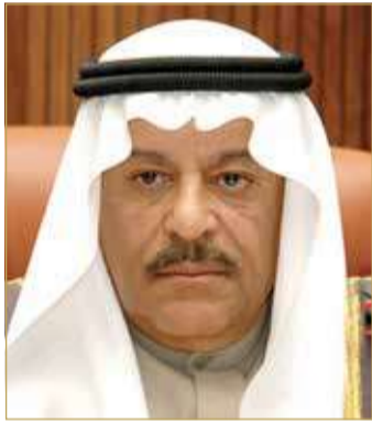
رئيس مجلس الشورى

الجلالة الملك حمد بن عيسى آل خليفة. وأشاد الصالح بمواقف سموه، وتعاون الحكومة الدائم مع مجلس الشورى، لتعزيز الإنجازات التي تشهدها مملكة البحرين، من خلال إقرار العديد من مشاريع القوانين، التي تؤكد حرص واهتمام سموه لتحقيق رؤية وأهداف النهج الإصلاحي لجلالة العاهل، سائلاً المولى عز وجل أن يحفظ سموه ويديم عليه موفور الصحة والسعادة، وأن يسدد على طريق الخير خطاه.