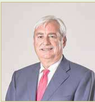
جان كريستوف دوراند

لم تتغير ربحية السهم الواحد للربع الأول 2021 عن الفترة ذاتها 2020، حيث بلغت 8 فلويس بحرينية. وشهد إجمالي الدخل الشامل العائد لمساهمي بنك البحرين الوطني خلال الربع الأول 2021 ارتفاعاً ليصل إلى 16.1 مليون دينار، مقارنة بإجمالي الخسارة العائدة للمساهمين بقيمة 39.3 مليون دينار في العام 2020. وتُعزى الزيادة - في معظمها - إلى تحركات القيمة السوقية للسندات السيادية. انخفض الدخل التشغيلي بنسبة 3.5% ليبلغ 38.9 مليون دينار مقابل 40.3 مليون دينار لفترة نفسها من العام الماضي، حيث تأثر إلى حد كبير بانخفاض الرسوم والهامش الناجمة عن جائحة كوفيد-19 والتي لم تؤثر على إيرادات الربع الأول 2020. شهد إجمالي حقوق المساهمين للمجموعة انخفاضاً بنسبة 3.6% ليصل إلى 500.8 مليون