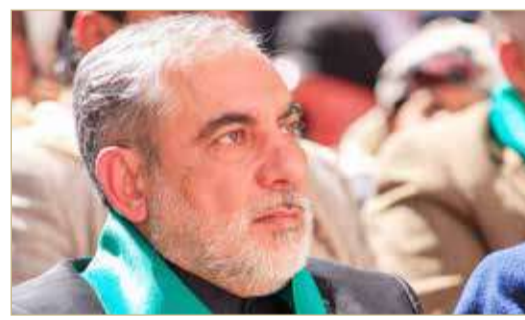
سفير إيران في صنعاء حسن إبرلو

◆ أكد تحقيق السيطرة النارية على عدد من الجبهات بمساعدة القبائل