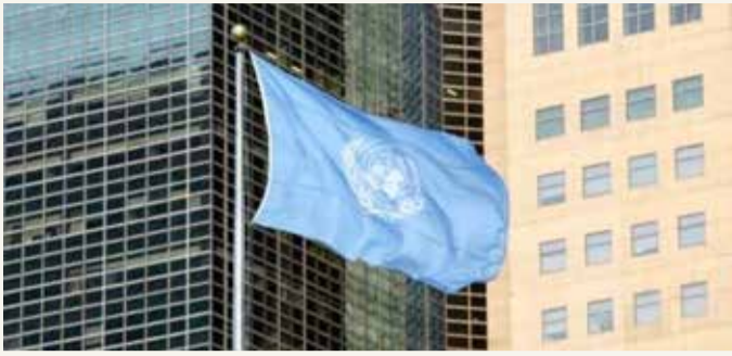
مقر الأمم المتحدة في نيويورك

◆ أكثر من 150 شخصية تطالب بوضع حد لثقافة الإفلات من العقاب القائمة