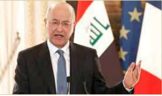
الرئيس العراقي برهم صالح

◆ أكد أن بغداد استضافت أكثر من جولة محادثات سعودية إيرانية