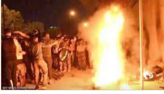
المحتجون أحرقوا مقصورات خارج القنصلية الإيرانية في كربلاء