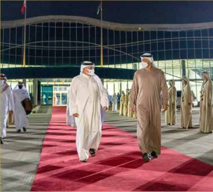
سمو ولي العهد رئيس مجلس الوزراء يغادر دولة الإمارات العربية المتحدة الشقيقة

وكان في مقدمة مستقبلي صاحب السمو الملكي ولي العهد رئيس مجلس الوزراء، صاحب السمو ولي عهد أبوظبي نائب القائد الأعلى للقوات المسلحة بدولة الإمارات العربية المتحدة، ونائب رئيس مجلس الوزراء وزير الداخلية بدولة الإمارات العربية المتحدة وعدد من كبار المسؤولين بدولة الإمارات العربية المتحدة وسفير مملكة البحرين لدى دولة الإمارات العربية المتحدة الشقيقة الشيخ خالد بن عبدالله بن علي آل خليفة.