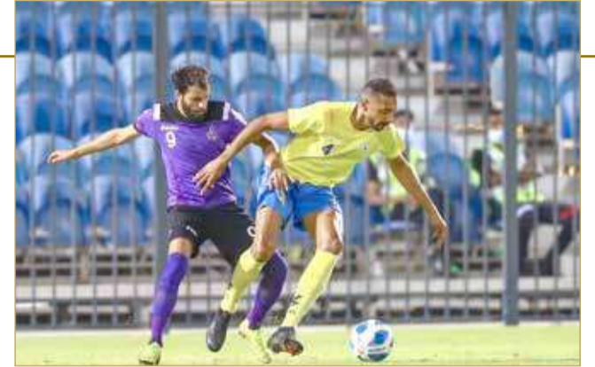
من مباراة الاتحاد وقلالي