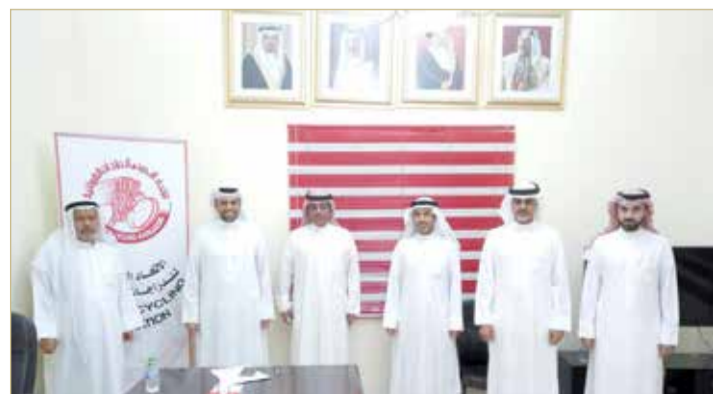
صورة جماعية لمجلس الإدارة

مجلس الإدارة يشيد بإنشاء الهيئة العامة للرياضة