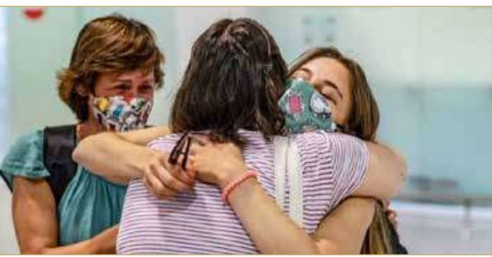
وفي حين سيتم السماح بالعناق بين أفراد الأسر مرة أخرى اعتباراً من 17 مايو الجاري، من المتوقع أن يؤكد بوريس جونسون على ضرورة القيام بذلك بحذر.

تستعد إنجلترا لإعادة التواصل البشري والعناق من جديد، الذي اعتقد له الإنجليز، إثر التراجع الكبير في إصابات فيروس كورونا ووباء (كوفيد 19) في البلاد. ومن المتوقع أن يعطي رئيس الوزراء البريطاني، بوريس جونسون الضوء الأخضر لهذا الاتصال البشري المفقود بشدة عندما يعلن عن الجولة التالية من تخفيف الإغلاق في وقت لاحق في أعقاب الانخفاض الحاد في