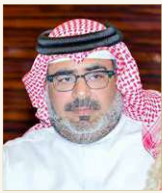
عبدالله بن عيسى

المحلية ونجاح وبما يحفظ سلامة وصحة جميع المشاركين، وتعاون المتسابقين مع مختلف الجهات كان سببا كبيرا في سلامة سير برامج المسابقات، ولا ننسى ما قدموه من مستويات فنية باهرة. وأشار الشيخ عبدالله بن عيسى آل خليفة إلى دور مختلف وسائل الصحافة والإعلام البارز والذي يعتبر جزءا لا يتجزأ من نجاح أي حدث رياضي، حيث كانت هناك عدد من السباقات المحلية التي اقتصر فيها الحضور على المشاركين فقط دون وجود الجمهور، وهنا كان الإعلام حاضرا في نقل الصورة والتفاصيل لمحبى وعشاق رياضة السيارات، لذا نحن نعتبر أن الإعلام شريكنا الدائم في النجاح.