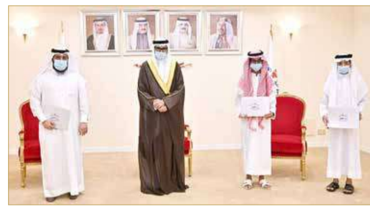
سمو محافظ الجنوبية يكرم الفائزين بمسابقة حفظ القرآن الكريم