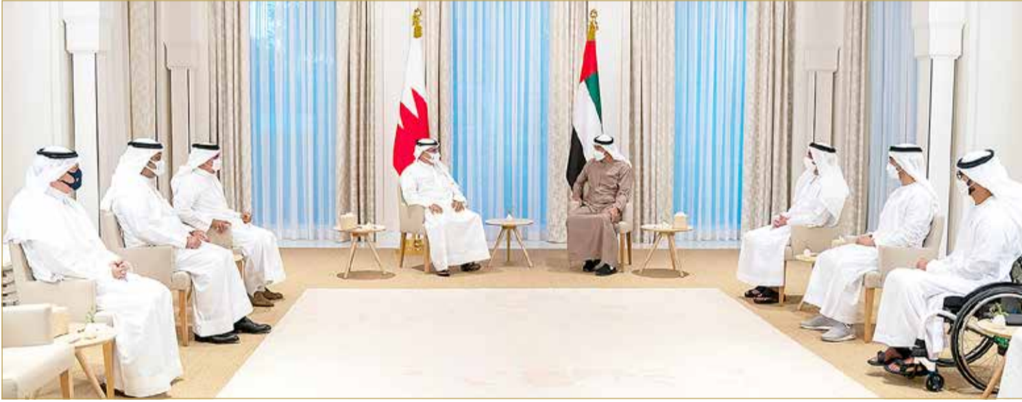
سمو ولي العهد رئيس مجلس الوزراء لدى لقائه سمو ولي عهد أبوظبي نائب القائد الأعلى للقوات المسلحة

جاء ذلك لدى لقاء سموه أمس مع ولي عهد أبوظبي نائب القائد الأعلى للقوات المسلحة بدولة الإمارات العربية المتحدة الشقيقة صاحب السمو الشيخ محمد بن زايد آل نهيان، بمجلس سموه بقصر الشاطئ بحضور نائب رئيس مجلس الوزراء وزير الداخلية الفريق سمو الشيخ سيف بن زايد آل نهيان وسمو الشيخ حمدان بن محمد بن زايد آل نهيان والشيخ زايد بن حمدان بن زايد آل نهيان ورئيس مجلس إدارة مطارات أبوظبي الشيخ محمد بن حمد بن طحنون آل نهيان وعدد من أصحاب السمو والمعالي والسعادة المسؤولين بدولة الإمارات العربية المتحدة، ووزير الداخلية الفريق أول ركن الشيخ راشد بن عبدالله آل خليفة، ووزير المالية والاقتصاد الوطني الشيخ سلمان بن خليفة آل خليفة وسفير مملكة البحرين لدى دولة الإمارات العربية المتحدة الشقيقة الشيخ خالد بن علي آل خليفة، في إطار الزيارة الأخوية التي يقوم بها سموه إلى أبوظبي، حيث نقل صاحب السمو الملكي ولي العهد رئيس مجلس الوزراء تحيات جلالة الملك إلى صاحب السمو رئيس دولة الإمارات العربية المتحدة وصاحب السمو ولي عهد أبوظبي نائب القائد الأعلى للقوات المسلحة، وتمنيات جلالتة لدولة الإمارات العربية