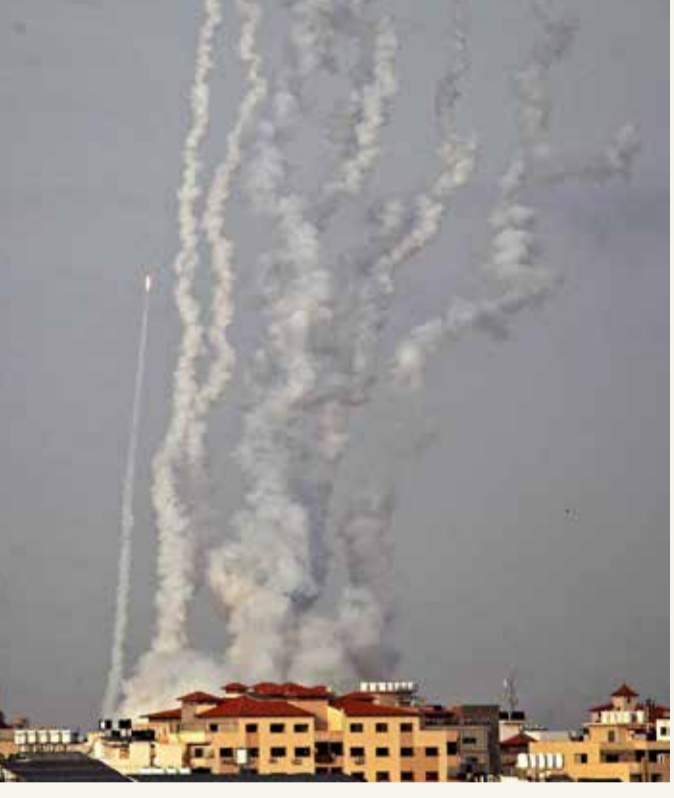
إطلاق صواريخ من غزة باتجاه إسرائيل

موازاة مع ذلك، أقيمت أمس مسيرة الإعلام الخاصة بإعلان ضم القدس في العام 1967، والتي كانت من المقرر أن تصل إلى البلدة القديمة. كما أعلن إخلاء الكتيبت الإسرائيلي، وتعليق مناورات عسكرية مجدولة. وكانت القوات المسلحة الإسرائيلية تخطط لبدء أكبر تدريب لها في 30 عاماً أطلقت عليه اسم "عربات النار". وكانت كتائب القسام الجناح العسكري لحركة حماس قد حذرت الكيان العبري من التصعيد، وأهلته حتى السادسة من مساء أمس "لسحب قواتها والمستوطنين من المسجد الأقصى وحي الشيخ جراح" في القدس الشرقية المحتلة والتي كانت مسرحاً لمواجهات عنيفة خلفت أكثر