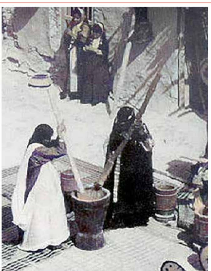
دق حب الهريس في الخمسينات

خطأ طبي جسيم تعرضت له شابة إيطالية، يوم الأحد، بعد أن تلقت جرعة زائدة "محتملة" من لقاح (فايزر-بيونتيك) المضاد لـ (كوفيد - 19). وكشفت وكالة الأنباء الإيطالية أن شابة تبلغ من العمر 23 عاماً تلقت ما يعادل 6 جرعات من لقاح فايزر المضاد لفيروس كورونا المستجد عن طريق الخطأ. وأشارت الوكالة إلى أن الشابة وضعت تحت المراقبة الطبية في مستشفى في توسكانا، وسط إيطاليا، منوهة إلى أنها "بصحة جيدة"، كما ذكرت وكالة فرانس برس. وأوضحت الوكالة الفرنسية أن الممرضة التي كانت تعطيتها اللقاح خطأ، وبدلاً من حقن جرعة واحدة للشابة، التي لم يكشف عن هويتها، حقنت القارورة بكاملها، أي ما يعادل 6 جرعات من اللقاح.