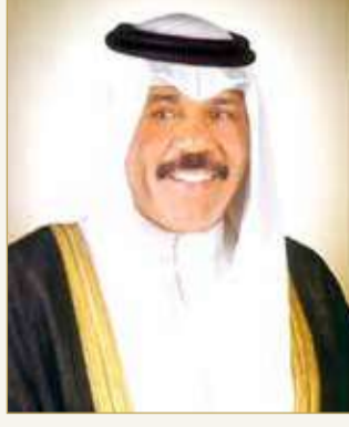
أمير دولة الكويت