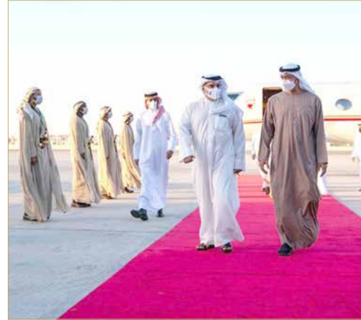
سمو ولي العهد رئيس مجلس الوزراء يصل دولة الإمارات العربية المتحدة الشقيقة

وجهود البلدين ومسارات التعاون بينهما ضمن الإطار الثنائي والدولي في مواجهة التحديات والتعامل مع التطورات.