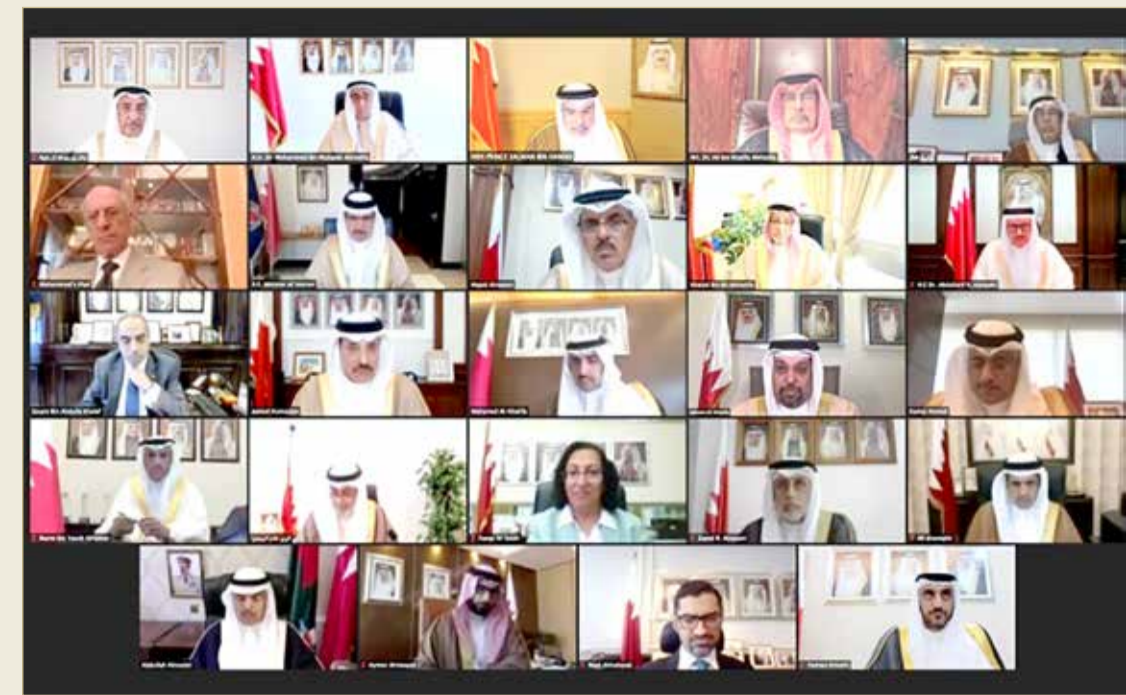
سمو ولي العهد رئيس مجلس الوزراء يترأس الاجتماع الاعتيادي الأسبوعي لمجلس الوزراء

مذكرة وزير المواصلات والاتصالات بشأن اتفاقية الخدمات الجوية بين مملكة البحرين وجمهورية البوسنة والهرسك.