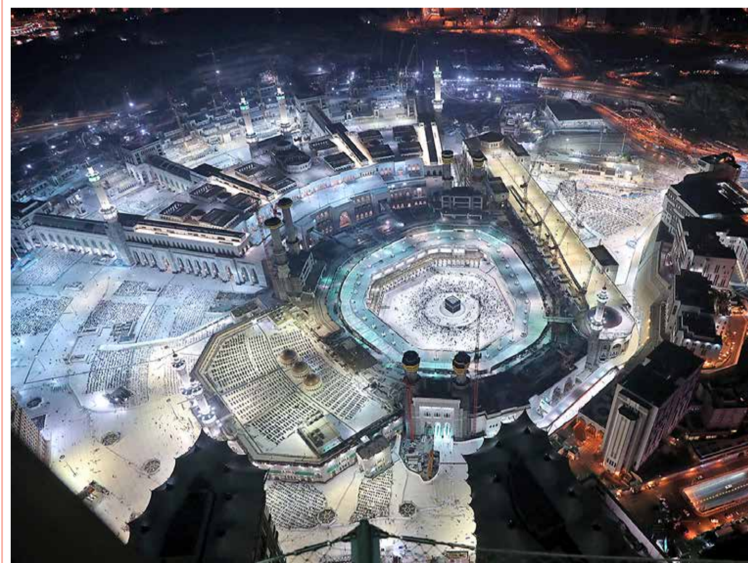
صورة جوية لمجمع المسجد الحرام في مدينة مكة المكرمة