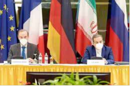
إيران تستمر الملف النووي للضغط من أجل رفع العقوبات الأميركية

تسابق القوى الدولية الزمن لدفع جهود إحياء الاتفاق النووي وإنقاذه من الانهيار في أسرع وقت ممكن لإلزام إيران بالعودة لتخصيب اليورانيوم عند المستوى المنصوص عليه بالاتفاق ومنعها من صنع أسلحة نووية، تشكل خطراً حقيقياً على الأمن. وقال وزير الخارجية الألماني هايكو ماس أمس الاثنين على هامش اجتماع مع نظرائه بالاتحاد الأوروبي في بروكسل "المفاوضات صعبة وشاقة لكن جميع المشاركين يجرون المحادثات في أجواء بناءة". وأضاف ماس "لكن الوقت ينفذ. نهدف إلى العودة الكاملة للاتفاق النووي الإيراني لأن هذه هي الطريقة الوحيدة لضمان عدم قدرة إيران على امتلاك أسلحة نووية". وأضاف إن الوقت عامل جوهري في مفاوضات فيينا الرامية لإحياء الاتفاق النووي الإيراني المبرم عام 2015، مضيفاً أن المحادثات تستغرق وقتاً طويلاً لكنها تجري في أجواء طيبة. وعاد المسؤولون الأميركيون إلى فيينا الأسبوع الماضي للمشاركة في جولة رابعة من المحادثات غير المباشرة مع إيران حول سبل العودة للاتفاق النووي، الذي انسحب منه الرئيس