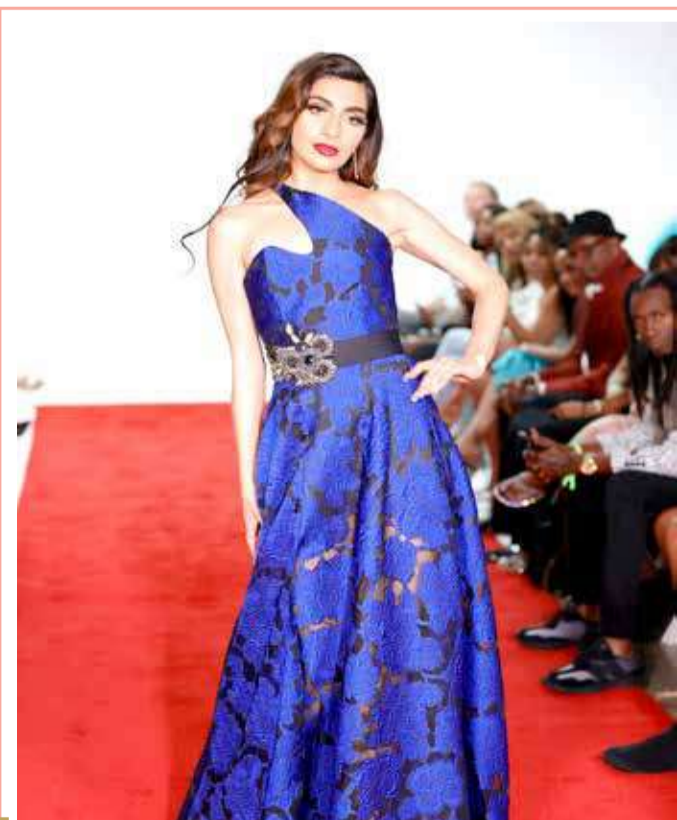
عارضة أزياء تسير على المدرج خلال عرض للموضة في لوس أنجلوس، كاليفورنيا