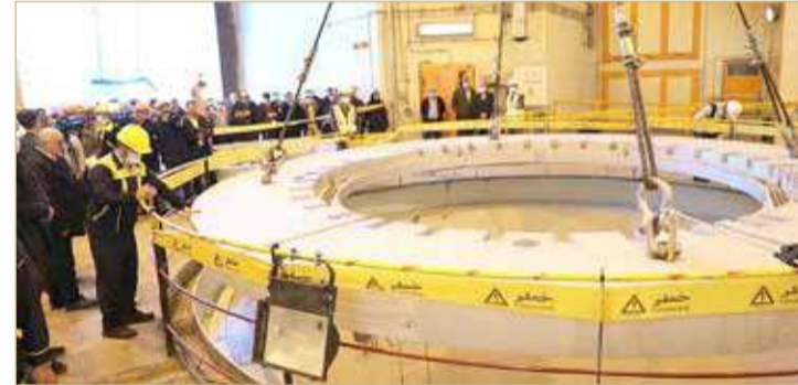
مفاعل أراك النووي الإيراني

تأكيد إيران للوكالة الدولية للطاقة الذرية أنها توي الاستمرار في تنفيذ بنود الاتفاق التقني الموقت المبرم بينهما. وحذر من أن "أي توقف في تطبيق هذا الاتفاق من شأنه أن يضر بقدرة الوكالة الدولية للطاقة الذرية على الحفاظ على استمرارية معرفتها بالأنشطة النووية الإيرانية".