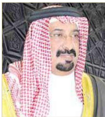
الشيخ أحمد بن علي

وختم الشيخ أحمد بن علي آل خليفة، بالقول "رحم الله ابن نادي المحرق البار، أحمد يوسف سالمين، وأسكنه فسيح جناته وأهلم أهله وذويه وكل عشاق كرة القدم في البحرين وخارجها، الصبر والسلوان. إننا لله وإننا إليه راجعون".