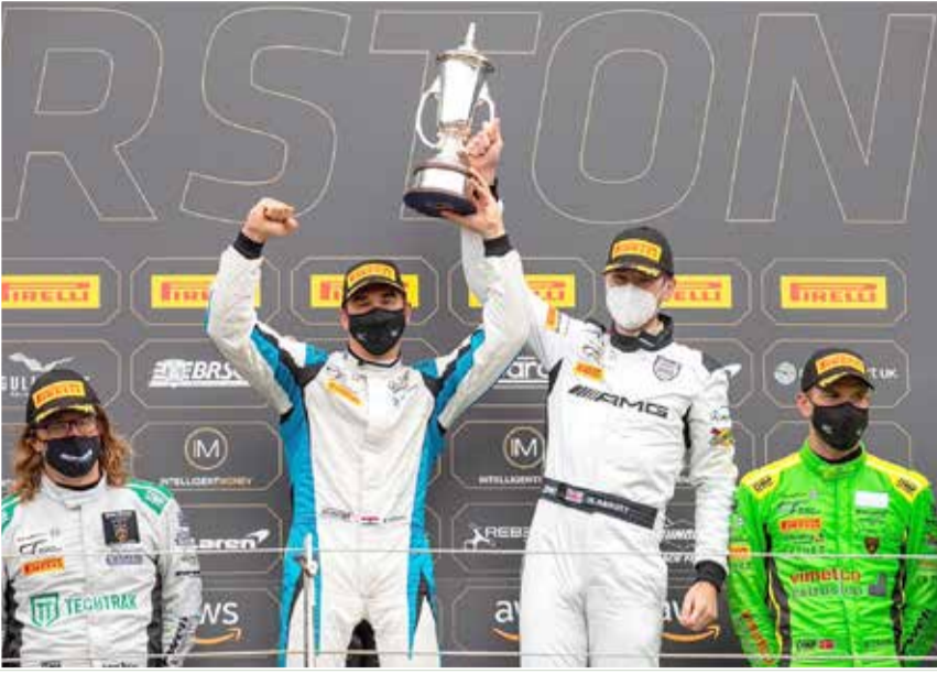
لقطة لتتويج الفريق