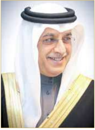
الشيخ سلمان بن إبراهيم

كرة البحرينية، داعيا الله تعالى أن يرحم النجم الكبير أحمد سالمين ويسكنه فسيح جناته ويهلم أهله ومحبيه الصبر والسلوان.