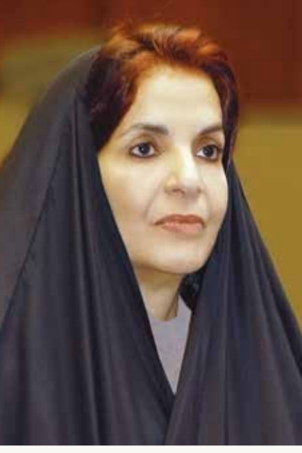
سمو الأميرة سبيكة بنت إبراهيم

ضمن برنامج عمل "جيل المساواة" وبالشراكة مع الأمم المتحدة