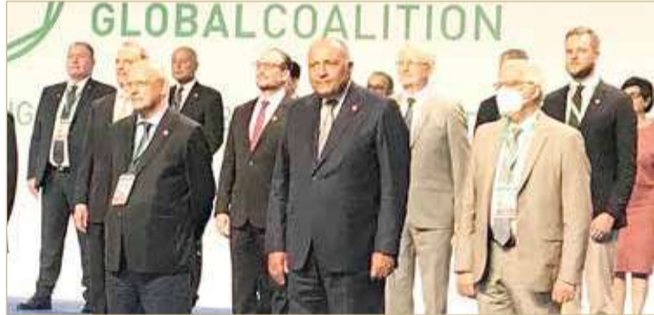
مشاركون في اجتماع التحالف الدولي

المتحدة الاجتماع الوزاري للتحالف الدولي ضد داعش، الذي تستضيفه روما، أمس. ويشترك في الاجتماع 83 وزيراً ووفد من الدول الأعضاء في التحالف إضافة إلى وزراء خارجية دول عربية. وبيحث الاجتماع جهود القضاء على بقايا التنظيم في العراق وسوريا ووقف تمدده في إفريقيا.