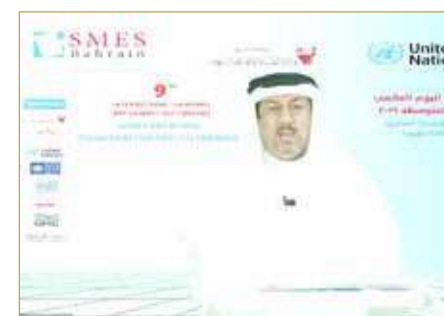
الدبري يستعرض التوصيات

خرجت القمة السنوية التاسعة لليوم العالمي للمؤسسات الصغيرة والمتوسطة 2021 بعنوان "أهمية التحول الرقمي للمؤسسات الصغيرة والمتوسطة في ظل جائحة كورونا" بـ 13 توصية، من بينها ضرورة مواصلة مختلف أوجه الدعم المالي والتقني خصوصاً للمؤسسات الصغيرة والمتوسطة خلال وبعد جائحة كورونا، والعمل على بناء القدرات لرفع مستوى الوعي وإكساب أصحاب هذه المؤسسات المهارات اللازمة لإدارة مشروعاتهم باستخدام أحدث التكنولوجيات، وغيرها من التوصيات المهمة. (15)