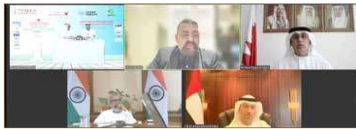
المشاركون في اليوم الأول للمؤتمر

إلى ذلك، أكد منسق الأمم المتحدة المقيم في البحرين محمد الزقاني، أن المؤسسات متناهية الصغر والصغيرة والمتوسطة تلعب دوراً مهماً في الاقتصاد العالمي. فهي تساعد في الحد من الفقر من خلال خلق فرص عمل للقوى العاملة المتنامية في البلاد وتشكل جزءاً من سلسلة التوريد المهمة للمنتجات والخدمات. وذكر أنه وفقاً للمجلس الدولي للأعمال الصغيرة، تشكل المشروعات المتناهية الصغر والصغيرة والمتوسطة الرسمية وغير الرسمية أكثر من 90 % من جميع الشركات وتمثل 70 % من إجمالي العمالة العالمية و50 % من الناتج المحلي الإجمالي، مشيراً إلى أنه وفقاً للبنك الدولي، ستكون هناك حاجة إلى 600 مليون وظيفة بحلول العام 2030 لاستيعاب القوة العاملة العالمية المتزايدة.