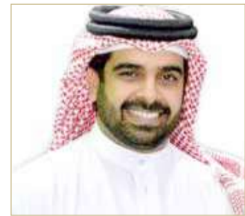
الشيخ سلمان بن محمد

البحرينية نحو مستويات متقدمة وفق منظور احترافي يحقق مزيدا من الإنجازات ويعزز من مكانة مملكة البحرين على خارطة الرياضة القارية والدولية.