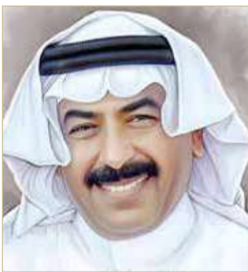
علي عبدالله خليفة

تتصل بالشكل الفني للقصيد وتحمّل دلالات متنوعة قابلة للتفسير حسب قدرة المتلقي على فهم هذه الدلالات وتفسير أبعادها. وتأتي النخلة كعنصر من عناصر الطبيعة المهمة وبيئة ملهمة كان الشاعر يسكنها وتسكنه لتقف شامخة في تجربته الشعرية ليس لأن النخلة هي طعام الفقراء ومصدر رزقهم، بل لأن النخلة في شعر علي خليفة هي النقاء الذي ينشده في الطبيعة، والبراءة التي تغتال من حياتنا، والجمال الذي يجسد روحه التي تنشق إليه، وهي الأنتى تتداخل مع الطبيعة.