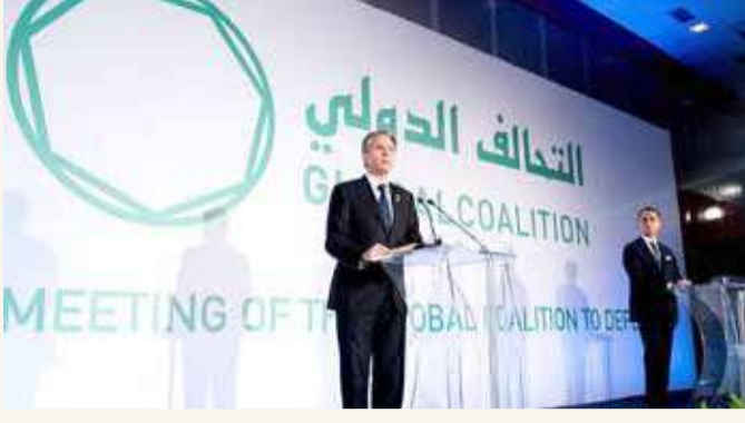
وزير الخارجية الأميركي بليكن يتحدث خلال مؤتمر مكافحة داعش

وشدد البنتاغون على أن الضربات استهدفت مستودعات أسلحة ومنشآت تستخدمها عدة مجموعات، بينها "كتائب حزب الله" و"كتائب سيد الشهداء"، وهي مجموعات في ميليشيات الحشد.