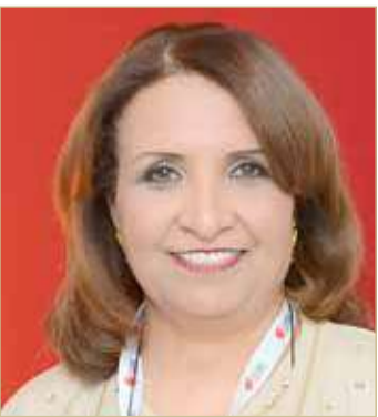
الشخة حياة بنت عبدالعزيز

وأكدت الشخة حياة بنت عبدالعزيز آل خليفة أن توجيهات سموه تمثل خارطة طريق لمستقبل أكثر تميزا، مشيرة إلى حرص الاتحاد البحريني لكرة الطاولة على السير ضمن نهج سموه ومواصلة العمل تجاه تحقيق الأهداف المرجوة بإذن الله، مينة أن تشكيل لجنة الانضباط والتدقيق المالي والإداري بالاتحادات والأندية الرياضة برئاسة نائب رئيس الهيئة سمو الشيخ سلمان بن محمد آل خليفة سوف يعزز العمل المالي والإداري في الاتحادات.