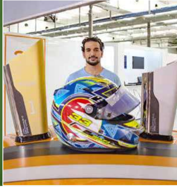
عيسى بن عبدالله