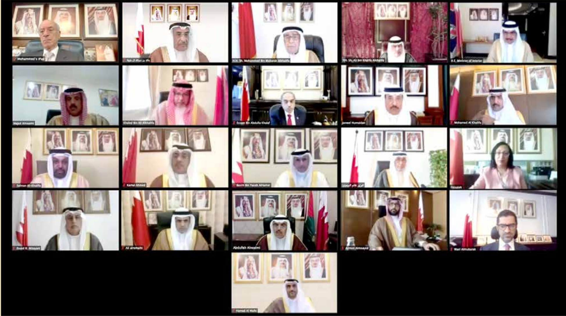
سمو نائب رئيس مجلس الوزراء مترئسا الاجتماع الاعتيادي الأسبوعي لمجلس الوزراء

◆ مجلس الوزراء يوافق على تصنيف عدد من الكيانات والأفراد كجهات إرهابية