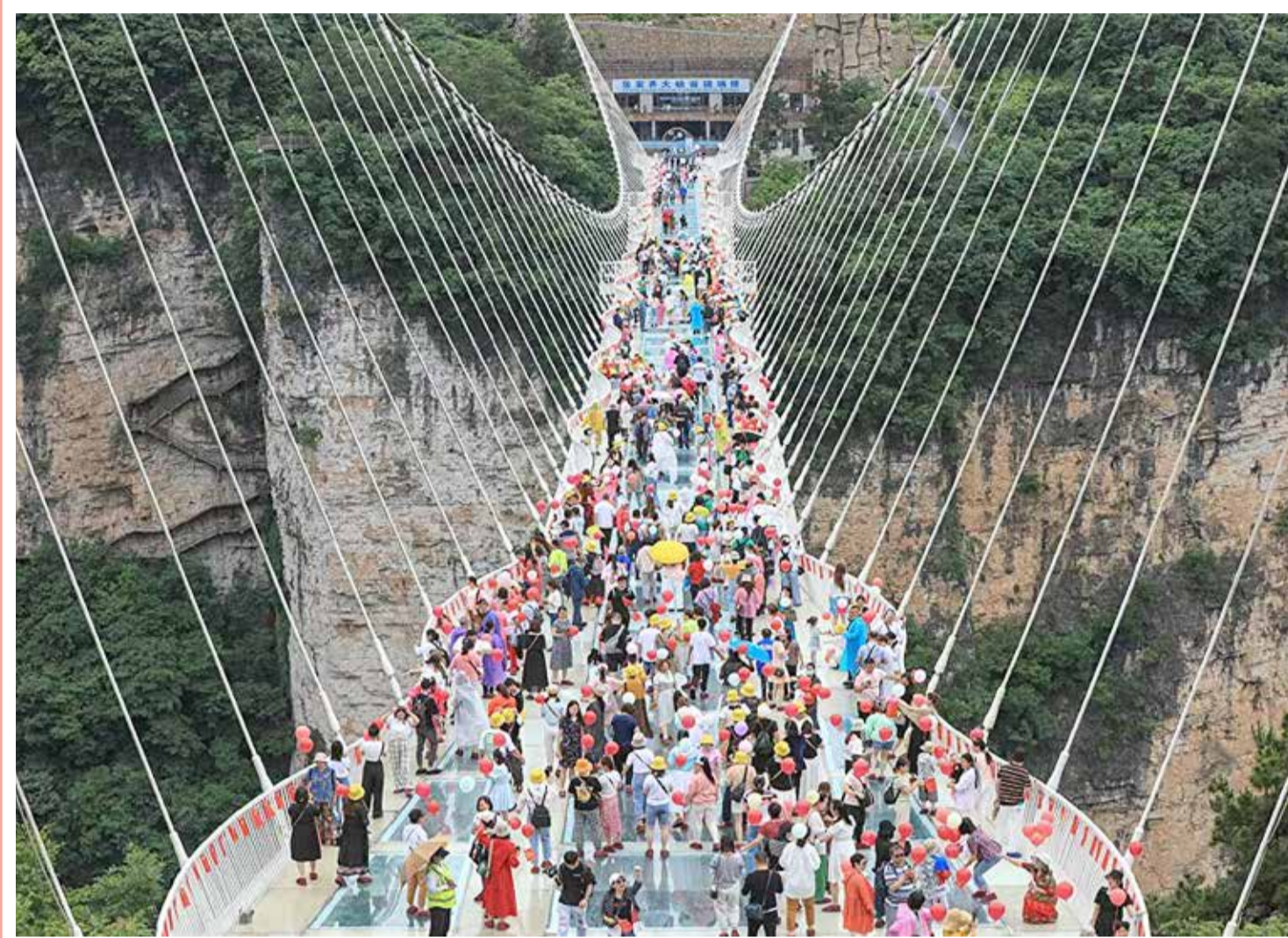
أشخاص يسرون على ممر جسر ذو قاع زجاجي في تشانغ جياجيه، بمقاطعة هونان وسط الصين

قسم الإعلانات: +973 17111501 / 508 +973 32224492 / 39615645 +973 17580939 الاشتراكات والتوزيع: +973 17111432 +973 17111434