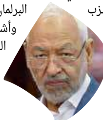
لوسائل إعلام محلية.

خاصة فيما يتعلق بالوضع الصحي بالبلاد. وقالت الكتلة إن الغنوشي عبر تفعيل لائحة إسقاط الثقة عنه، على خلفية اتهامه بانتهاج الأسلوب "الدكتاتوري" في إدارة البرلمان. وتتهم الكتلة الديمقراطية وكتلة الإصلاح وكتلة تحيا تونس الغنوشي صراحة بـ"الدكتاتورية"، معتبرة أنه ينتهج سياسة الكيل بمكيالين. وكانت هذه الكتلة قاطعت الأسبوع الماضي مكتب المجلس واللجان، احتجاجا على تقاعس الغنوشي عن ملاحقة مرتكبي الاعتداء الجسدي بحق النائبة ورئيسة الحزب الدستوري الحر عبير موسي، بالإضافة إلى عدم تجاوبه مع طلبات تغيير جدول أعمال الجلسات العامة للبرلمان،