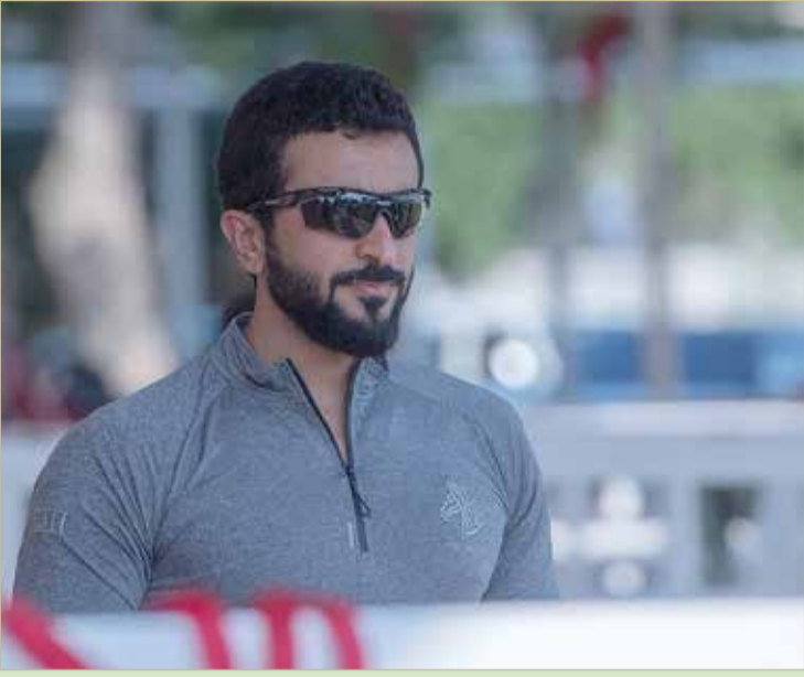
سمو الشيخ ناصر بن حمد

◆ سموه سيشارك في 120 كم.. و9 فرسان في 160 للعموم و120 للناشئين