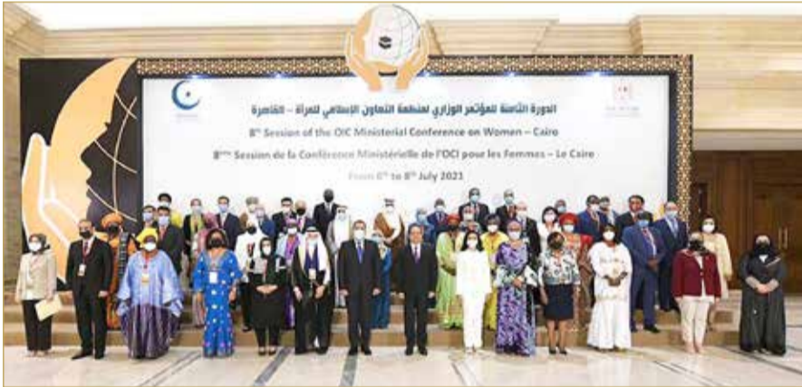
جانب من مشاركة مملكة البحرين في أعمال المؤتمر الوزاري

وقدمت مملكة البحرين خلال هذه المشاركة عرضاً حول الجهود الوطنية في التصدي لجائحة كوفيد-19، ودور المرأة في المحافظة على مكتسبات التوازن بين الجنسين لما بعد الجائحة، تضمن عدداً من التوصيات لتطوير الخطط الوطنية للتأقلم والتكيف مع جائحة كورونا واتخاذ التدابير الاستباقية للتقليل من تداعياتها، وهو ما تم تبنيه ضمن قرارات الدورة الثامنة للمؤتمر الوزاري لمنظمة التعاون الإسلامي للمرأة. وقد تقدمت مملكة البحرين مع كل من المملكة العربية السعودية ودولة الإمارات العربية المتحدة ودولة الكويت بقرار بشأن حماية وتمكين المرأة في الدول الأعضاء أثناء الأوبئة والظروف الاستثنائية، الذي دعا إلى تشجيع الدول على وضع