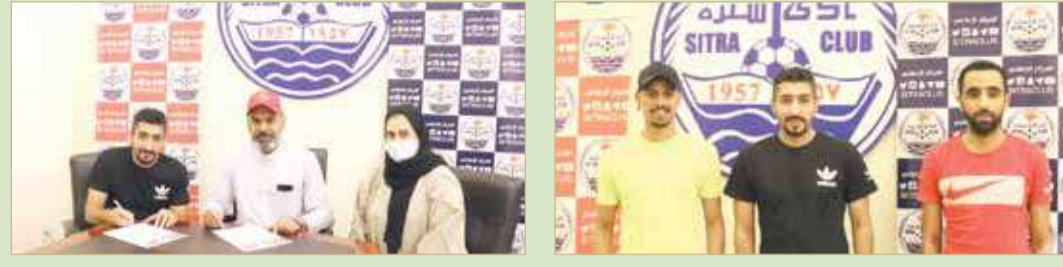
أثناء توقيع العقد

في إطار سياسة النادي للمحافظة على أبرز النجوم