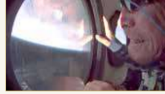
الملياردير البريطاني ريتشارد برانسون

رئيس شركة "سبايس إكس" إيلون ماسك. وكانت مهمة برانسون الرئيسية خلال الرحلة اختبار وتقييم هذه التجربة التي سيعيشها الزبائن المستقبليون. وعند بلوغ ارتفاع 15 كلم، انفصلت المركبة عن الطائرة التي كانت تحملها وبشرت صعوداً حارقاً لسرعة الصوت إلى أن تحطت ارتفاع 80 كلم، وهو الارتفاع الذي حددته الولايات المتحدة كحدود للفضاء. وبعد إطفاء المحرك، تمكن الركاب من فك أحزماتهم ليسبحوا بضع دقائق في انعدام الجاذبية وتأمل الكرة الأرضية من إحدى الكوات الـ 12 في المقصورة. ثم حلت المركبة عائداً إلى الأرض.