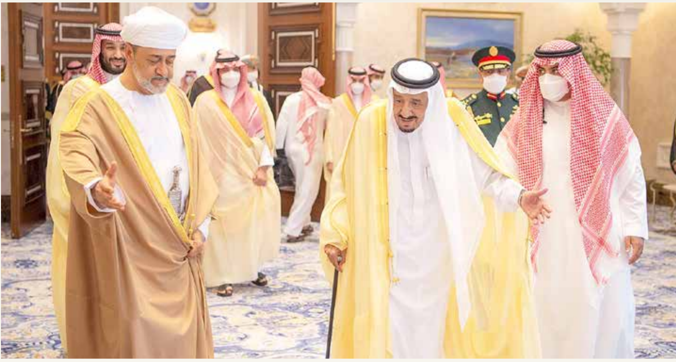
خادم الحرمين الشريفين مستقبلاً جلالته سلطان عُمان (واس)

خاصة، والعاملين الذين تنظم شؤون توظيفهم قوانين أو لوائح مشروعة قانون مقدم من 10 أعضاء العام، وشركات قطاع الأعمال العام، وسمحت المادة الثانية من القانون بفصل الموظفين في عدة حالات، منها "إذا قامت بشأنه قرائن جديّة على ما يمس الأمن القومي للبلاد وسلامتها"، إذ يعد إدراج العامل على قائمة الإرهابيين وفقاً لأحكام قانون تنظيم قوائم الكيانات الإرهابية والإرهابيين فريضة جديّة. وتصف مصر تنظيم الإخوان إرهابياً منذ العام 2013، بعد أشهر من إطاحة الرئيس الأسبق محمد مرسي إثر احتجاجات شعبية عارمة.