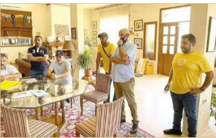
جانب من الزيارة

◆ في إطار اهتمام ودعم ناصر بن حمد.. ومن خلال ركوب الخيل