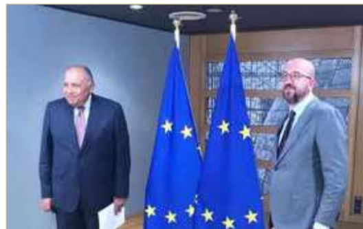
رسالة السيسي تصل لرئيس المجلس الأوروبي وسد النهضة بالمقدمة

الموضوعات الإقليمية، وفي مقدمتها قضية سد النهضة وليبيا والسلام في الشرق الأوسط. وأكد وزير الخارجية المصري تقدير مصر لليبان الذي أصدره الاتحاد الأوروبي أخيرا، والذي انتقد إعلان إثيوبيا بدء الملء الثاني للسد دون التوصل إلى اتفاق مع دولتي المصب؛ مع تأكيد مطالبته بأهمية وضع خارطة طريق للتوصل إلى اتفاق عادل وملزم في إطار زمني محدد.