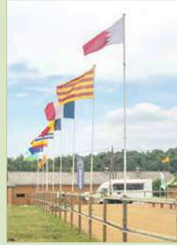
علم مملكة البحرين برفرف