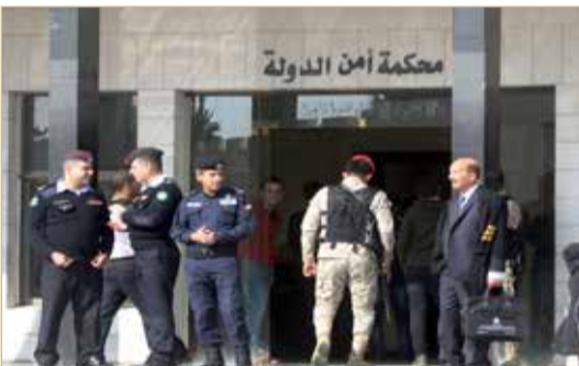
مقر محكمة أمن الدولة الأردنية