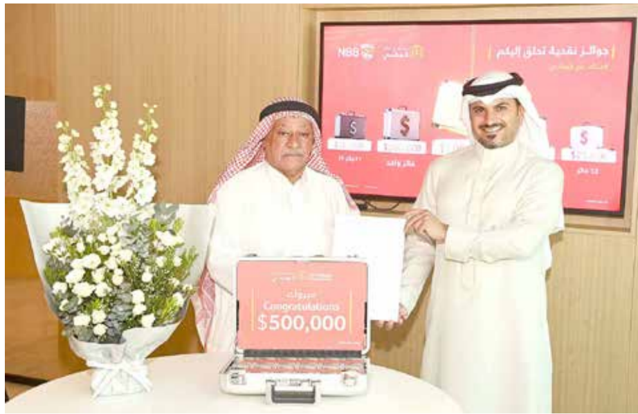
الرياني يسلم الفائز بالجائزة الكبرى

أعلن بنك البحرين الوطني (NBB) عن 6 فائزين في برنامج "ادخار الوطني"، وذلك مع إقامة السحب على الجائزة الكبرى والجوائز الشهرية المخصصة لشهر يونيو. واستضاف البنك حفل تسليم جوائز البرنامج في مقره الرئيسي في المنامة أمس، وتم الكشف عن قيمة هذه الجوائز لأول مرة للفائزين خلال المناسبة، ما أضاف أجواء من البهجة والمفاجئة السارة إليهم. وأقيم الحفل بحضور منتسبي وسائل الإعلام المحلية، ومع حضور الرئيس التنفيذي للخدمات المصرفية للأفراد في بنك البحرين الوطني وعدد من أعضاء فريق عمل البنك.