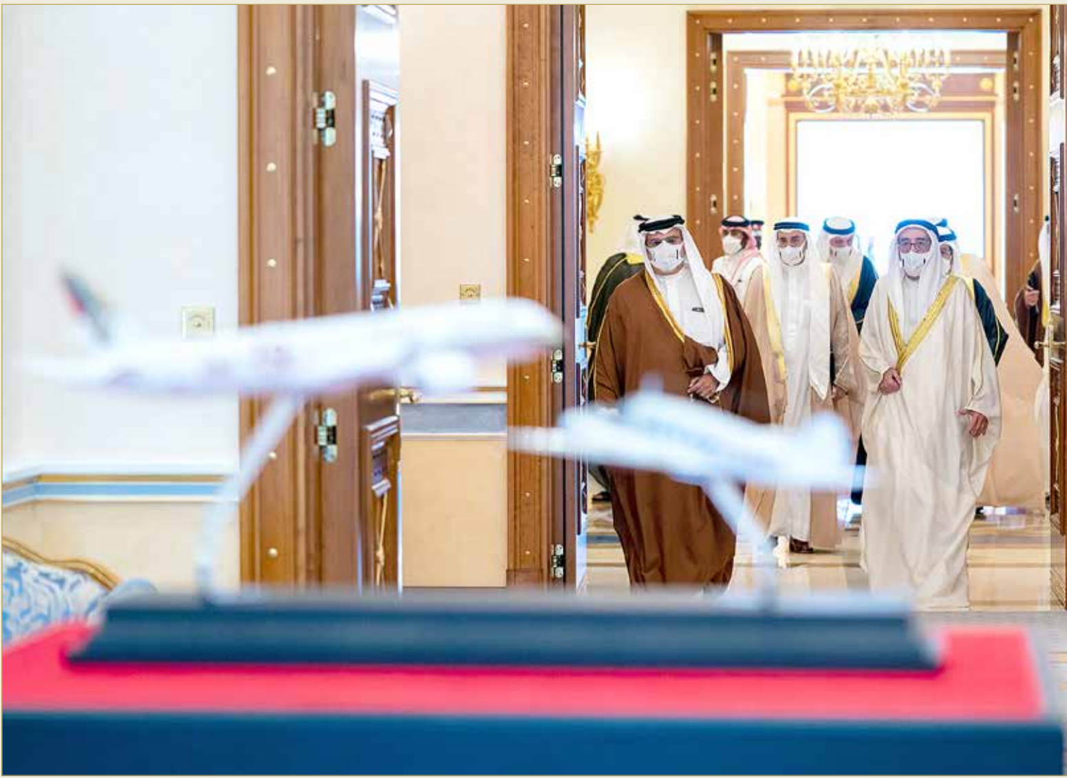
سمو ولي العهد رئيس مجلس الوزراء ملتقيا في قصر القضيبيية أمس وزير الصناعة والتجارة والسياحة رئيس مجلس إدارة شركة طيران الخليج