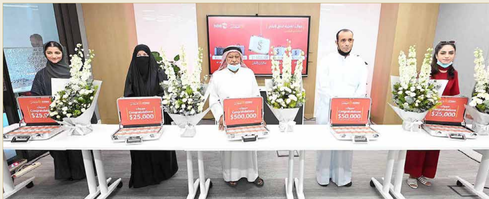
الفائزون بالجائزة الكبرى والجوائز الشهرية

البلاد | أمل الحامد | تصوير: رسول الحجيري