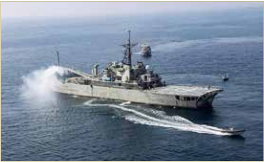
سفينة تابعة للبحرية الإيرانية