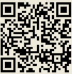
شاهد فيديو حوار "البلاد" عبر هذا الرابط

- نعم هناك، سيكون ستيفن بانديا، وهو شخص ممتاز جدا، وخدم هنا من قبل ويعرف البلد، وسيتم تأكيد ذلك الأشهر القليلة المقبلة.