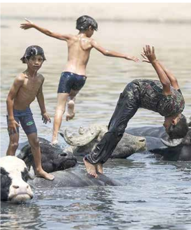
أولاد عراقيون يسبحون مع قطع من الجواميس في نهر دبالى في منطقة الفضلية شمال شرق بغداد، وسط درجات حرارة صيفية شديدة الارتفاع.

تداول رواد مواقع التواصل الاجتماعي مقطع فيديو يوثق مشهد طفل جرفته السيول في إقليم كراسنويارسك الروسي. ويظهر مقطع الفيديو مجموعة من الأطفال وهم يحاولون مساعدة زميلهم في العبور على الضفة الأخرى، لتجرفه السيول عدة أمتار. وتسببت السيول بانهار جدار في ساحة وقوف السيارات، ما أدى إلى تحطم عدة سيارات كانت متواجدة في الموقع. وفرضت إدارة المدينة نظام طوارئ ليوم واحد، وتم إجلاء السكان من المبنى المجاور، حفاظا على أرواحهم. واجتاحت أمطار غزيرة ورياح شديدة موسكو، نهاية شهر يونيو الماضي، ما أدى لاقتلاع أشجار وغرق الشوارع وانتهاء فترة ارتفاع كبير غير معتاد في درجات الحرارة.