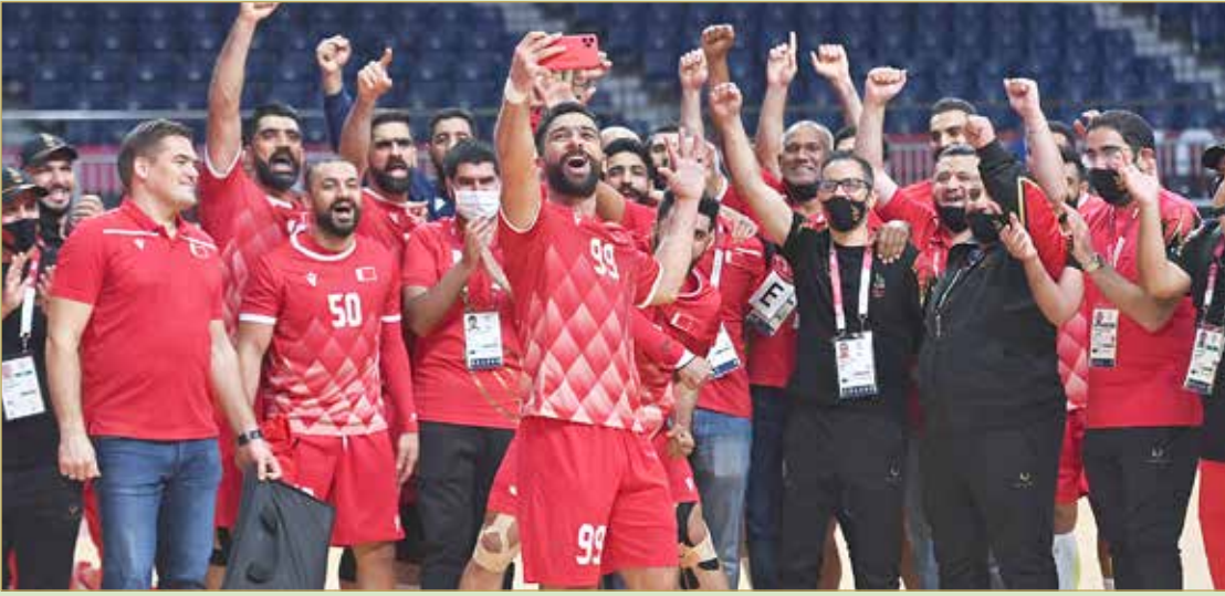
احمر اليد شرف الرياضة البحرينية