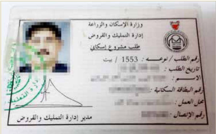
بطاقة الطلب الاسكاني

◆ عمر طلبنا 20 عامًا.. وحرمنا من "إسكان النبيه صالح"