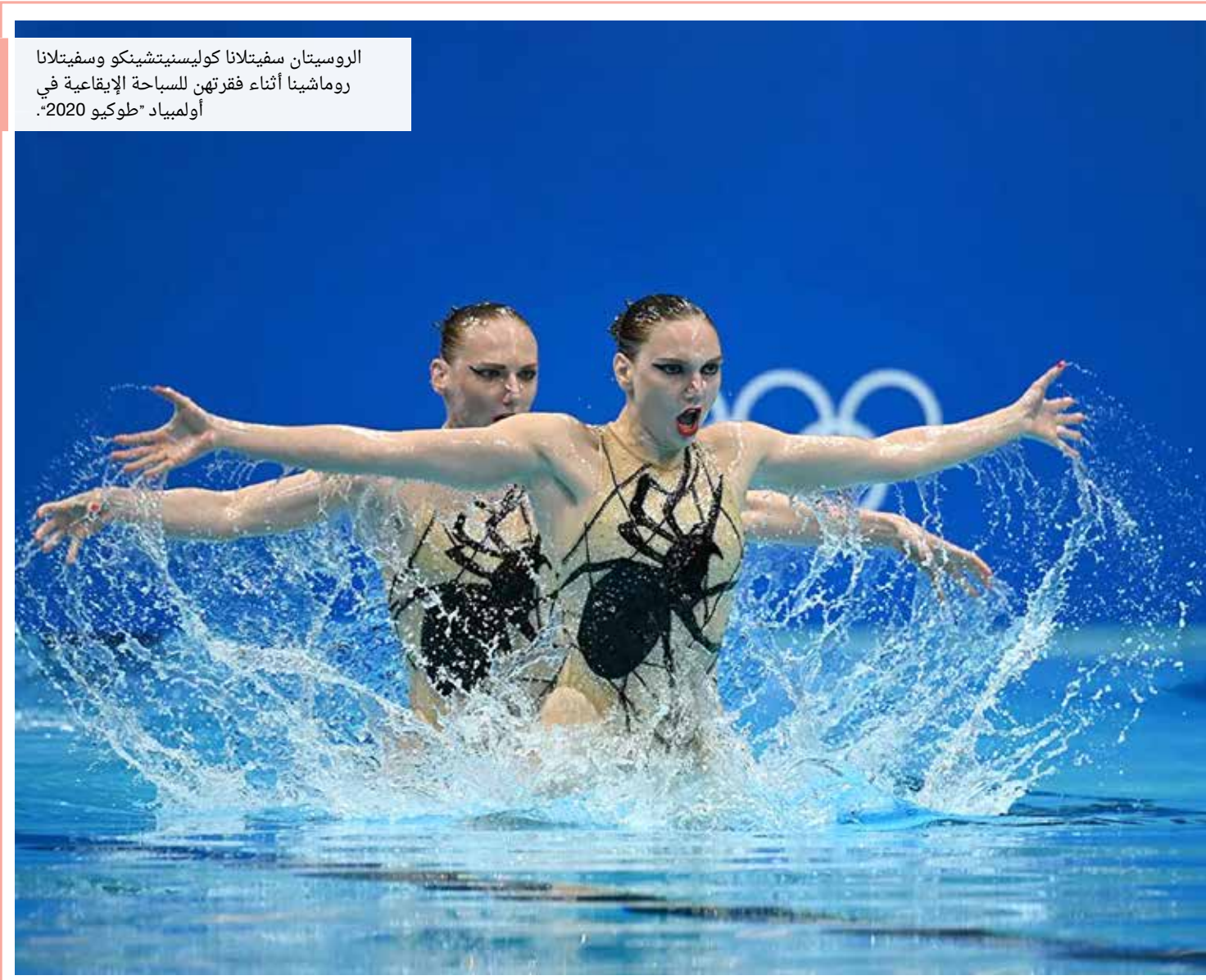
الروسياتان سفياتلانا كوليسنيتشينكو وسفياتلانا روماشينا أثناء فقرتهن للسباحة الإيقاعية في أولمبياد "طوكيو 2020".