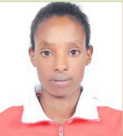
تاج دابا جليسا

الكيدان تخوض نهائي 10 آلاف متر والنصف يطمئن على "بعثة القوى"