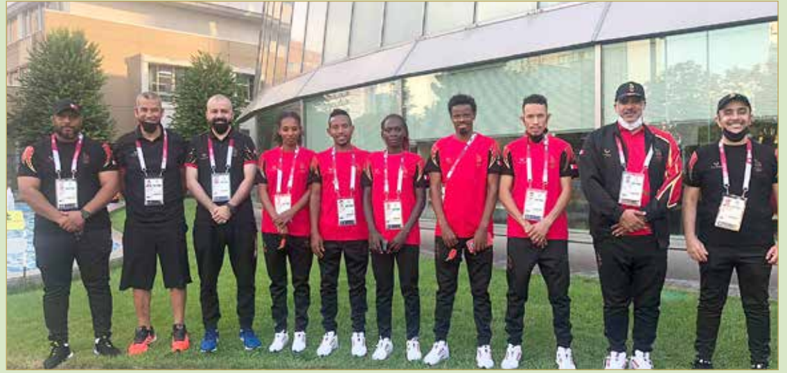
الوفد الإداري مع العدائين والعداءات