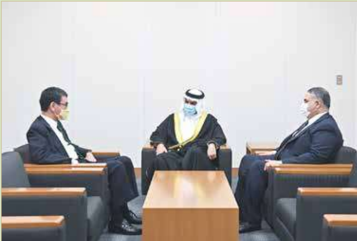
سمو الشيخ عيسى بن علي لدى لقائه الوزير الياباني

كما نقل سموه لـ "كونو تارو" تحيات ممثل جلالة الملك للأعمال الإنسانية وشؤون الشباب رئيس المجلس الأعلى للشباب والرياضة سمو الشيخ ناصر بن حمد آل خليفة، والنائب الأول لرئيس المجلس الأعلى للشباب والرياضة، رئيس الهيئة العامة للرياضة رئيس اللجنة الأولمبية البحرينية سمو الشيخ خالد بن حمد آل خليفة، مشيدا