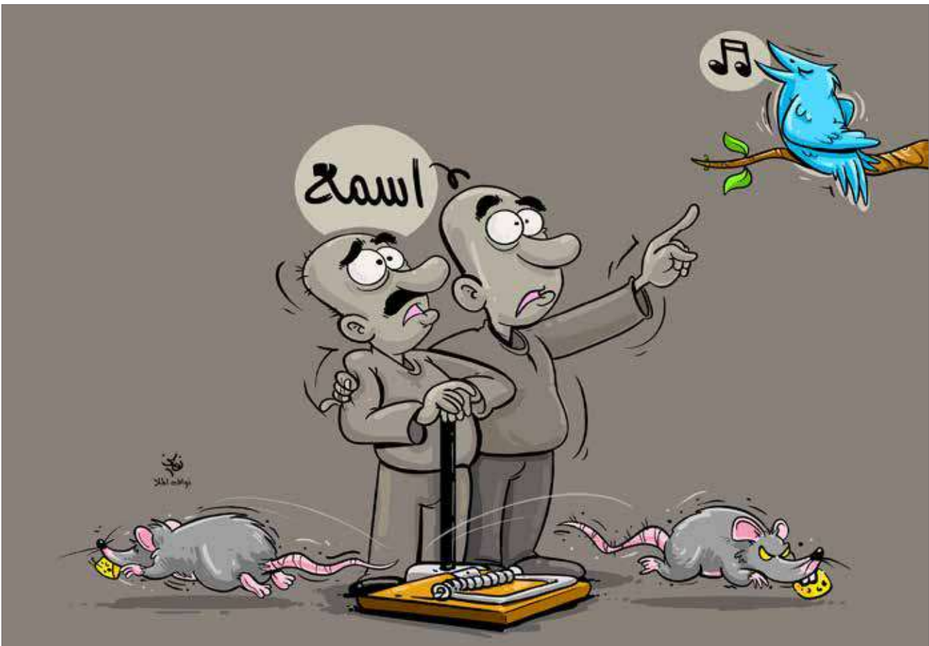
كاريكاتير: فؤاد السلي

ومن القرارات التي استجدت على الساحة البحرينية قرار إسناد مباشرة الحوادث المرورية البسيطة المتصالح عليها إلى شركات تأمين المركبات العاملة في البحرين بدلا من الرجوع للإدارة العامة للمرور، وإلغاء رسوم التقارير كما كان معمولاً به في السابق.