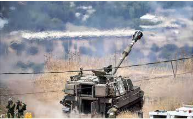
تصعيد عسكري على الحدود اللبنانية مع اسرائيل