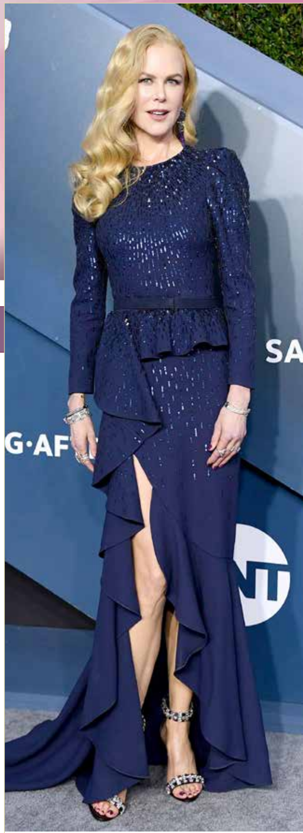
« النجمة نيكول كيدمان ترجع للتلفزيون بمسلسل إثارة وغموض بعنوان Nine Perfect Strangers، تدور قصته عندما يجتمع تسعة اشخاص يُعانون من الإجهاد في منتج صحي مُنعزل تبدأ بعدها سلسلة من الأحداث المُخيفة!

ولفت المسح إلى أنه في الوقت نفسه، قال عامل آخر من بين كل 3 إن العودة إلى العمل من المكتب كان لها تأثير إيجابي على صحتهم العقلية. وأوضحت "سي إن بي سي" أن استجابات العاملين السلبية لخطط العودة إلى العمل، إضافة إلى العدد المتزايد حالياً من الإصابة بالمتحور "دلتا" تعقد خطط أصحاب العمل لإعادة الموظفين إلى المكتب في الخريف.