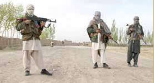
مسلحو "طالبان" يسيطرون على عاصمة نيمروز