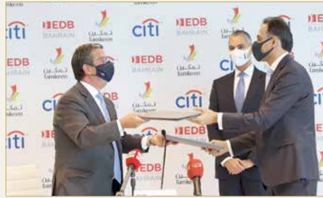
تبادل الاتفاقات بين الجانبين

وأضاف سعيد “وبمرور الوقت، ومن جانبه، قال الرئيس التنفيذي لدى سي تي البحرين، ميشال صوايا “تسارعت وتيرة الأتمتة والرقمنة في قطاع الخدمات المالية بشكل كبير في العامين الماضيين، حيث يساهم تدشين مركزنا التكنولوجي في التوسع بسرعة لتلبية الطلب العالمي المتزايد من العملاء على الحلول الرقمية.” وأضاف “يسعدنا أن يكون لدينا مركز تكنولوجي في البحرين، للاستفادة من عدد كبير من المواهب المتنوعة التي توفرها المملكة وتوظيف تقنيين مؤهلين على دراية تامة بقطاع الأعمال. وإنني على ثقة من أن المركز