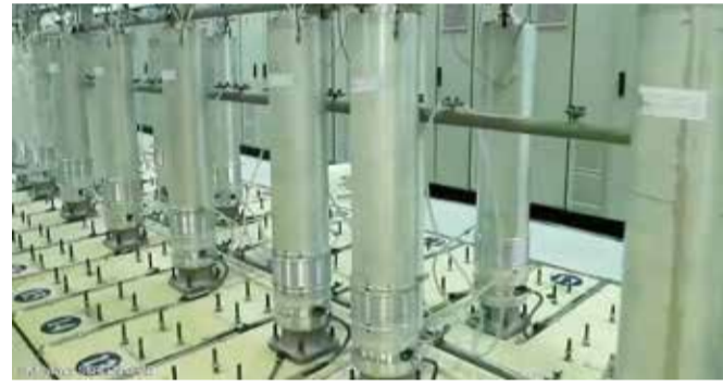
إيران لا تسمح بدخول ورشة تصنيع أجهزة الطرد المركزي

ويتجاوز الشروط المتفق عليها في البيان المشترك. وقال كاظم تويرت إن "أي قرار تتخذه إيران بشأن أجهزة المراقبة يستند فقط على اعتبارات سياسية وليست قانونية، ولا يمكن للوكالة ولا ينبغي لها أن تعتبره أحد استحقاقاتها"، وفقًا لروبيرز. وكان من الممكن أن يقضي هذا القرار على آمال استئناف محادثات أوسغ بشأن إحياء الاتفاق النووي الإيراني، إذ عادة ما تشعر طهران بالفق إزاء مثل هذه التحركات.