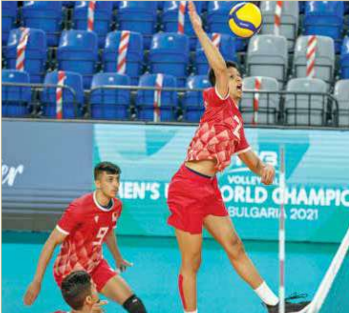
من لقاء منتخبنا وكندا

ويلتقي منتخبنا في المواجهة الثانية اليوم أمام كوبا الساعة 4:00 م بالتوقيت المحلي لمملكة