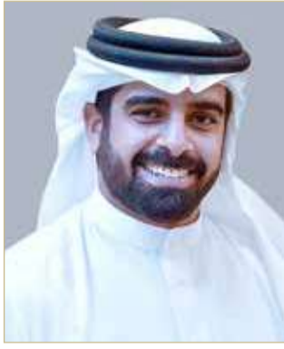
سمو الشيخ سلمان بن محمد