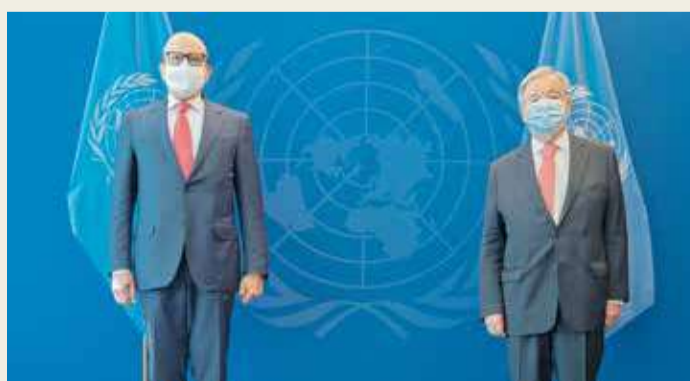
وزير الخارجية ملتقيا الأمين العام للأمم المتحدة

اجتمع وزير الخارجية عبداللطيف الزياتي، أمس، في مقر الأمم المتحدة، مع الأمين العام للأمم المتحدة، أنطونيو غوتيرش، وذلك بمناسبة مشاركة وزير الخارجية في أعمال الدورة السادسة والسبعين للجمعية العامة للأمم المتحدة.