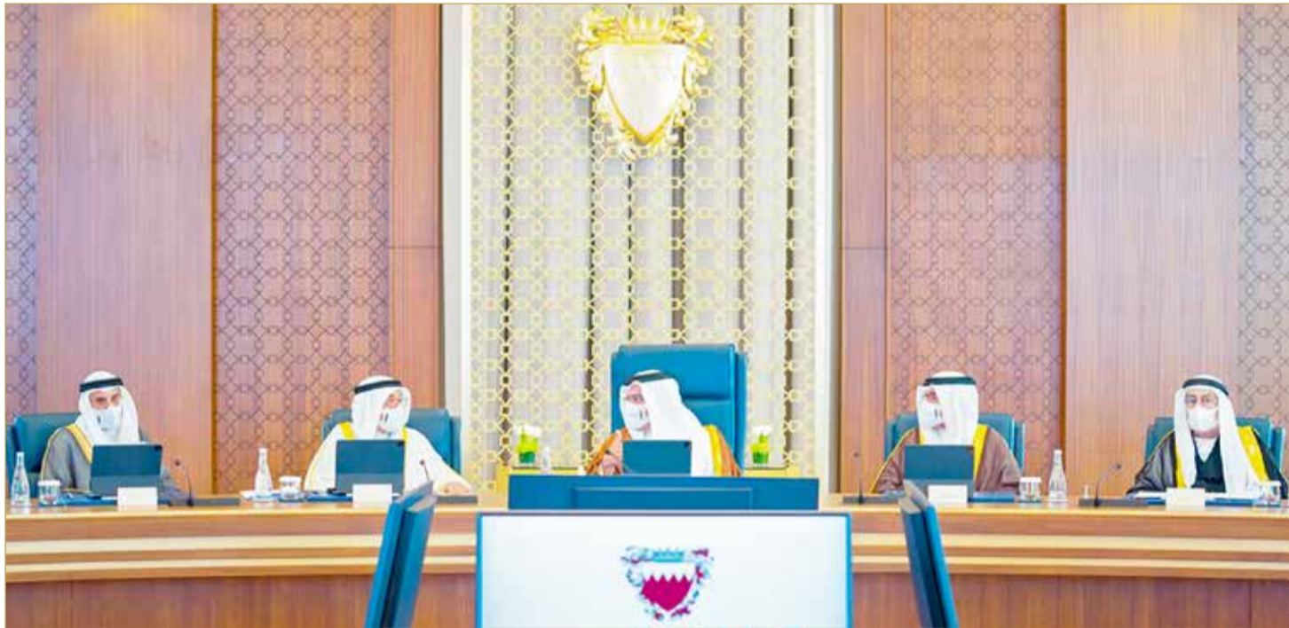
سمو ولي العهد رئيس مجلس الوزراء يترأس الاجتماع الاعتيادي الأسبوعي لمجلس الوزراء

نمو الاقتصاد بنسبة 20.7% بالربع الثاني من 2021 مقارنة بـ 2020