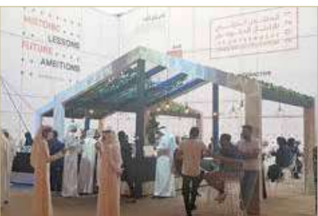
المنتدى فتح المجال لحوارات جانبية