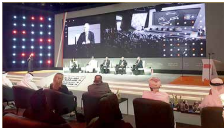
... وحوار عن فاعلية وسائل الاتصال الحكومي