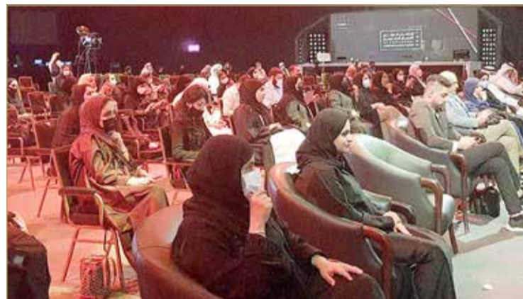
حضور جلسات اليوم الثاني

◆ اختفاء العقلاء والمعنيين له أثره السلبي في مناعة الوعي الجمعي