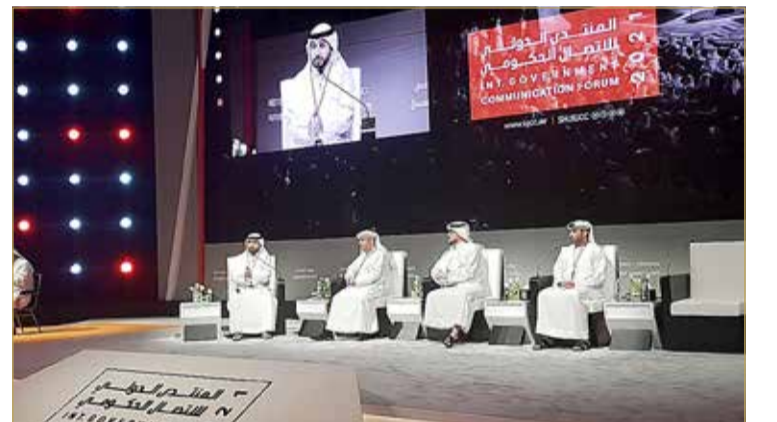
جانب من جلسة الوعي الجمعي