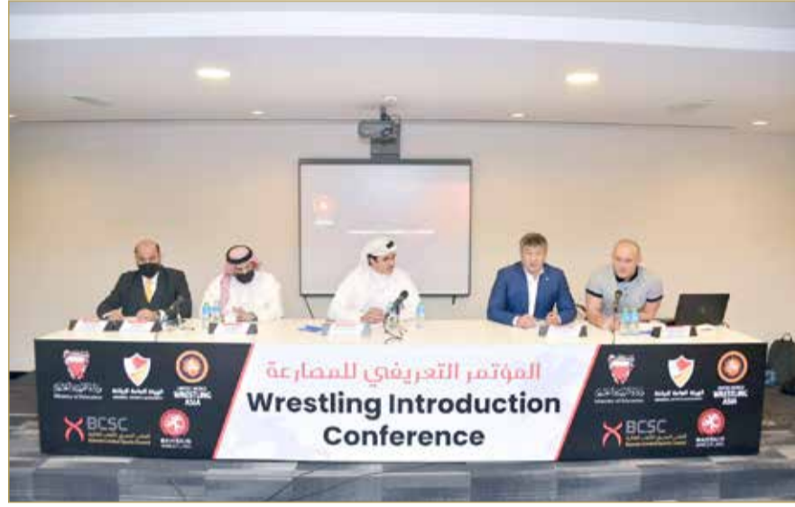
جانب من المؤتمر

الملا: المدارس بيئة مثالية لتكوين قاعدة لرياضة المصارعة