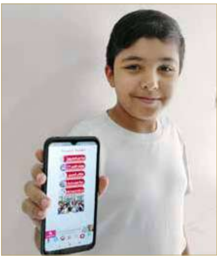
مشاركة الزيارات رقمياً