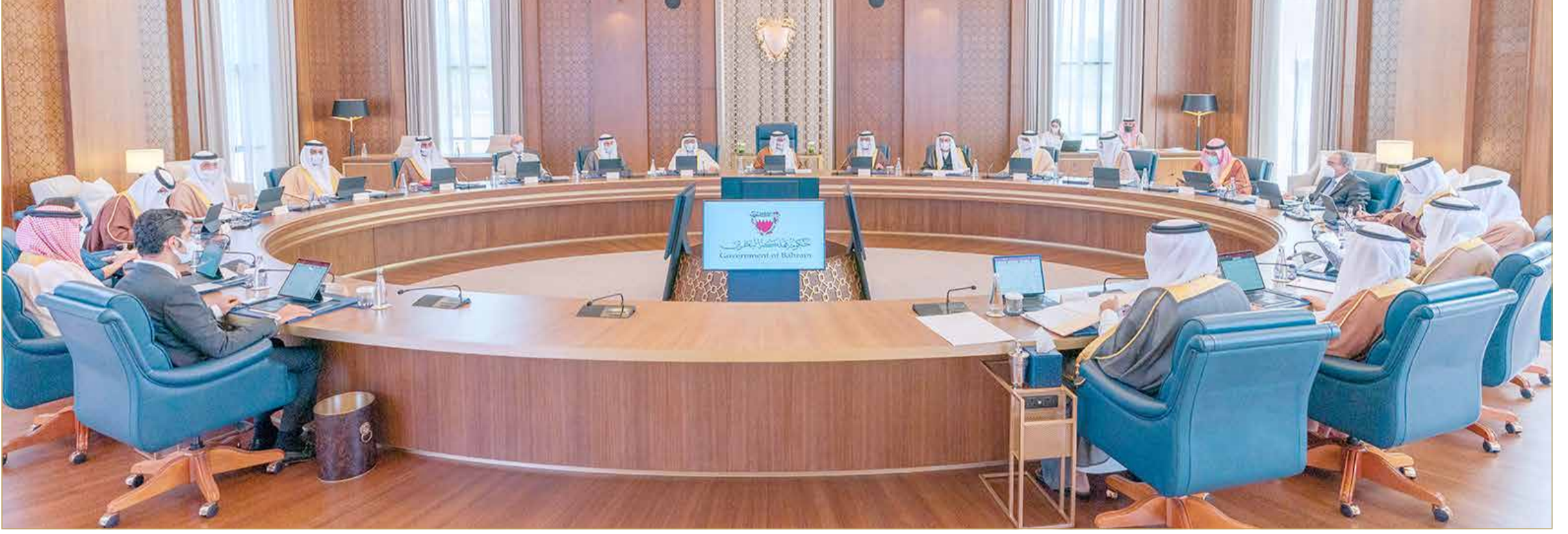
سمو ولي العهد رئيس مجلس الوزراء يترأس الاجتماع الاعتيادي الأسبوعي لمجلس الوزراء

◆ نمو الاقتصاد بنسبة 20.7% بالربع الثاني من 2021 مقارنة بـ 2020