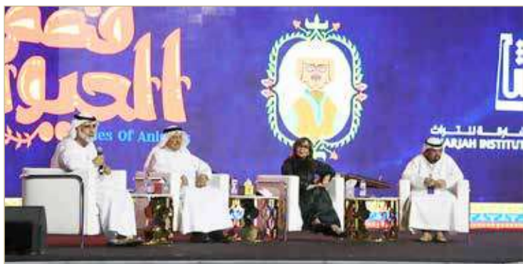
من جلسات الملتقى

وعن هذه المشاركة صرح نجم لـ "البلاد" بأنه اعتاد على المشاركة في ملتقى الشارقة الدولي للراوي منذ سنوات، نظراً لما يمثله هذا الملتقى من حدث ثقافي مهم يعتني بحملة الموروث الشعبي من الرواة والباحثين والمهتمين كل عام في هذا الاحتفال الرائع الذي يوا الشارقة مكانة ثقافية عالية على مستوى دول الخليج والدول العربية والعالم؛ لما تسهم به من جهود في حماية الكنوز البشرية وحفظ التراث الإنساني. ويتم كل عام اختيار دولة من الدول، حيث تحل جمهورية السودان ضيف شرف هذا العام ممثلة في أحمد عبدالرحيم وهو الشخصية الفخرية المكرمة هذا العام تقديراً لإسهاماته في مجال التراث الثقافي، كما سيتم تكريم الحكواتي التونسي عبدالعزيز العروي بوصفه الشخصية الاعتبارية احتفاءً بما تركه من موروث زاخر. وأضاف نجم أن البحرين كانت هي ضيف الشرف في دورة الملتقى السابقة رقم 20 بالعام 2019 قبل حلول جائحة الكورونا التي عطلت أعمال الملتقى حضورياً، وكانت أئيسة فخرو