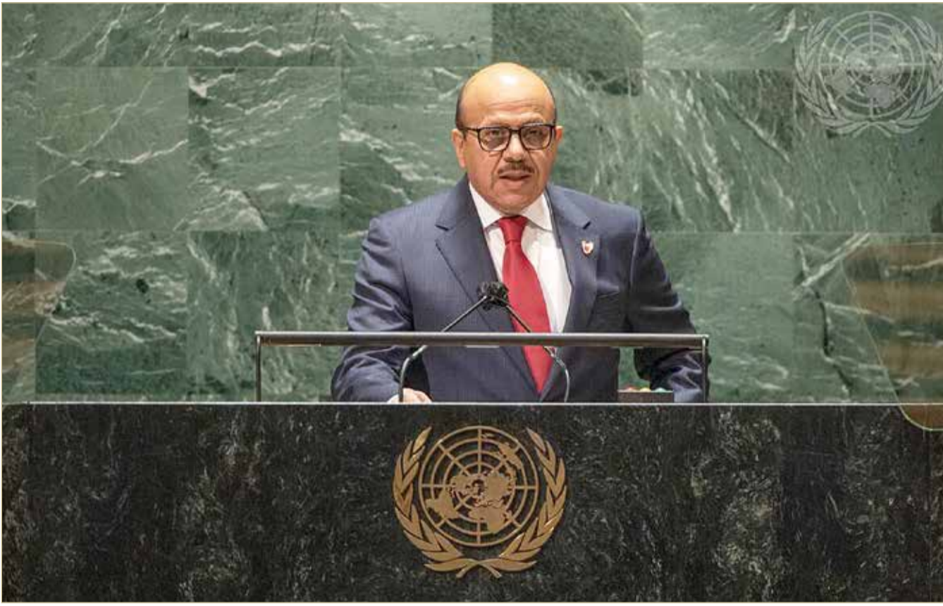
المنامة - وزارة الخارجية

السلام مع إسرائيل خيار استراتيجي لمحاربة التطرف والكرهية