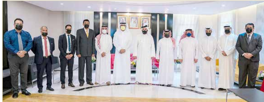
زيارة سمو الشيخ خالد بن حمد إلى النادي الأهلي

مؤكدتين أن جهود سموه واضحة في تعزيز التواصل والتأكيد على دور الأندية كشريك رئيسي في العملية التنموية بهذا القطاع الحيوي، معاهدين سموه نحو المضي قدماً لاستمرار الجهود لتحقيق كل ما من شأنه رفعة وازدهار الرياضة.