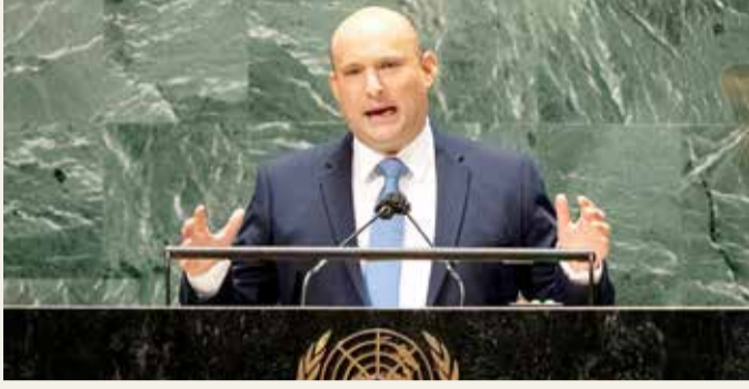
نفتالي بينيت متحدًا في الأمم المتحدة

قال رئيس الوزراء الإسرائيلي نفتالي بينيت أمس الاثنين، إن إيران تجاوزت "كل الخطوط الحمراء" في برنامجها النووي، متعهدًا ألا تسمح إسرائيل لطهران بامتلاك سلاح نووي. وفي أولى كلماته أمام الجمعية العامة للأمم المتحدة، قال بينيت إن إيران تسعى للهيمنة على الشرق الأوسط "تحت مظلة نووية"، مشددًا على أن "الكلمات لا توقف أجهزة الطرد المركزي".