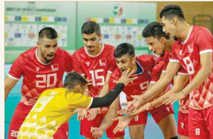
منتخبنا تلقى الخسارة الرابعة