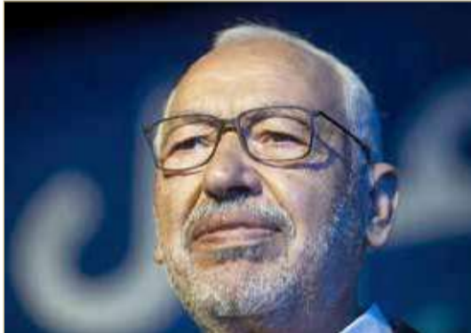
الغوشي حمل مسؤولية الانقسامات داخل النهضة بسبب سياساته

عزلتها وعدم نجاحها بالانخراط الفاعل في أي جبهة مشتركة لمقاومة الخطر الاستبدادي الداهم الذي تمثله قرارات 22 سبتمبر (قرارات الرئيس قيس سعيد). وتأتي الاستقالات بعد فترة من الخلافات بين قيادات توصف بالإصلاحية وبين الغوشي والمحيطين بع تعود لفترة ما قبل الإجراءات الاستثنائية التي اتخذها الرئيس قيس سعيد يوم 25 يوليو الماضي وتممقت بعدها.