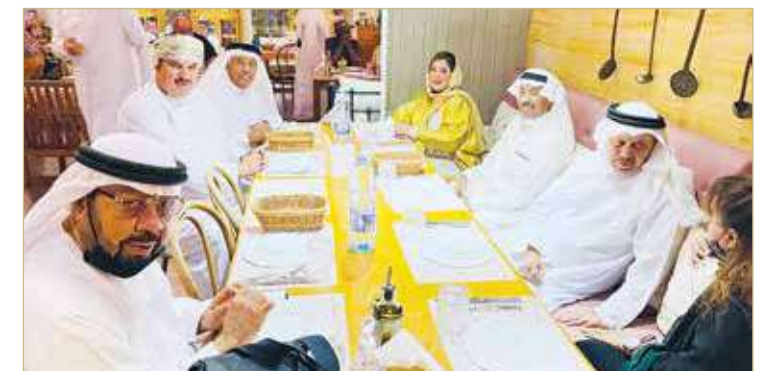
عدد من المدعوين