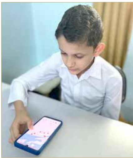
تفاعل طلابي مع التطبيق