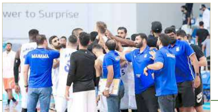
wer to Surprise

غادرت عصر يوم الإثنين بعثة فريق المنامة الأول لكرة السلة إلى جمهورية مصر العربية، وذلك للمشاركة في البطولة العربية للأندية 33 والمقرّر إقامتها خلال الفترة من 29 سبتمبر حتى 9 أكتوبر بضيافة نادي الاتحاد السكندري. ومن المؤمل أن يخوض ممثل كرة السلة البحرينية بعض الحصص التدريبية هناك، يضع من خلالها المدرب اليوناني لمسائه الفنية تجهز