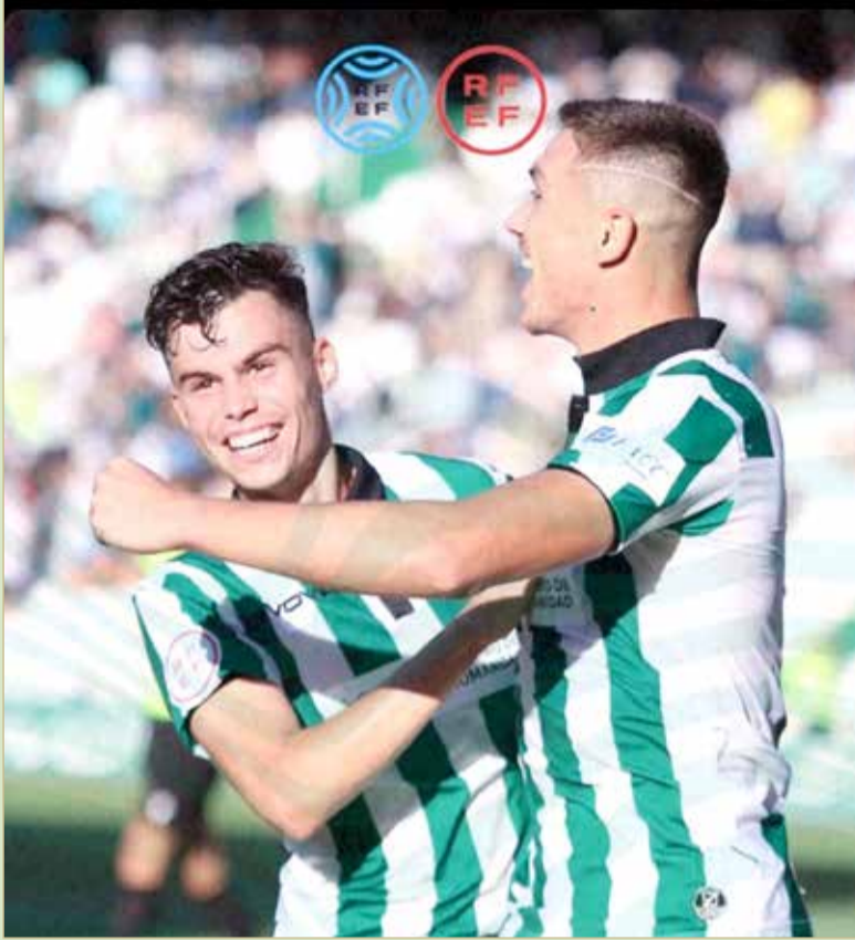
فرحة لاعبي قرطبة بالفوز