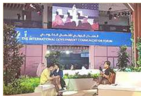
اهتمام إعلامي عالمي بالحدث

تحقيق التناغم بين الذكاء الاصطناعي والذكاء العاطفي والاجتماعي، وسيبحث المنتدى رؤية وتصورات الشباب حول شكل مجتمعات المستقبل والوظائف المتوقعة ومتطلباتها من مهارات وعلوم.