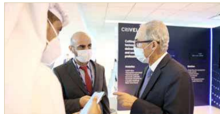
المعراج متحدتاً للصحافيين

أكد محافظ مصرف البحرين المركزي، رشيد المعراج، افتتاح المصرف لأي أفكار جديدة تتعلق بتطوير المنتجات المالية والمصرفية الرقمية التي تحاكي تطور الاقتصاد الرقمي، مشيراً أن هناك عدداً من المنتجات المالية الرقمية الجديدة في مرحلة البيئة التجريبية، وأن المصرف مستمر في تطوير المتطلبات الرقابية في هذا السياق. وكان المعراج يتحدث خلال تدشين المركز العالمي التكنولوجي لـ “سي تي بنك” في البحرين، والذي سيقوم بتطوير مختلف الحلول التكنولوجية لأعمال المجموعة المصرفية العالمية.