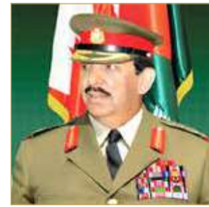
الشيخ خليفة بن أحمد

الصادقة في كل المستويات بما يعكس رؤى وتطلعات عاهل البلاد صاحب الجلالة الملك حمد بن عيسى آل خليفة، داعياً الله عز وجل أن يمد سموه بالعون والتوفيق لخدمة مملكتنا الغالية نحو تحقيق مزيد من الرفعة والنماء في ظل القيادة الحكيمة لجلالة الملك.