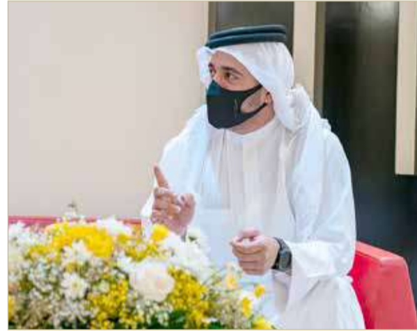
الرفاع - المكتب الإعلامي لسمو الشيخ خالد بن حمد

زار النائب الأول لرئيس المجلس الأعلى للشباب والرياضة، رئيس الهيئة العامة للرياضة رئيس اللجنة الأولمبية البحرينية سمو الشيخ خالد بن حمد آل خليفة، أمس الاثنين، النادي الأهلي و نادي الاتحاد. والتي تأتي ضمن السياسة التي انتهجها سموه لتعزيز التواصل مع الجهات الرياضية، في إطار اهتمام سموه بدعم ومساندة تلك الجهات؛ من أجل تنفيذ الخطط والبرامج التي تسهم في الارتقاء بمستوى الألعاب الرياضية ومنتسبيها، على الشكل الذي يتوافق مع سياسات الهيئة العامة للرياضة؛ من أجل مضاعفة الجهود لتحقيق المزيد من النجاحات في الرياضة البحرينية.