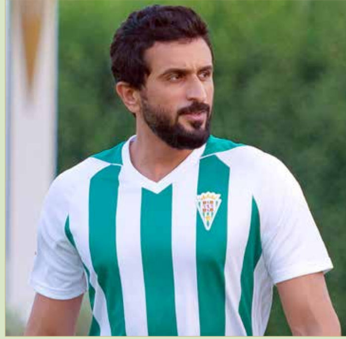
سمو الشيخ ناصر بن حمد

وتمكن قرطبة من تحقيق فوزه الرابع على التوالي في الدوري وهذه المرة على حساب دون بينيتو (3/2)، رافقا رصيده إلى 12 نقطة بتسجيل 14 هدفاً في 4 مباريات.