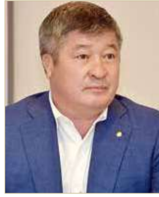
رئيس الاتحاد الآسيوي للمصارعة