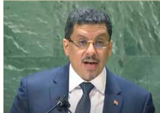
وزير خارجية اليمن، أحمد عوض بن مبارك في كلمته

الحوثيين. فقد أفاد مصدر عسكري في الجيش اليمني أن 58 عنصرًا من المليشيات قضا في الساعات الأربع والعشرين الماضية، في مواجهات وغارات جوية في محافظتي مأرب وشبوة. كما أوضح بحسب ما نقلت وكالة فرانس برس أن طائرات تابعة لتحالف دعم الشرعية قصف مركبات وتجمعات وتعزيبات للمليشيا في مأرب وشبوة بأكثر من 20 غارة جوية خلال الساعات الماضية.