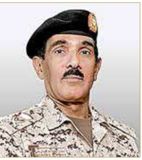
الشيخ سلمان بن عطية