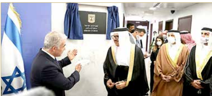
جانب من افتتاح سفارة دولة إسرائيل لدى مملكة البحرين

♦ الزباني ولابيد: فوائد حقيقية وعملية لاختيار السلام