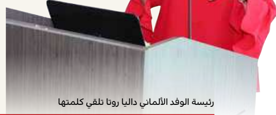
رئيسة الوفد الألماني داليا روتا تلقي كلمتها

بذورها، أشادت رئيسة الوفد التجاري الألماني، داليا سمره روتا، بالعلاقات السياسية والاقتصادية المتميزة القائمة بين البحرين وألمانيا، معربة عن تطلع بلاده إلى تنمية وتدعيم مختلف أوجه التعاون الاقتصادي مع البحرين، وأكدت أن وزارة الاقتصاد الألمانية تنظم برنامجًا مستمرًا للشركات