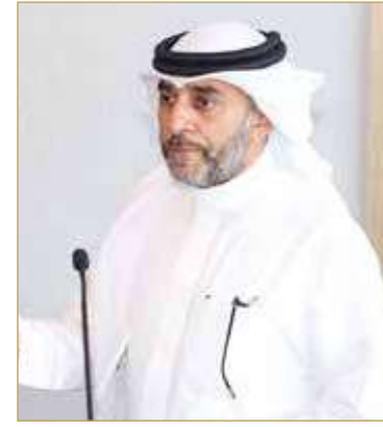
السادة يلقي كلمته في اللقاء

البلاد | المحرر الاقتصادي