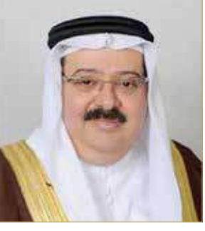
الشيخ نواف بن إبراهيم