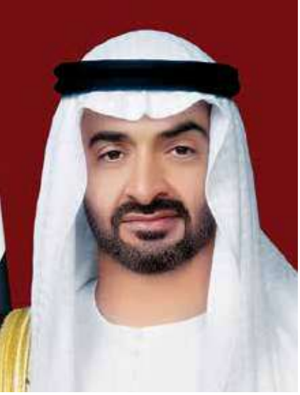
سمو الشيخ محمد بن زايد آل نهيان

جلالة الملك وسمو ولي العهد رئيس الوزراء يهنئان القيادة الإماراتية بافتتاح إكسبو دبي 2020