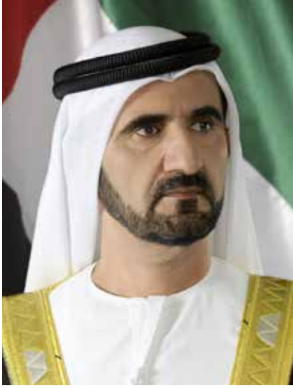
سمو الشيخ محمد بن راشد آل مكتوم