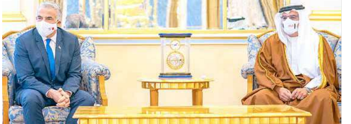
سمو ولي العهد رئيس مجلس الوزراء يلتقي وزير خارجية دولة إسرائيل

♦ سمو ولي العهد رئيس الوزراء: فتح آفاق أرحب لنمو العلاقات مع إسرائيل