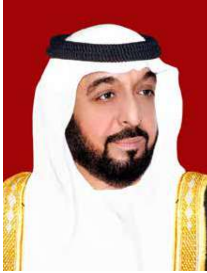
سمو الشيخ خليفة بن زايد آل نهيان