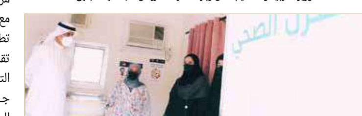
زيارة وزير التربية والتعليم ابتدائية بلفيس للبنات بمنطقة دمستان

تقدم للطلبة عن بعد، وأطلع على نظام الفحص الإلكتروني الذي تنفذه المدرسة لأعضاء الهيئتين الإدارية والتعليمية والطلبة. وفي زيارته إلى مدرسة بلفيس الابتدائية للبنات بمنطقة دمستان، أطلع الوزير على عدد من المشاريع التربوية التي تنفذها المدرسة، والمرتبطة بالإطار الرابع للجودة ومهارات القرن الحادي والعشرين.