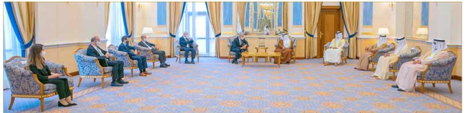
سمو ولي العهد رئيس مجلس الوزراء يستقبل وزير خارجية دولة إسرائيل

بين الشعوب، مجدداً التأكيد على أهمية البناء على إعلان تأييد السلام الذي وقعت عليه مملكة البحرين ودولة إسرائيل لدعم الجهود الدولية للسلام وترسيخ دعائم الأمن والاستقرار في المنطقة والعالم. وقد أقام صاحب السمو الملكي ولي العهد رئيس مجلس الوزراء مأدبة غداء لوزير خارجية دولة إسرائيل والوفد المرافق.