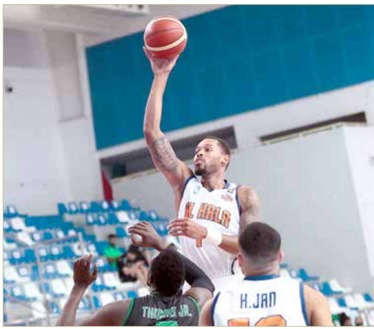
لقاء الحالة والبحرين