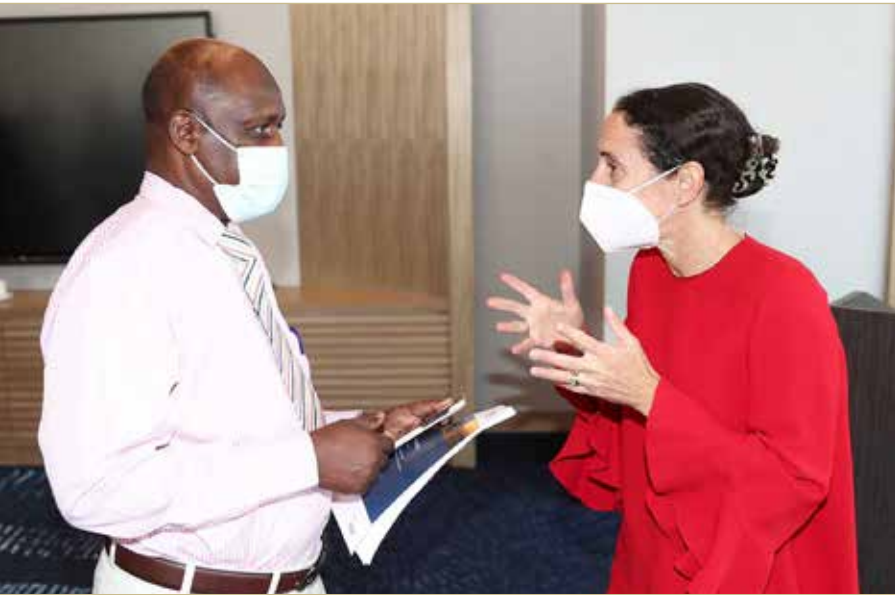
رئيسة الوفد الألماني متحدثة لـ "البلاد"

عالمية للغرف الألمانية في الخارج "AHKS". وتمثل مهمة GESALO في تقديم كل الدعم وتعزيز العلاقات الاقتصادية الثنائية بين ألمانيا والبحرين والسعودية، واليمن، والعمل عن كثب مع مجتمع الأعمال في هذه البلدان والمؤسسات الحكومية الألمانية، وترأس المكتب مفوضة الصناعة والتجارة الألمانية لدى السعودية والبحرين واليمن، الدكتورة داليا سمره روتا، وهي أيضًا رئيسة الوفد الألماني الزائر للبحرين، وقد صرحت قائلة "يقدم المكتب مجموعة واسعة من الخدمات، من بينها دخول السوق، تقديم أبحاث عن السوق، البحث عن شركاء الأعمال، رحلات وفود الأعمال، والترويج للفرص التجارية الجذابة في بين الدول الثلاث والشركات الألمانية".