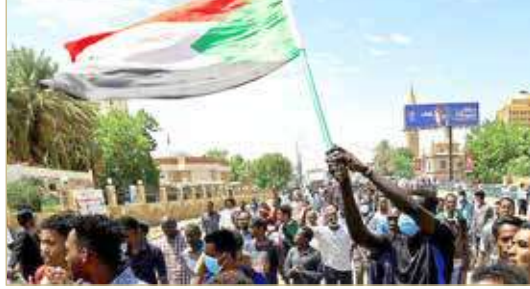
تظاهرة حاشدة في العاصمة الخرطوم

حمودك أمس الخميس، بتسليم جهازي الشرطة والمخابرات للمدنيين، وذلك في ظل استمرار الأزمة بين العسكر والمدنيين. في المقابل، قال رئيس مجلس السيادة عبدالفتاح البرهان إن جهاز المخابرات العامة "سيظل شوكة حوت في حلق كل الإرهابيين". وأضاف البرهان أن "البلاد لن تستغني عن جهاز مخابراتها وكل منسوبيه الذين لا حزب لهم سوى الوطن". كذلك أشار إلى أن "جهاز المخابرات العامة يقوم بأعمال كبيرة من شأنها حماية البلاد وضمان أمنها القومي في صمت".