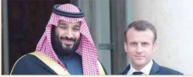
ولي العهد السعودي والرئيس الفرنسي في صورة أرشيفية

وفرص تطويرها وتنميتها في مختلف المجالات بما يحقق المصالح المشتركة للبلدين، وفق ما نقلته وكالة "واس". كما تم خلاله الاتفاق على أهمية الحفاظ على السلام في المنطقة ودعم الجهود الرامية لتعزيز الأمن والاستقرار.