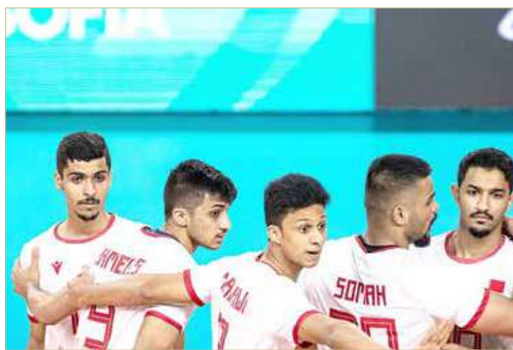
منتخبنا يسعى لأفضل مركز متقدم في عالمية الشباب

يسعى منتخبنا الوطني للشباب لكرة الطائرة إلى تحقيق أفضل مركز متقدم في بطولة العالم تحت 21 التي تستضيفها إيطاليا وبلغاريا حتى 3 أكتوبر الجاري في أول مشاركة للعناصر الحالية في بطولة عالمية.