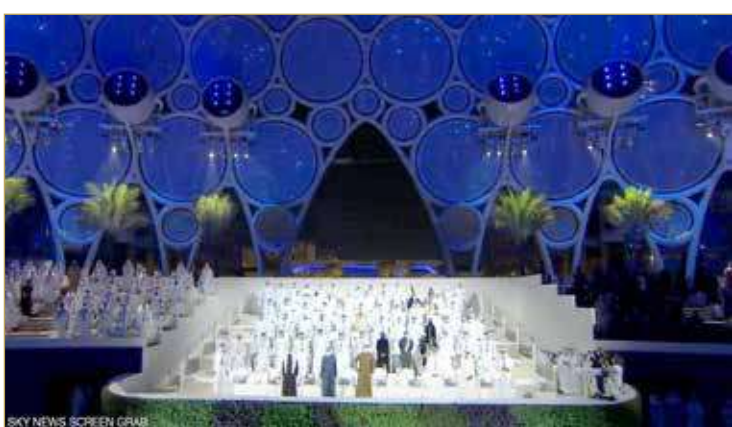
الشيخ محمد بن راشد والشيخ محمد بن زايد آل نهيان في حفل إكسبو 2020

نشهد معا انطلاقة جديدة. نفتتح على بركة الله إكسبو 2020 دبي، ويمتد المعرض، الأكبر والأعرق من نوعه في العالم، على مدار ستة أشهر تحت شعار “تواصل العقول وصنع المستقبل” وبالتركيز على ثلاثة محاور أساسية هي “الاستدامة” و“التنقل” و“الفرص” من أجل رسم ملامح مستقبل العالم عبر حوار ثقافي وإبداعي هدفه تقديم الحلول والابتكارات والأفكار التي تعين على تحقيق طموحات شعوبه وإيجاد آليات أكثر كفاءة لتفعيل العمل المشترك نحو غد أفضل للجميع.