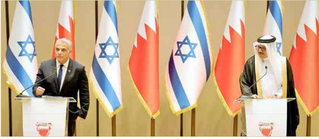
المنامة - وزارة الخارجية

◆ لايبعد: لولا قيادة وإلهام جلالة الملك لما كنا نجتمع اليوم وسنعمل على تعزيز الوثام بيننا