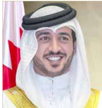
سمو الشيخ خالد بن حمد

تعليق خاص لوسائل التواصل الاجتماعي أظهر أسطورة كرة القدم داني ألفيس دعمًا هائلاً لمفهوم دوري BRAVE الوطني الذي أطلقه سمو الشيخ خالد بن حمد آل خليفة، والذي من المتوقع