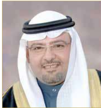
الشيخ خالد بن علي

الآراء الفنية المتخصصة المتاحة، وتمكين الخصوم من اللجوء إلى الخبرة لإثبات الدعوى، وتقديم تقاريرهم عند رفع الدعوى أو أثناء سيرها تبعاً للنظام الإجرائي. وعن التعديل على قانون السلطة القضائية، بين وزير العدل أن القانون يتيح استعمال اللغة الإنجليزية في المحاكم حال انقضاء الأطراف كتابة على ذلك قبل رفع الدعوى، ويكون ذلك في إطار شروط قانونية يتم تحديدها خاصة إذا كانت لغة العقد غير اللغة العربية، وهو ما يقلل كثيراً من التكلفة على الخصوم في ترجمة الأوراق