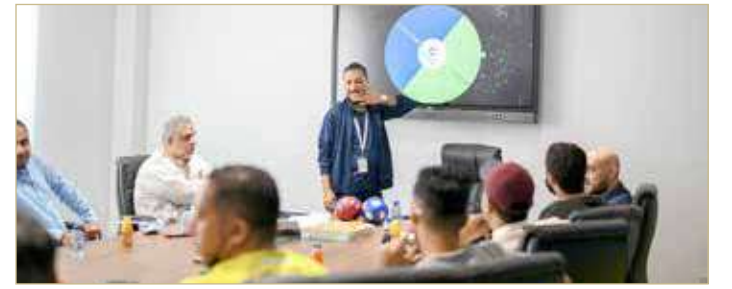
من سحب القرعة

الوسط)، فيما ضمت المجموعة (ب) كلاً من (بوابة دلمون، غرناطة، هاوس مي، وكالة سيد مهدي). وبحسب الجدول، ستكون هناك عدة مباريات للتصفيات في يوم انطلاق الدورة في تاريخ 9 أكتوبر، بدءاً من الساعة السابعة حتى العاشرة مساءً، وذلك على ملعبين في نادي طيران الخليج، وفي اليوم التالي ستقام فيه التصفيات النهائية والتي ستضم الفرق المتأهلة للمنافسة على لقب البطولة، والتي سيكون ختامها في 10 أكتوبر.