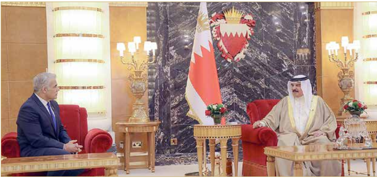
جلالة الملك يستقبل وزير خارجية دولة إسرائيل

في قصر الصخير وزير خارجية دولة إسرائيل يائير لابيد. وفي اللقاء، رحب صاحب الجلالة بوزير الخارجية الإسرائيلي، واستعرض معه مسار العلاقات الثنائية والخطوات التي تساهم في تعزيز مجالات التعاون بين البلدين، في ضوء توقيع إعلان تأييد السلام واتفاق مبادئ إبراهيم، معرباً لجلالته عن ترحيبه بافتتاح سفارة دولة إسرائيل في مملكة البحرين. (02)