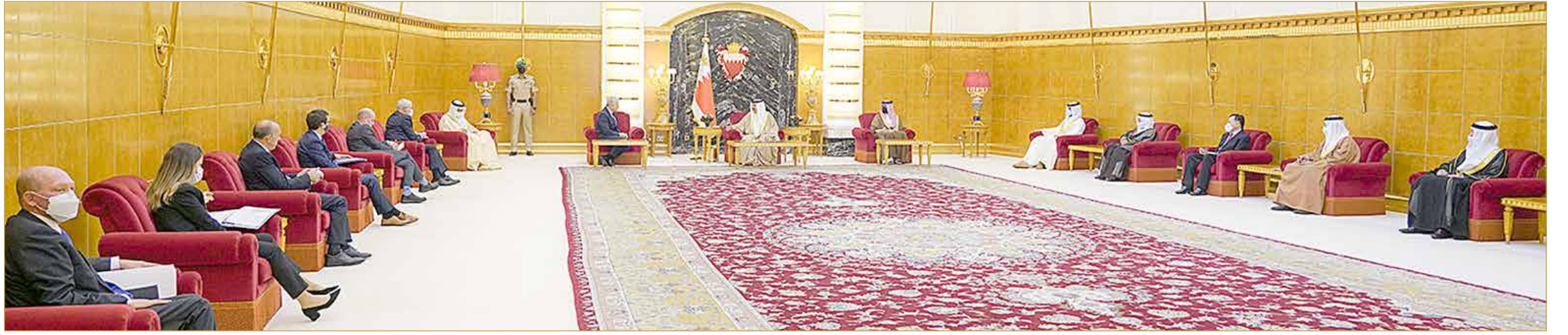
جلالة الملك يستقبل وزير خارجية دولة إسرائيل

◆ اتفاق إبراهيم إنجاز تاريخي مهم لإرساء السلام الشامل في منطقة الشرق الأوسط