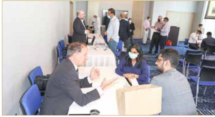
اللقاءات الثنائية بين الجانبين