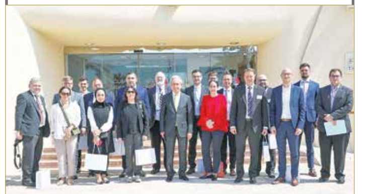
الوفد الألماني لدى زيارته “بابكو”