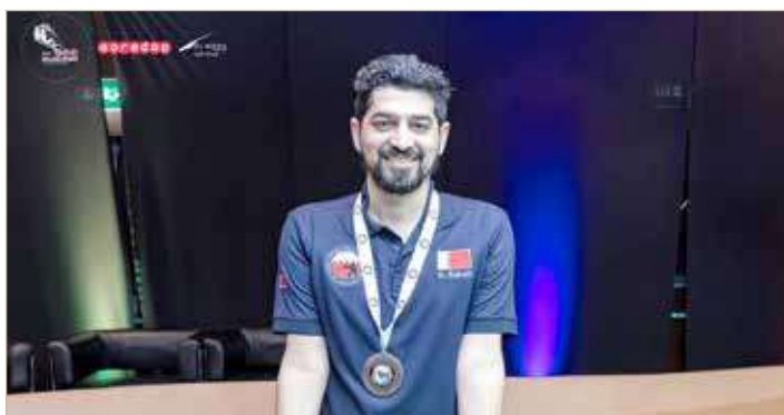
جانب من تتويج اللاعبين بالميداليات

من جانبه وأهدى رئيس الاتحاد البحريني للبليارد والسنوكر والدارتس سعيد اليماني الإنجازات التي حققها المنتخب الوطني إلى النائب الأول لرئيس المجلس الأعلى للشباب والرياضة رئيس الهيئة العامة للرياضة رئيس اللجنة الأولمبية البحرينية سمو الشيخ خالد بن حمد آل خليفة، مؤكداً على أن توجيه ودعم سموه يحفز اللاعبين لتقديم أعلى المستويات