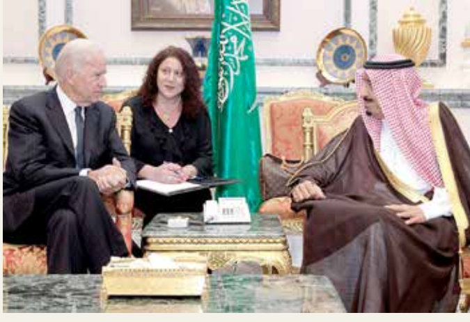
خادم الحرمين الشريفين مستقبلا جو بايدن في صورة أرشيفية

إيران، والمسيطرين على محافظات، بينها العاصمة صنعاء (شمال) منذ 2014. كما أكد سوليفان تأييد بايدن لـ "هدف المملكة بالدفع نحو حل سياسي دائم وإنهاء النزاع اليمني، ودعم الولايات المتحدة التام لهذه المقترحات وجهود الأمم المتحدة للوصول لحل سياسي للأزمة". ودعا المسؤولون إلى "تكثيف الجهود الدبلوماسية للوصول لذلك الهدف"، وأكدوا "أهمية مشاركة الحوثيين بحسن نية في المفاوضات مع الحكومة الشرعية، تحت إشراف الأمم المتحدة".