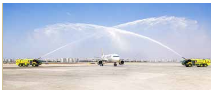
تم الترحيب بالطائرة بحمية كلاسيكية

بدأت طيران الخليج رحلاتها التجارية بين البحرين وتل أبيب عندما أقلعت رحلتها رقم GF972 من مطار البحرين الدولي إلى مطار بن غوريون في الساعة 10:40 صباحاً في 30 سبتمبر 2021.