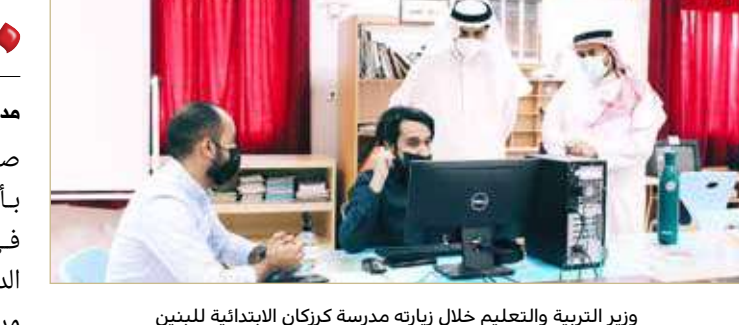
وزير التربية والتعليم خلال زيارته مدرسة كركان الابتدائية للبنين

بمنطقة دمستان، حيث تفقد الوزير في الزيارات سير العملية التعليمية، والإجراءات الاحترازية المتخذة للحفاظ على سلامة منتسبي المدرستين.