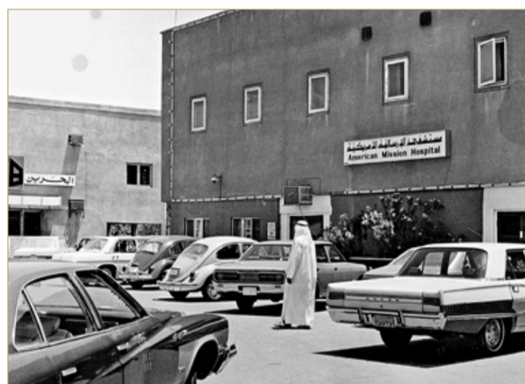
صورة قديمة للمكتبة

بدأت باسم "الكتاب المقدس" وافتتحها زويمر في 1893 بمنطقة الصباغين