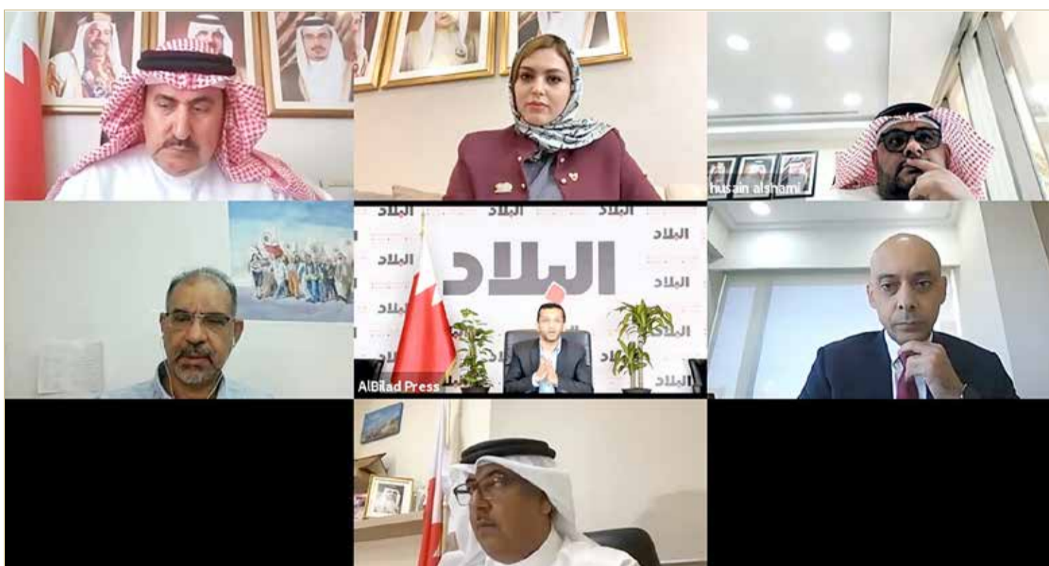
المشاركون بندوة "البلاد"

وأشار إلى أن 70% من العاملين البحرنيين موجودون في القطاع الخاص، وهو ما ينسجم مع الرؤية