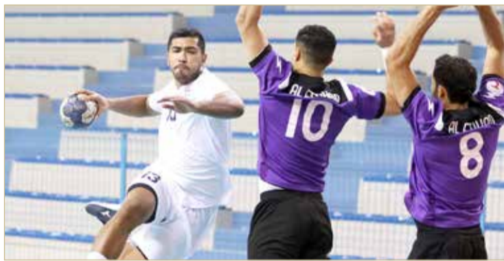
لقاء النجمة والاتحاد