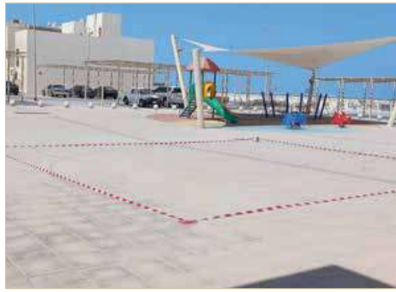
موقع برج الاتصالات

◆ مناشدة هيئة تنظيم الاتصالات التوقف عن تنفيذ المشروع