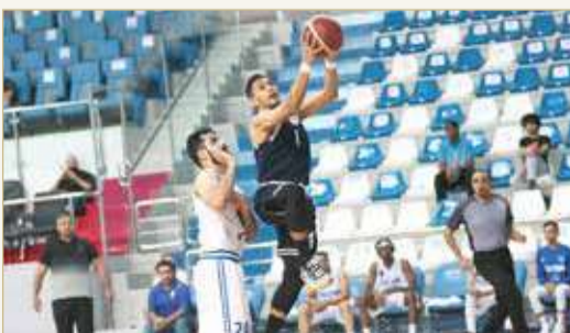
لقاء النجمة ومدينة عيسى

كسب فريق النجمة مواجهة نظيره مدينة عيسى بنتيجة (119/108) في المباراة التي جمعتها مساء السبت في ختام الجولة الثالثة من بطولة دوري زين لكرة السلة للموسم الرياضي 2021 - 2022. وجاءت نتائج الأشواط الأربعة كالتالي: (29/21) النجمة، (35/22) النجمة، (36/25) المدينة، (30/29) النجمة. وبذلك أصبح رصيد النجمة (5 نقاط) من فوزين وخسارة، فيما خسر مدينة عيسى للمرة الثانية على التوالي وصار رصيده نقطتين.