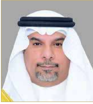
محمد بن دينه

جاء ذلك بمناسبة دخول القرار الوزاري رقم 3 لسنة 2020، الصادر عن الممثل الشخصي لصاحب الجلالة الملك رئيس المجلس الأعلى للبيئة سمو الشيخ عبدالله بن حمد آل خليفة بشأن إدارة المخلفات الخطرة للرعاية الصحية، حيز التنفيذ بتاريخ 25 سبتمبر الماضي. وقال المبعوث الخاص لشؤون المناخ إن القرار الجديد تم إعداده بالتعاون مع الهيئة الوطنية لتنظيم المهن والخدمات الصحية ووزارة الصحة ووزارة الأشغال وشؤون البلديات والتخطيط العمراني، وبالتنسيق مع منظمة الصحة العالمية، مؤكدا حرص المجلس الأعلى للبيئة على مواكبة القرار الجديد مع النمو في القطاع الصحي والأخذ بمبرئيات المختصين