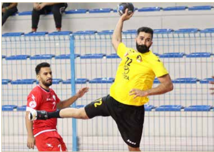
لقاء الأهلي والاتفاق