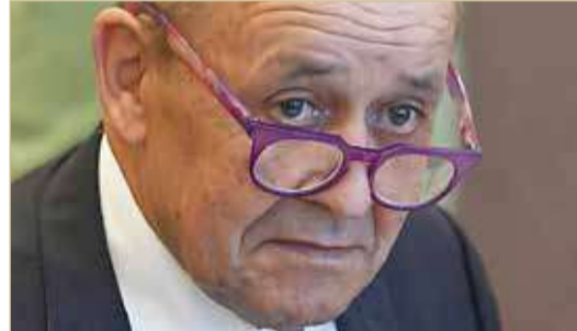
وزير الخارجية الفرنسي

مع مصالحننا المشتركة"، وذلك ردا على سؤال عما إذا كانت بكين تؤدي دورا بناء بما فيه الكفاية مع طهران التي تربطها بها علاقة وثيقة.