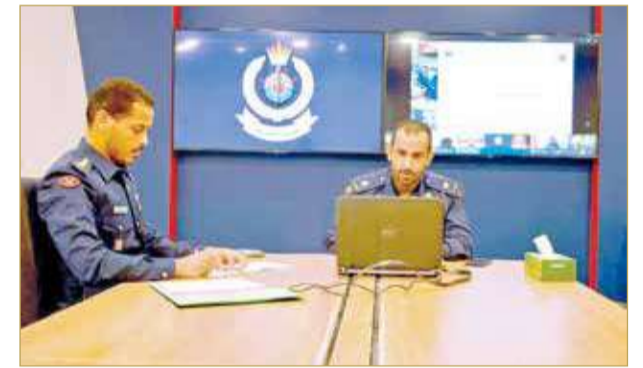
المنامة - وزارة الداخلية

شارك وفد من قيادة خفر السواحل في أعمال اللقاء التمهيدي السابع عشر لاجتماع رؤساء وكالات الأمن البحري وقيادات خفر السواحل بالمنطقة الآسيوية، الذي عقد عبر تقنية الاتصال المرئي "عن بعد" بتنظيم جمهورية فينتام الاشتراكية.