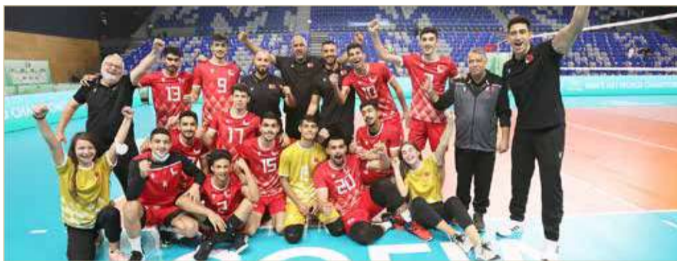
منتخبنا بعد فرحة الانتصار

حقق منتخبنا الوطني للشباب لكرة الطائرة انتصاره الأول في بطولة العالم تحت 21 التي ستختتم اليوم (الأحد) بعدما فاز على المغرب بثلاثة أشواط نظيفة في مواجهة التي جمعتها أمس بمدينة صوفيا البلغارية في مباراة تحديد المراكز الترتيبية من 13 لغاية 16. وانتهت الأشواط الثلاثة كالتالي 25/13، 25/22، 25/22.