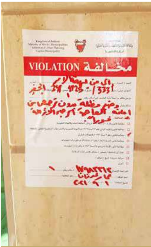
ملصق أمانة العاصمة

ناشد أمانة العاصمة التدخل وعدم الاكتفاء بوضع ملصق عن المخالفة