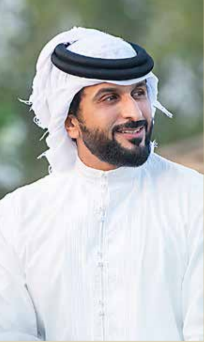
سمو الشيخ ناصر بن حمد

الدرج ستي في يحصد مرحلة لكوين بطواف كرواتيا