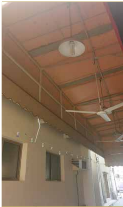
المظلة تمنع المواطن من التصرف في بيته

ووديا وغير الجهة المختصة، ما زلت محروما من التصرف في بيتي بتركيب الضرورات التي تظل على العمر".