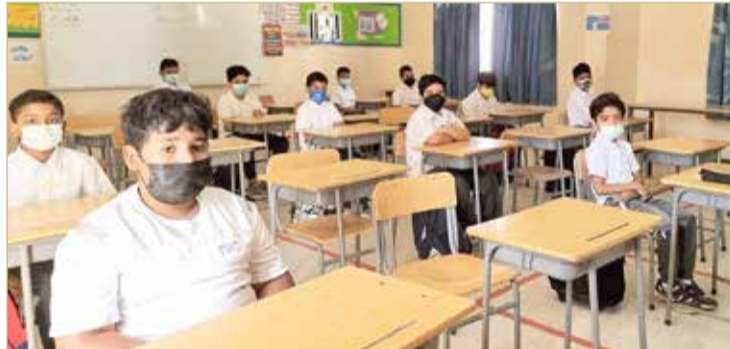
الحضور بابتدائية خالد بن الوليد

قبل الفريق الوطني الطبي. ويتضمن برنامج عمل المدارس اجتماعات مستمرة للهيئات الإدارية والتعليمية؛ ليحث كل جوانب العمل، إضافة إلى المتابعة المكثفة للصفوف والمرافق المدرسية لطلبة الحضور الفعلي، وتحديد مراكز مدرسية لبث الفصول الافتراضية داخلياً، وتنفيذ ورش تدريبية للمعلمين حول تطبيق الأدوات الرقمية، وتشكيل فرق متنوعة مثل: الخط الساخن لأولياء الأمور، والدعم التقني لتسهيل استخدام الأدوات الرقمية، والدعم الأكاديمي لمتابعة بيانات الطلبة وحالتهم الصحية لتوفير الخدمة المناسبة لهم، إضافة إلى فرق للتدريب على المهارات التكنولوجية، وآخر لمتابعة التطور الشخصي للطلبة وحثهم على الانتماء الدراسي والمشاركة في الأنشطة المدرسية.