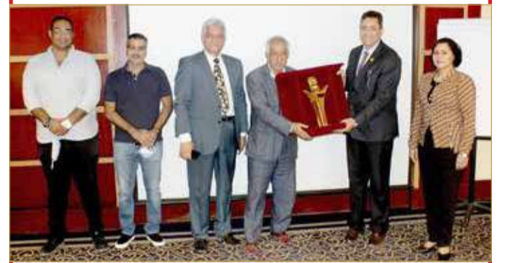
أثناء استلام الجائزة