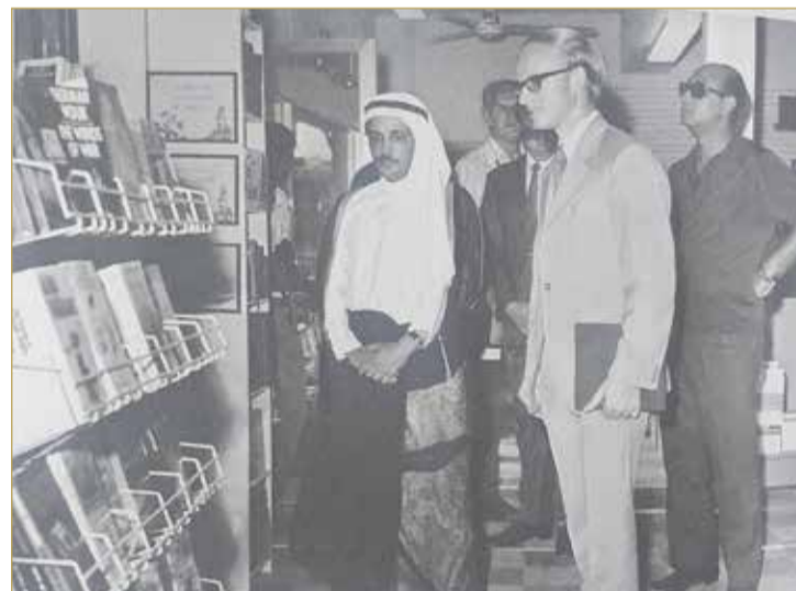
الشيخ عيسى بن محمد آل خليفة يفتتح المبنى بالمعام 1973