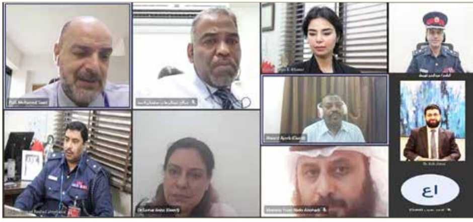
المنامة - وزارة الداخلية

♦ يساهم في علاج الإدمان.. والأول من نوعه بالشرق الأوسط