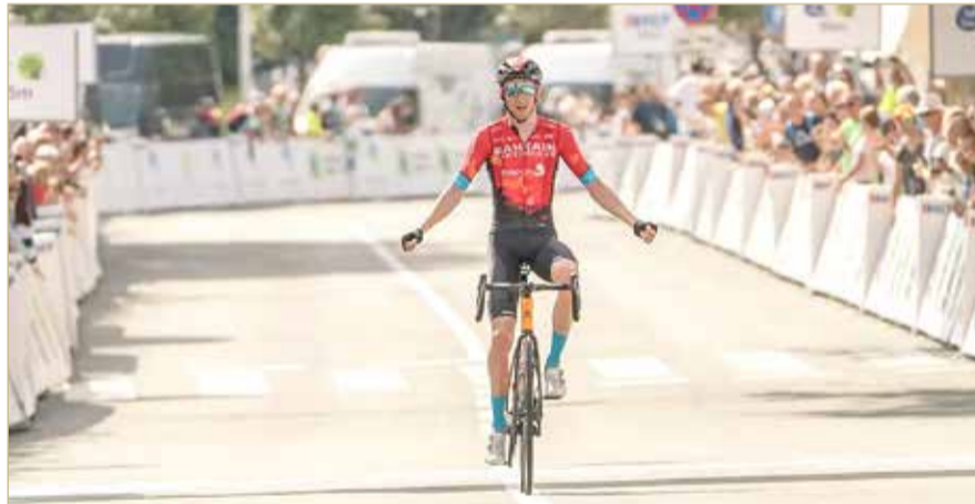
الدرج ستي في

واستطاع الدرّاج ستي في الحصول على المركز الأول في مرحلة لكوين بطواف كرواتيا وسط منافسة قوية ومثيرة، ليؤكد الفريق قدراته الكبيرة ومواصلة تحقيق إنجازات.