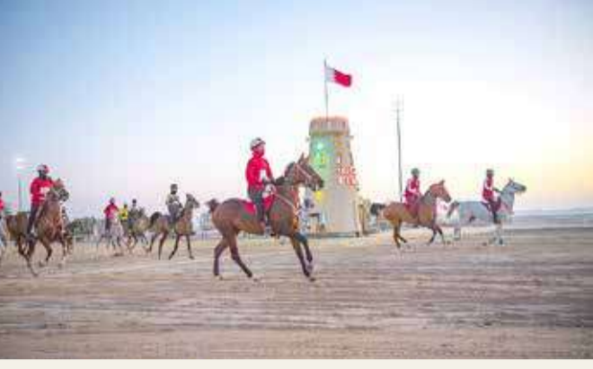
من منافسات القدرة

بمناسبة قرب انطلاق الموسم يوم الجمعة المقبل