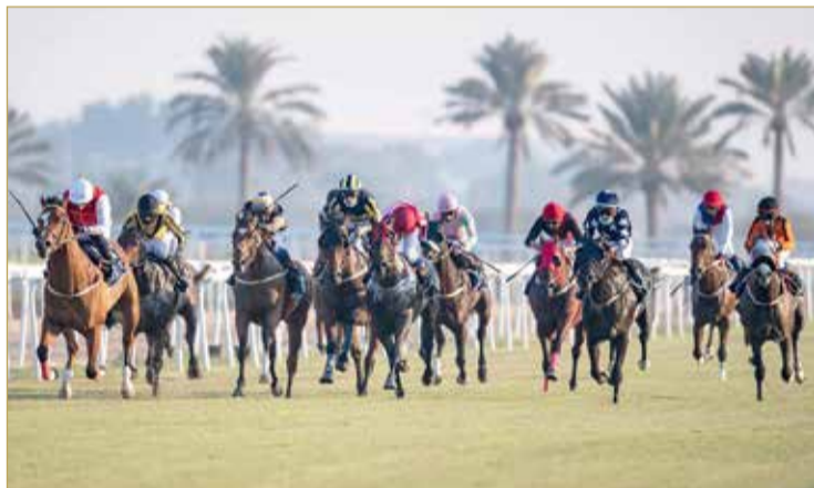
منافسات قوية بالسباق الافتتاحي

خوض منافسات السباق والسعي الى تحقيق الانتصارات بكؤوس السباق الافتتاحي وحصد الجوائز المالية، ووسط توقعات بأن تشهد الشوطين السادس والسابع أقوى وأبرز أشواط المستورد في سباق الافتتاح في ظل مشاركة جواد قوية بإمكاناتها وانتصاراتها، فيما سيكون الشوط الأخير مفتوحاً للمنافسة بين مجموعة من جواد الإنتاج المحلي التي تسعى للفوز بكأس الافتتاح للمرة الأولى.