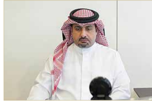
الشيخ ناصر بن محمد متحدًا في اللقاء

وبشأن التقارب الكبير في الأسعار بين باقات الاتصالات التي تقدمها الشركات والخدمات، قال الشيخ ناصر إن الهيئة تترك عملية تحديد ذلك المنافسة بين الشركات الثلاث، مشيراً إلى أن الشركات كلما تمكنت من تخفيض تكاليفها فإنها ستكون قادرة على تقديم أسعار أقل للمستهلكين، موضحاً أن الهدف من فصل عمليات “بتلكو” وإنشاء شركة “بي نت” هو عملية مراقبة الأسعار المقدمة وإتاحة البنية التحتية بأسعار مناسبة