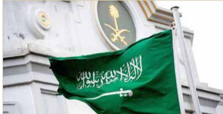
أكدت السعودية أن تصريحات قرداحي حملت إساءات

على تصريحات وزير الإعلام اللبناني جورج قرداحي، والتي تعكس فهماً قاصراً وقراءة سطحية للأحداث في اليمن. وكانت الخارجية الكويتية قد استدعت في وقت سابق من أمس القائم بالأعمال اللبناني لديها احتجاجاً