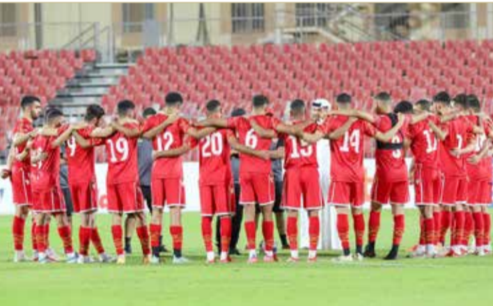
من تدريبات منتخبنا الأولمبي

يخوض منتخبنا الأولمبي عند 7:15 من مساء الخميس 28 أكتوبر الجاري، لقاء الجولة الثانية من التصفيات المؤهلة لكأس آسيا تحت 23 عامًا 2022، حينما يلاقي المالديف ضمن المجموعة الثالثة، على استاد الشيخ علي بن محمد آل خليفة.