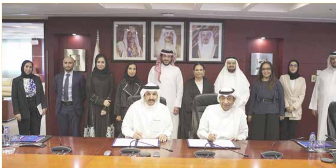
أثناء توقيع التفاهمات بين الجانبين

وتضمنت المذكرة تبادل الخبرات وتوظيف الموارد، وهو ما يتوقع أن يدعم الطرفين بالبيانات والمعلومات اللازمة للأطراف العاملة في تحقيق التنمية المستدامة في القطاعات التجارية والصناعية التي ترفد الاقتصاد الوطني وتعزز من وجوده وتنافسيته محلياً وإقليمياً وكذلك تبادل المعلومات والإحصاءات والبحوث التي يجريها كل منهما في الموضوعات ذات الاهتمام المشترك.