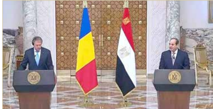
مؤتمر صحافي مشترك للرئيس المصري ونظيره الروماني

مجهودات المبعوث الأممي لحل الأزمة السورية على أساس القرارات الأممية المرتبطة، وتم أيضا التوافق على رفض المحاولات التي تقوم بها بعض الأطراف الإقليمية التي تسعى لفرض الأمر الواقع سواء عبر السيادة السورية أو إجراء تغييرات ديموغرافية قسرية هناك.