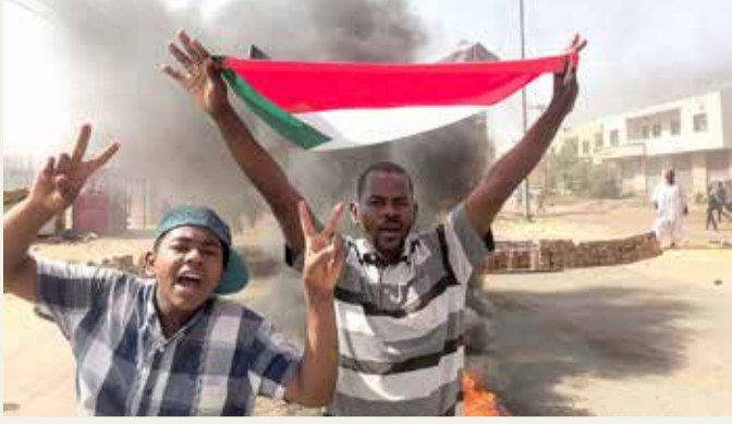
إغلاق عام في العاصمة السودانية وسط هدوء حذر