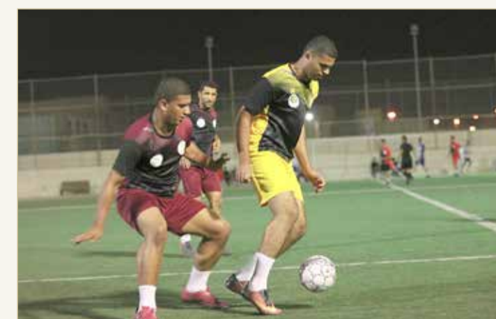
جانب من المنافسات

الرياضية في نسختها الخامسة على التوالي من تنظيم جمعية مدينة عيسى الخيرية الاجتماعية وتهدف إلى خلق جو من الألفة والمجبة بين جمعيات البحرين الخيرية.