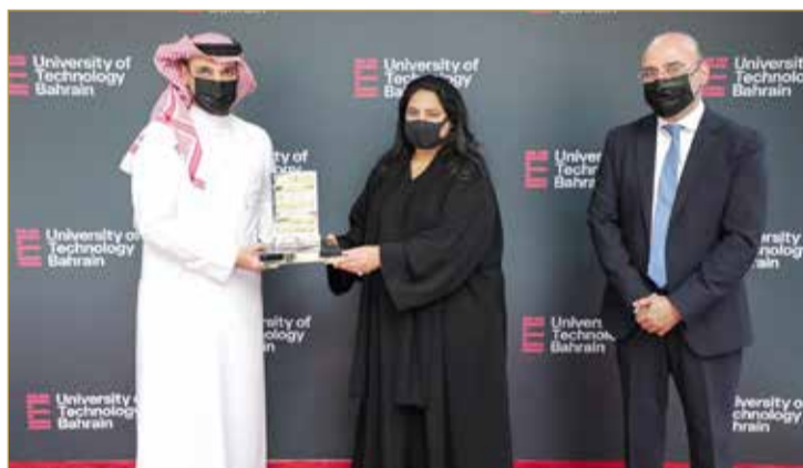
الشيخة رنا لدى زيارتها جامعة البحرين للتكنولوجيا

بالإضافة لعرض الخطط التي تم وضعها من قبل مجلس الإدارة للارتقاء بمستوى الجامعة على جميع المستويات الأكاديمية والفنية والتكنولوجية وما يتعلق منها بتطوير البنية التحتية للجامعة والخدمات المختلفة المقدمة للطلبة، مؤكداً حرص مجلس الإدارة على أن تكون جامعة البحرين للتكنولوجيا واحدة من كبرى الجامعات الإقليمية من خلال ما توفره من برامج أكاديمية متوافمة مع متطلبات ومهارات سوق العمل واحتياجاته، شاكرًا مساهمتها على هذه المبادرة والتعاون المستمر القائم بين الأمانة العامة لمجلس