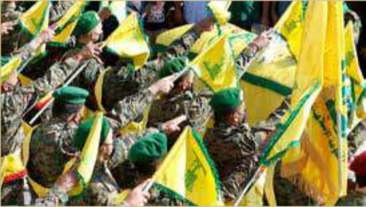
الخارجية الأميركية نددت بالتأييد على أن الحزب منظمة إرهابية