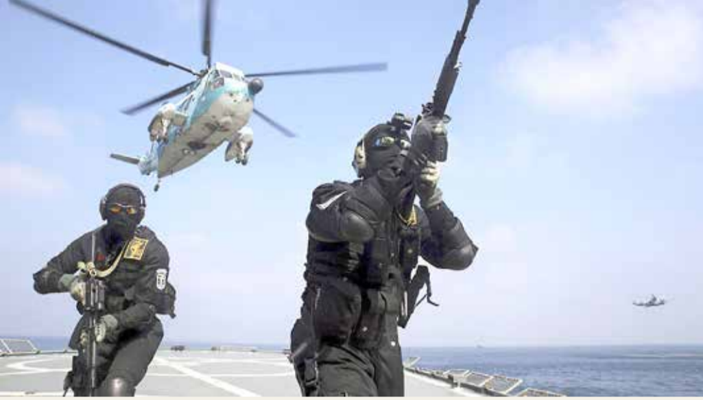
نضارب الشبّاء بشأن هوية الناقلة التي قرصنها الحرس الثوري

بدوره، أكد مسؤول أميركي لمجلة "نيوزويك" مصادرة إيران لناقلة نفط في بحر العرب الأسبوع