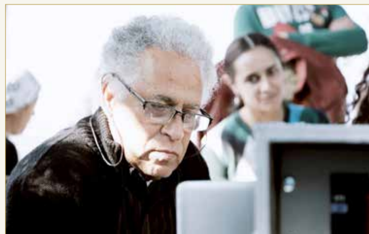
الأحياء المصرية تأخذ الأنفاس

واعتمد بالدرجة الأولى على أساس السيناريو في تصميم أي ديكور، وأعمل ذلك في مساحات شاسعة في عقلي حتى انصدم بالميزانية التي تحدد كل شيء كما تعرفون، ووقتها أبحث عن حلول لكي لا أتنازل عما يدور في عقلي لتصميمه، وأيضاً أفضل دائماً أن أكون موجوداً أثناء تصوير هذه الأعمال للإشراف حرفياً على كل شيء أمامي.