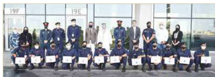
الاحتفاء بإكمال الدورة التدريبية

فريقنا للإنقاذ ومكافحة الحريق مستعد لمواجهة أية حوادث محتملة عند الحاجة. وأهني أعضاء الفريق الجدد، وأفخر بالتدريب بهم في فريقنا. ولا شك أن الفريق يظلم بدور مهم في مطار البحرين الدولي، وسنواصل الاستثمار في تطوير قدراتهم من خلال مجموعة من برامج التدريب بالتعاون مع منظمات محلية ودولية. وأثناء الدورة، تدرب المشاركون على مجموعة من المهارات