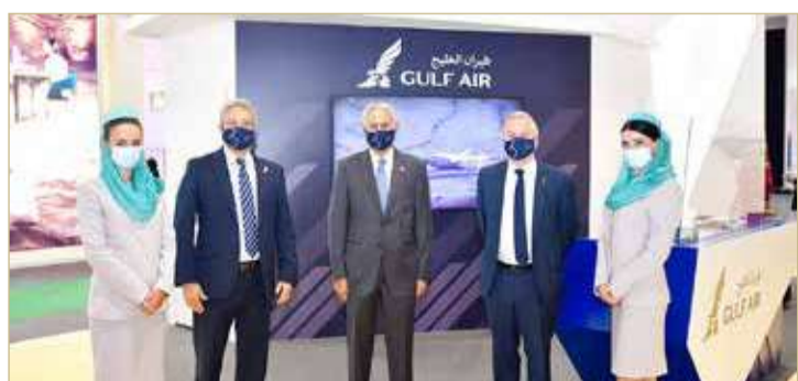
مشاركة طيران الخليج في المعرض

شاركت طيران الخليج، في معرض سوق السفر العالمي الذي يعد أكبر معرض للسياحة والسفر في العالم، والذي أقيم في الفترة من 1 إلى 3 نوفمبر 2021؛ بمشاركة هيئة البحرين للسياحة والمعارض، وعدد من ممثلي وكالات السفر والسياحة في البحرين والفنادق وشركات إدارة الوجهات السياحية. وكان وزير الصناعة والتجارة والسياحة رئيس مجلس إدارة طيران الخليج، زايد الزباني، قد حضر المعرض وصرح قائلاً "يعد سوق السفر العالمي حدثاً رئيسياً في صناعة الطيران وتحرس طيران الخليج على حضوره سنوياً، حيث إنه يوفر منصة رائعة لهيئات السياحة وشركات الطيران لعرض