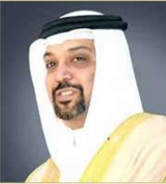
الشيخ سلمان بن خليفة آل خليفة

التركيز على "جعل الإرشاد أولوية في عالم جديد"