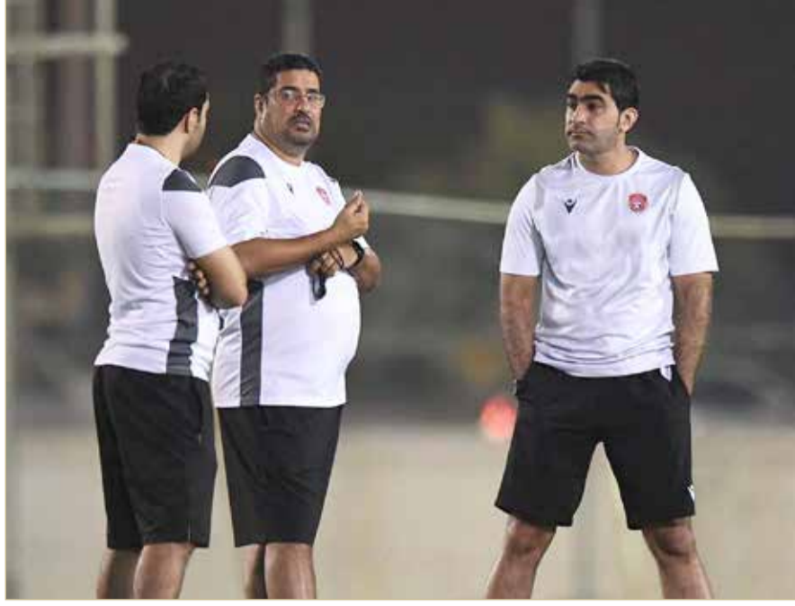
الجهاز الفني لفريق المحرق