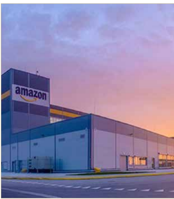
مركز تجارة إلكترونية في البحرين