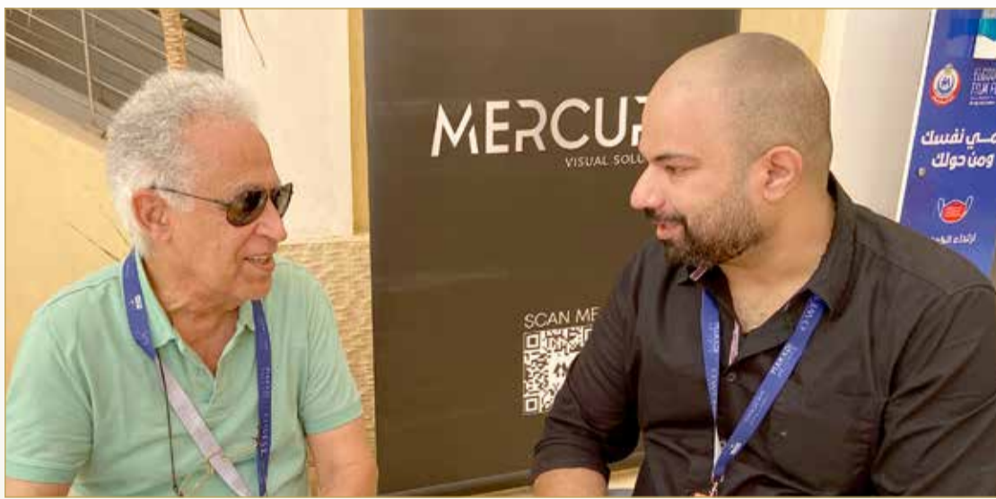
مصمم الديكور يرسم المشهد في شكله النهائي

كما يتضمن مواد أصلية من أرشيف السينما "سينماتيك"، بإجمالي 50 صورة لملاحظات وصور من أفلامه الأيقونية، تظهر مواقع وعمليات التصوير إلى جانب صور شخصية للمخرج المبدع، مع تقديم فيلم وثائقي؛ لتقديم الجوانب المهدلة من حياة المخرج الراحل وأفكاره ومجموع أفلامه، والذي أشرف شخصياً على إخراجه، حيث صورته في العام 1995، واستخدم لاستعادة حياته وأعماله، مقالات ومقاطع قصيرة من أفلام، بدلاً من الاعتماد الكلي على تحليل المتخصصين، ويظهر في الفيلم كيشلوفسكي الذي أعلن وقتها قراره باعتزال السينما منذ أكثر من 10 سنوات. الحقيقة أحببت أن أقدم فكرة "البعث" لهذا الرجل منذ ولادته، واعتبرت ذلك رحلة جميلة، والمعرض عموماً ملصقات لجميع أفلامه الكبيرة التي حفرت