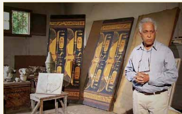
تفاصيل المكان تعكس جوانب الأشخاص