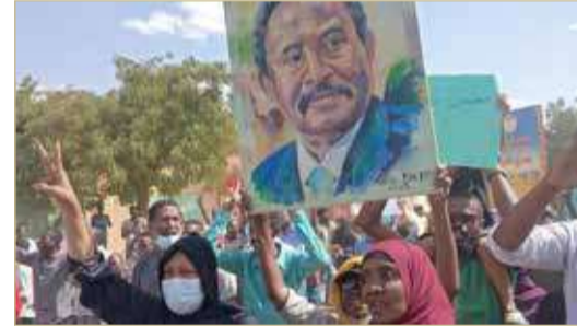
مظاهرون في الخرطوم يحملون صورة عبد الله حمدوك

وتعليقاً على خطوات القوات العسكرية، وقائد الجيش عبد الفتاح البرهان، قال: "من الجيد أن قائد الجيش لم يعين رئيس حكومة جديدة!".