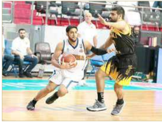
لقاء الأهلي والحالة