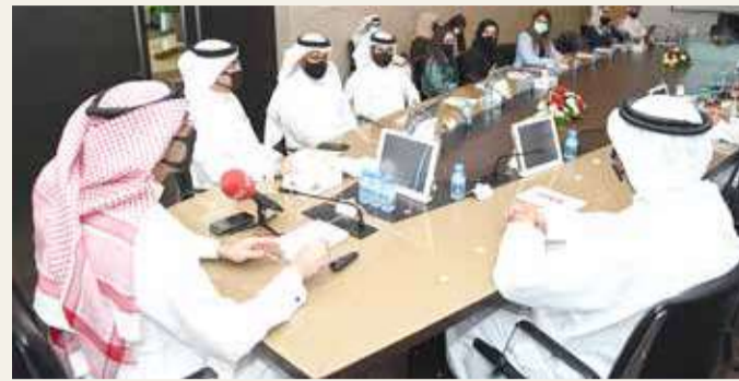
القائد متحدثاً في المؤتمر الصحفي