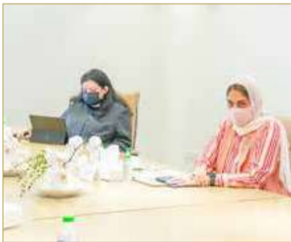
الأمين العام تستقبل وفد العلاقات مع شبه الجزيرة العربية بالبرلمان الأوروبي

تقدم المرأة البحرينية والنهوض بها وبناء قدراتها في جميع مجالات التنمية، وكيف أصبح المجلس خلال عشرين عاماً من تأسيسه مركزاً وطنياً للخبرة في شؤون المرأة البحرينية. من جانبه، أعرب الوفد الأوروبي الزائر عن تقديره بامتلاك مملكة البحرين تجربة فريدة متميزة في مجال دعم وتمكين وتقديم المرأة واستدامة حضورها في مختلف المجالات، بما في ذلك المجالات السياسية والحقوقية من خلال مؤسسة المجلس الأعلى للمرأة.