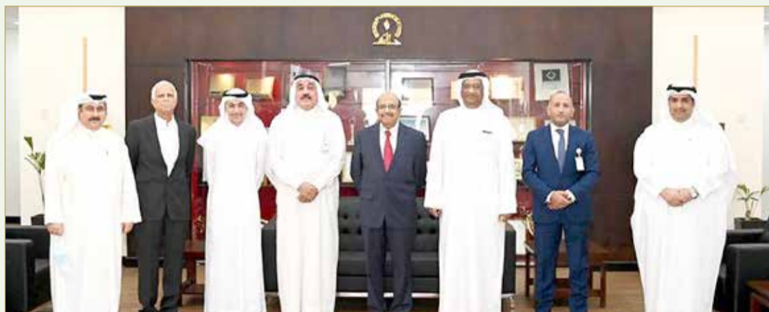
رئيس وأعضاء مجلس إدارة "تطوير" لدى زيارتهم بناغاز

2021 من مجلس السلامة البريطاني بالملكة المتحدة ضمن 32 شركة فائزة ومتفوقة على 391 شركة من كبريات الشركات العالمية المشاركة، وذلك تقديراً واعترافاً بأدائها الباهر وسجلها المتميز في مجال الصحة والسلامة والبيئة على مدى أكثر من 4 عقود من التشغيل. وكذلك حصول الشركة على عدة جوائز وشهادات من منظمات عالمية مثل الجمعية الملكية البريطانية للوقاية من الحوادث بالملكة المتحدة ومجلس السلامة الوطني بالولايات المتحدة الأميركية وجمعية مصنعي الغاز الأميركية وتحقق موظفي الشركة مؤخرًا لأكثر من 7 ملايين ساعة عمل بدون وقوع أية حادثة مضیعة للوقت، ليأتي تأكيداً على تميز الشركة في تطبيق إجراءات السلامة بكل صرامه وحرصها على الالتزام التام بقواعدها المهنية وترسيخ إجراءات العمل الآمن في جميع مرافق الشركة.