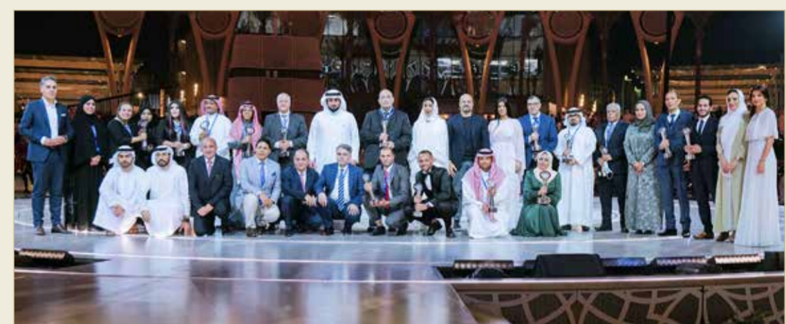
رئيس مجلس دبي للإعلام سمو الشيخ أحمد بن محمد بن راشد آل مكتوم متوسط الفائزين

بلوحة كاريكاتيرية عن الذباب الإلكتروني للفنان المحترف الزميل نواف الملا