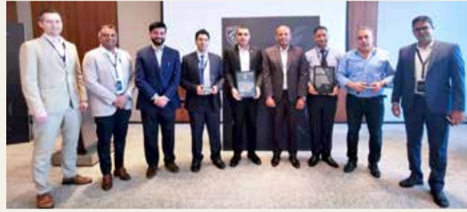
أثناء تسلم الجوائز

على هامس الجائزتين المهمتين اللتين تعتبران دليلاً على حرص موترسيتي على الحفاظ على تميز مختلف علاماتها خصوصاً فيما يتعلق بخدمة عملائها في البحرين. إن ما يزيد من أهمية هذه الجوائز هو استلامها بفترة قصيرة من حصولنا على وكالة علامة بيجو في البحرين في الربع الأخير من العام الماضي 2020. نتمن على ثقة Stellantis الشرق الأوسط بقدراتنا، وسنواصل تطوير أعمالنا لتحقيق مزيد من الإنجازات والنجاحات."