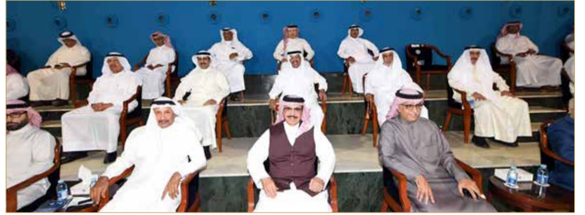
وزير الداخلية خلال حضوره ختام البطولة