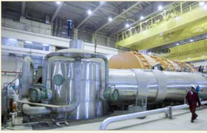
إيران تحاول تسجيل إنجازات نووية لدفع الغرب إلى تقديم تنازلات

وأضاف "غير أن ذلك قد يكون له على الأرجح أثر عكسي يوحى بأن الفريق الإيراني الجديد ليس مهتماً بتسوية المسألة النووية ويعجل بسياسة أكثر تشدداً العام المقبل".