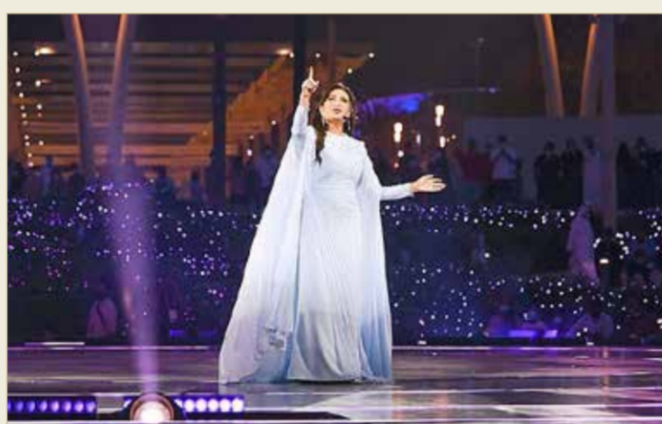
أدت الفنانة لطيفة قصيدة من أشعار محمد بن راشد