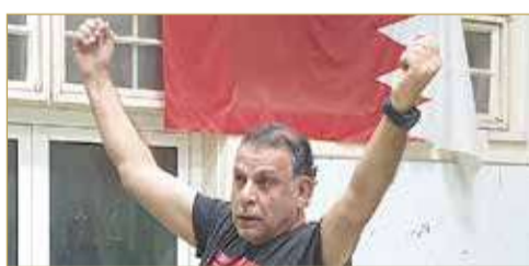
عندنا رسالة من المهم سماعها