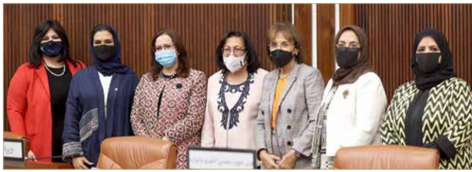
وزيرة الصحة متوسطة عضوات مجلس الشورى

البلاد رفعت وزيرة الصحة فائقة الصالح أسمى آيات الشكر والتقدير لعاهل البلاد صاحب الجلالة الملك حمد بن عيسى آل خليفة، بأسمها وباسم جميع العاملين في وزارة الصحة والمنظومة الطبية، مؤكدة أن حكمة جلالتها في إدارة دفة البلاد في أزمة جائحة "كوفيد 19"، وتوجيهاته السريعة والمدركة لخطر هذا الوباء بالاستعداد للجائحة قبل وصولها البحرين والإعلان عن أول إصابة لها، كانت الحجر الأساس في حماية مملكة البحرين من هذا الوباء، وأخذ كل الاحتياطات اللازمة من قبل كل جهات الاختصاص في المنظومة الطبية وتسخير جميع الموارد المالية من أجل هذه الاستعدادات.