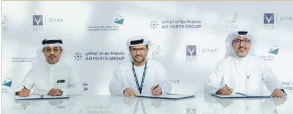
أثناء توقيع الاتفاق بين الأطراف الثلاثة

وقعت مجموعة موانئ أبوظبي، اتفاقية مبدئية مع كل من شركتي ديار المحرق و"إيجل هيلز ديار"، لاستطلاع فرص تطوير وتشغيل محطة للسفن السياحية والبنية التحتية المتعلقة بها في مملكة البحرين، وذلك في إطار حرص المجموعة والتزامها المستمر بدعم أعمال هذا القطاع وتطويره على امتداد منطقة دول مجلس التعاون الخليجي.