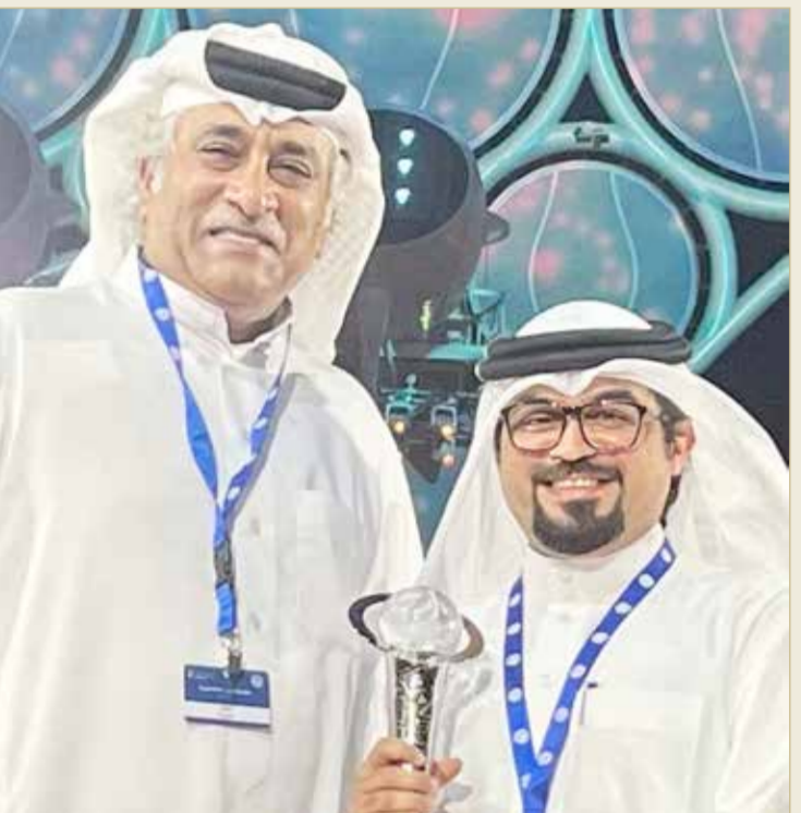
الملا مع رئيس التحرير ساحة الوصل

أهدى إنجازاه لجلالة الملك وسمو ولي العهد رئيس الوزراء الزميل الملا: ”البلاد“ بيت للإبداع