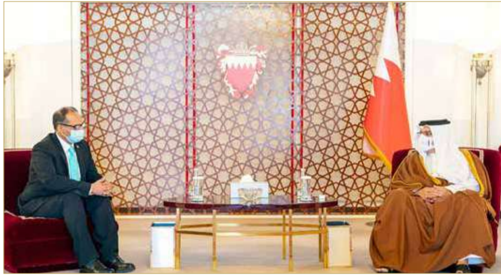
سمو ولي العهد رئيس مجلس الوزراء يستقبل سفير جمهورية باكستان الإسلامية لدى مملكة البحرين

المنامة - بنا أكد ولي العهد رئيس مجلس الوزراء صاحب السمو الملكي الأمير سلمان بن حمد آل خليفة أن العلاقات التي تجمع مملكة البحرين وجمهورية باكستان الإسلامية الشقيقة مستمرة في النمو على كافة الصعد، مشيرًا إلى أهمية مواصلة تعزيز التنسيق الثنائي بما ينعكس على مسار تقدم العلاقات المشتركة نحو مزيد من النماء والازدهار للبلدين والشعبين الشقيقين. جاء ذلك، لدى لقاء سموه في قصر الرفاع أمس، سفير جمهورية باكستان الإسلامية لدى مملكة البحرين محمد أيوب، بمناسبة تعيينه سفيراً لبلادها لدى المملكة، متوفاً سموه بالشراكة الاستراتيجية التي تربط البلدين والشعبين الشقيقين وسبل تطويرها في المجالات كافة. (03)