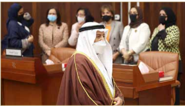
رئيس المجلس منجها للمنصة

البحرينية في المجالات كافة ضمن مسيرة العمل الوطني، عبر تهيئتها وتعزيز قدراتها من خلال البرامج والخطط التي تضمنتها الاستراتيجية الوطنية لنهوض المرأة البحرينية، إذ أصبحت نموذجاً مشرفاً على المستوى المحلي والإقليمي والدولي، مؤكداً دعم المجلس للمرأة البحرينية بالمراجعة المستمرة للمنظومة التشريعية لتعزيز مكانتها.