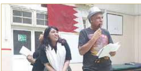
جانب آخر من البروفات