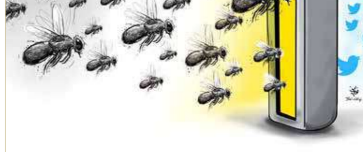
لوحة الذباب الإلكتروني الفائزة بالجائزة