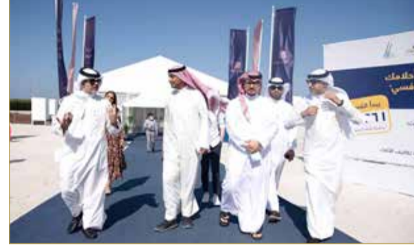
جانب من الجولة الإعلامية في مشروع "ديرة العيون" أمس

الإلكترونية والكهربائية، بالإضافة إلى الحصول على أرباح نقدية تقدر بمبلغ 1,500 دينار، مع خدمة إنترنت "5G" مجانية لمدة 6 أشهر. ويتواجد فريق المبيعات التابع لبنك الإسكان في فيلا العرض لخدمة العملاء الكرام، إلى جانب وجود عدد من ممثلي البنوك لاستقبال الزوار طوال أيام الأسبوع ولغاية شهرين متتاليين، مع بدء ساعات العمل من 8:00 صباحاً حتى 6:00 مساءً، حيث سيتمكن الراغبون بشراء الفلل من زيارة مكتب المبيعات الكائن بالقرب من فيلا العرض، وسيتاح لهم تسديد رسوم الحجز إلكترونياً عبر منصة "بنفت بي" بدلاً من استخدام النقود الورقية.