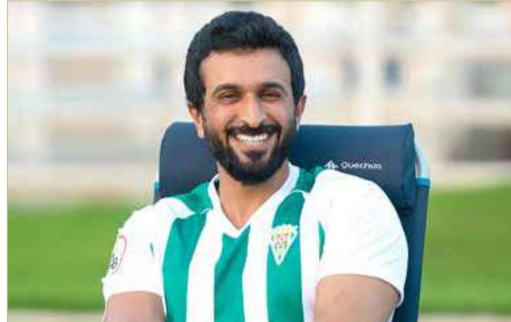
سمو الشيخ ناصر بن حمد