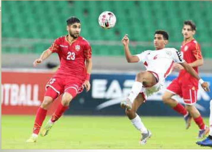
منتخبنا يخسر أمام اليمن (1-0) ويودع بطولة غرب آسيا للشباب