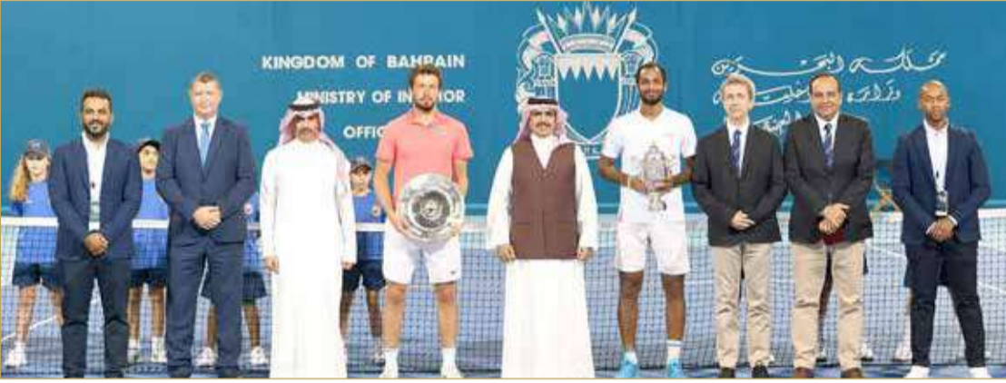
وزير الداخلية خلال التتويج

دون شك، ستتحذ اليوم جميع جماهير الأندية البحرينية خلف منتخبنا الوطني لكرة السلة حينما يواجه نظيره الإيراني بصالة مدينة خليفة الرياضية. "الأحمر" يحتاج الدعم والمساندة على أرضه وبين جمهوره حتى يحقق الهدف المطلوب من هذه المواجهة، وجمهورنا البحريني لا يحتاج لدعوة في مثل هذه المواقف المهمة.