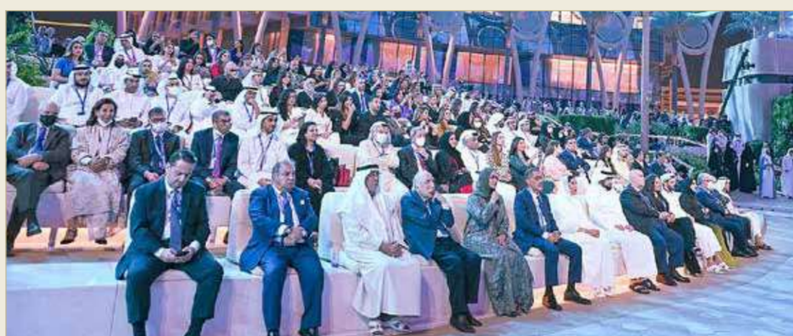
رئيس مجلس دبي للإعلام سمو الشيخ أحمد بن محمد بن راشد آل مكتوم متوسط الفائزين