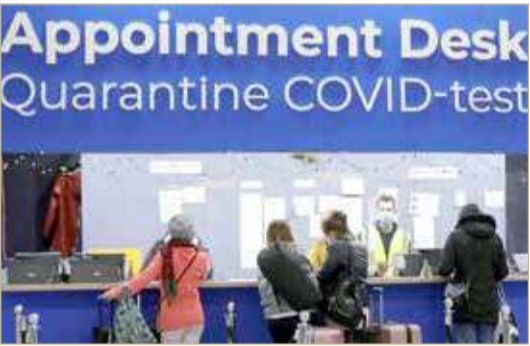
هولندا تعلن عن 13 إصابة بالمتحور الجديد

من تفشي الفيروس، في قرار يأتي بعد أربعة أسابيع فقط من إعادة فتح حدودها أمام السياح في أعقاب إغلاق طويل جزاءً كوفيد. وبدأ المتحور الجديد ينتشر ورصد في مختلف دول العالم، من هولندا مروراً بهونغ كونغ وأستراليا، حيث أعلنت السلطات أمس الأحد اكتشافه لأول مرة لدى مسافرين قادمين من جنوب القارة الإفريقية خضعوا لفحص كوفيد بعد وصولهما إلى سيدني.