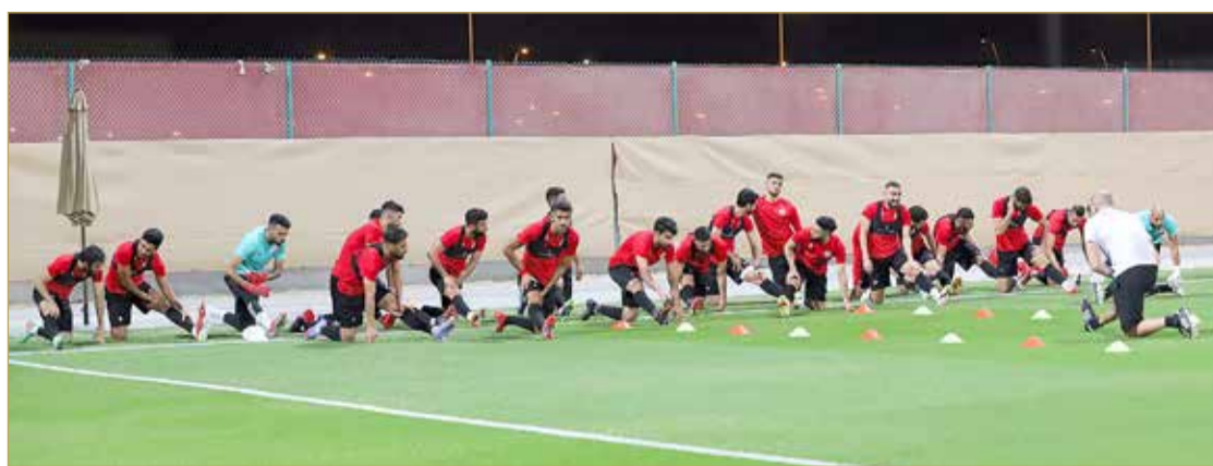
من تدريبات منتخبنا الوطني

كما ستعقد اليوم 3 مؤتمرات صحافية لبقية مباريات اليوم الافتتاحي على فترات مختلفة بالمركز الإعلامي الرئيسي، حيث سيلتقي الإمارات مع سوريا، والعراق مع عمان، وتونس مع موريتانيا.