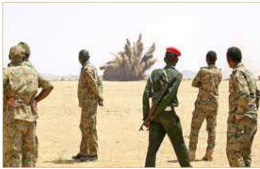
الاشتباكات تزيد من التعقيدات على الحدود السودانية الاثيوبية

جاء هجوم نفذته السبت مجموعات من الجيش والمليشيات الإثيوبية. والسبت قال الجيش السوداني إن قواته بمنطقة الفشقة تعرضت لاعتداء وهجوم من وحدات تابعة للجيش الإثيوبي وفصائل مسلحة. وقال موقع سودان تريبون الإخباري الخاص إن "الجيش السوداني تصدى فجر السبت، لهجوم داخل الحدود الشرقية". وذكر الموقع نقلاً عن مصادر عسكرية أن الجيش السوداني "رد على توغل القوات الإثيوبية ومليشيات الأمهرا داخل الأراضي السودانية".