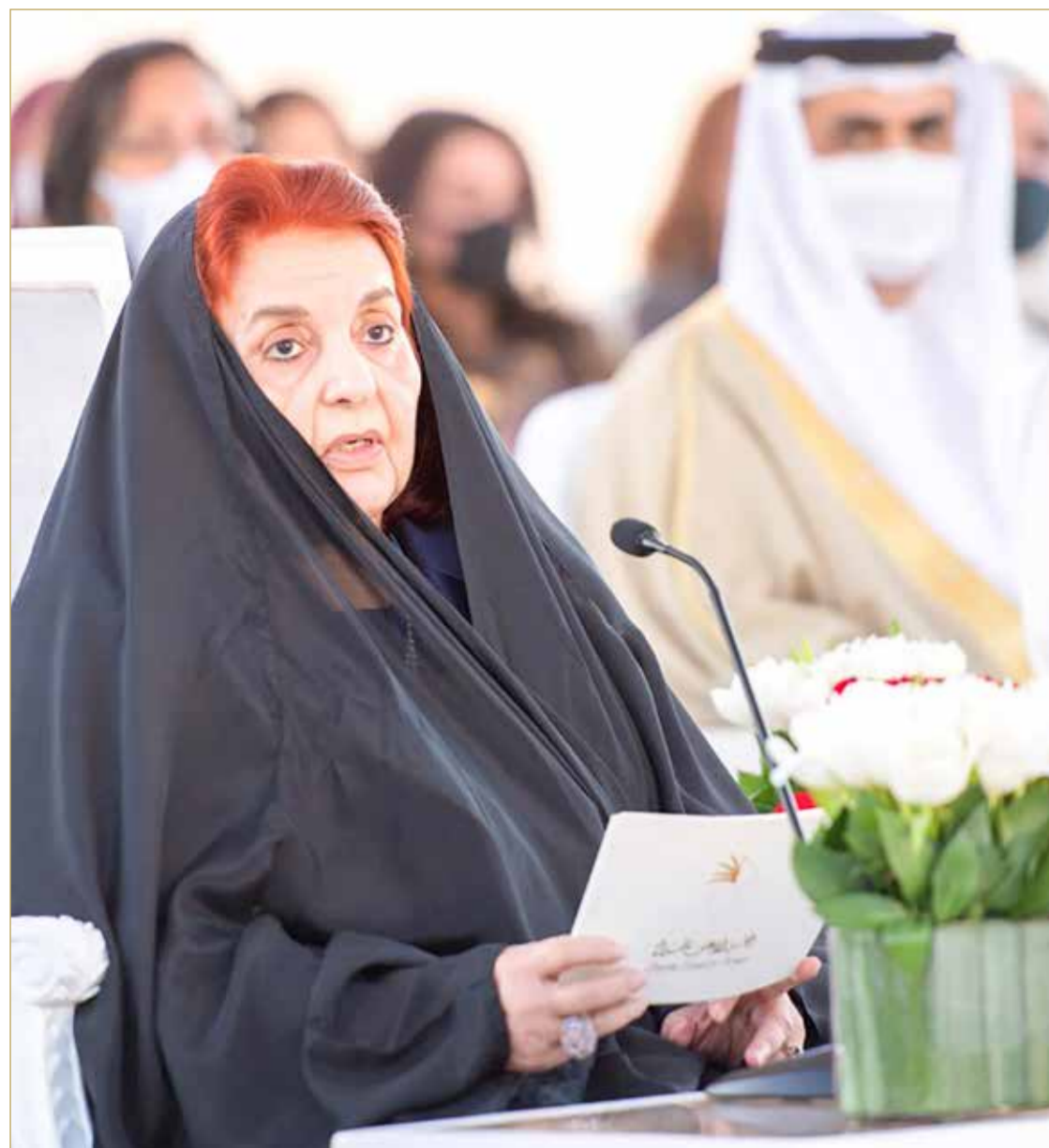
الكلمة السامية لقرينة عاهل البلاد المقدي