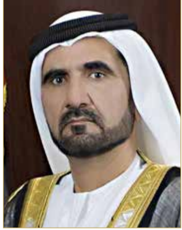
سمو الشيخ محمد بن راشد آل مكتوم