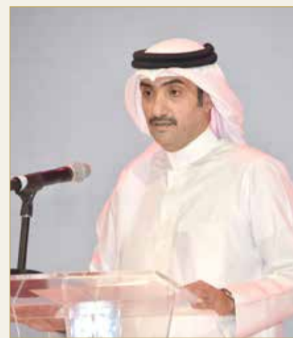
الشيخ عبدالله بن خليفة يلقي كلمته

وتوجيهات الحكومة المؤقتة بقيادة صاحب السمو الملكي الأمير سلمان بن حمد آل خليفة، ولي العهد ورئيس مجلس الوزراء. وعليه، فإن الآن هو الوقت الأفضل لإطلاق هويتنا الجديدة "BEYON Money" في البحرين، ونتطلع لتعزيز نطاق خدماتنا لتصل إلى دول مجلس التعاون الخليجي في الوقت المناسب. واختتم الشيخ عبدالله حديشه بالقول "ستؤدي هوية "BEYON Money" دورًا حيويًا في دعم