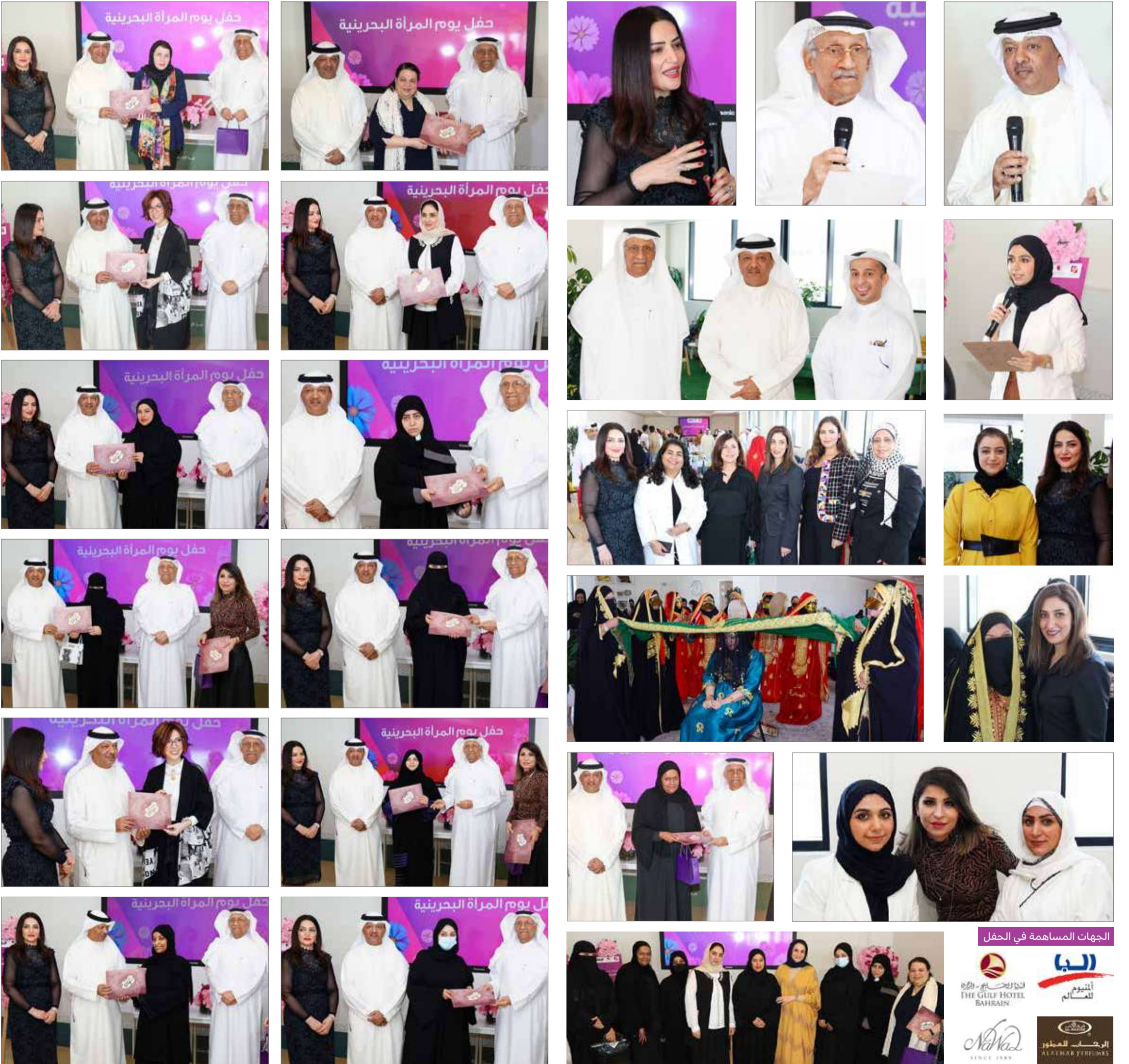
الجهات المساهمة في الحفل