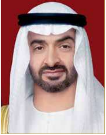
سمو الشيخ محمد بن زايد آل نهيان

العربية المتحدة صاحب السمو الشيخ محمد بن زايد آل نهيان، أعربا فيهما عن خالص تهانيهما وتمنيا لهما لسموهما بهذه المناسبة الوطنية.