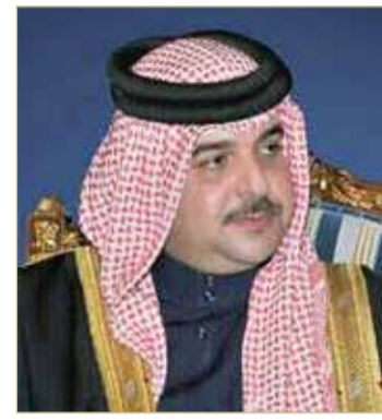
سمو الشيخ عبدالله بن حمد

رفع الممثل الشخصي لجلالة الملك رئيس المجلس الأعلى للبيئة سمو الشيخ عبدالله بن حمد آل خليفة أسماً آيات التهاني والتبريكات إلى مقام عاهل البلاد صاحب الجلالة الملك حمد بن عيسى آل خليفة، وإلى ولي العهد رئيس مجلس الوزراء صاحب السمو الملكي الأمير سلمان بن حمد آل خليفة، وإلى قرينة عاهل البلاد رئيسة المجلس الأعلى للمرأة صاحبة السمو الملكي الأميرة سبيكة بنت إبراهيم آل خليفة بمناسبة الاحتفال بيوم المرأة البحرينية والذي يأتي تحت عنوان “المرأة البحرينية في التنمية الوطنية .. مسيرة ارتقاء في وطن معطاء“.