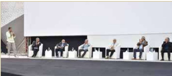
ندوة الكيت كات

الاسم، إلى جانب أننا كجيل عشنا تغييرات كبيرة سياسية واجتماعية تعرضنا لثورات وأزمات سياسية، أعتقد أنها أصعب الصعوبات التي عدت علينا كجيل". وأكد الفنان كريم عبدالعزيز أنه استفاد من المخرجين الذين عمل معهم، وفي مقدمتهم المخرج الكبير شريف عرفة، وكذلك ساندرا نشأت ومروان حامد. وفي سؤال عن قيامه بعملية تجميل قريبا، فقال: "عندما أصل إلى سن ما بعد الأربعين بالطبع سأفكر بذلك، أفكر؛ لأنني شخصا لا أؤمن بها للوصول للجمال، فهناك معايير أخرى نقيس بها الرجولة، لا يقلقني