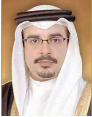
سمو ولي العهد رئيس مجلس الوزراء