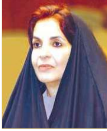
سمو الأميرة سبيكة بنت إبراهيم

كما نوه سموه بالرعاية الملكية السامية التي تحظى بها المرأة البحرينية في العهد الزاهر لعاهل البلاد صاحب الجلالة الملك حمد بن عيسى آل خليفة، والحكومة برئاسة ولي العهد رئيس مجلس الوزراء صاحب السمو الملكي الأمير سلمان بن حمد آل خليفة.