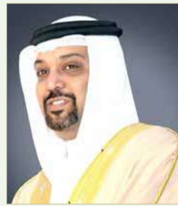
وزير المالية والاقتصاد الوطني

تأكيد التصنيف الائتماني السيادي الطويل والقصير الأجل عند "B+/B"