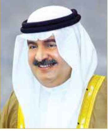
سمو الشيخ علي بن خليفة