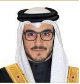
سمو الشيخ عيسى بن سلمان

أكد رئيس الهيئة العليا لنادي راشد للفروسية وسباق الخيل سمو الشيخ عيسى بن سلمان بن حمد آل خليفة ما حقته المرأة البحرينية من إنجازات نوعية في مختلف مسارات العمل الوطني، مما عزز من إسهامها الفاعل في المسيرة التنموية الشاملة بقيادة عاهل البلاد صاحب الجلالة الملك حمد بن عيسى آل خليفة، مشيداً سموه باهتمام الحكومة برئاسة ولي العهد رئيس مجلس الوزراء صاحب السمو الملكي الأمير سلمان بن حمد آل خليفة بتبني المبادرات التي تعزز تقدم المرأة في شتى المجالات. ورفع سموه أسماً آيات الهاديين. ورفع سموه أسماً آيات الهاديين. ورفع سموه أسماً آيات الهاديين. ورفع سموه أسماً آيات الهاديين.