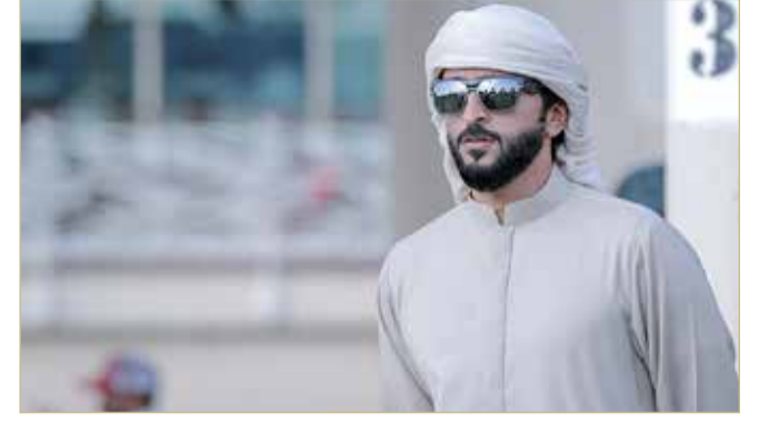
سمو الشيخ ناصر بن حمد