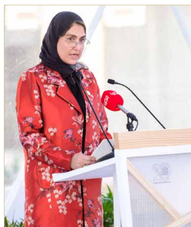
جانب من حضور الاحتفال

سموها تدشن "أثر" ليكون معلماً وطنياً يحتفي بإنجازات المرأة البحرينية