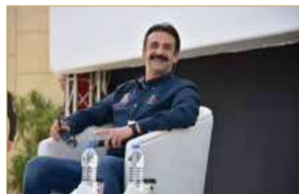
الفنان كريم عبدالعزيز