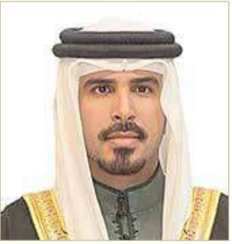
سمو الشيخ محمد بن سلمان

أكد سمو الشيخ محمد بن سلمان بن حمد آل خليفة أن المرأة البحرينية أثبتت تقدمها على المستويات كافة بفضل ما تحظى به من دعم واهتمام مستمر مكنتها من تبوؤ مكانة متقدمة في كافة المجالات بما يسهم في تحقيق أهداف المسيرة التنموية الشاملة بقيادة عاهل البلاد صاحب الجلالة الملك حمد بن عيسى آل خليفة. وأشار سموه إلى أن المرأة اليوم تواصل تحقيق النجاحات وترفع اسم وطنها في كافة المحافل بفضل ما توليه الحكومة من اهتمام برئاسة ولي العهد رئيس مجلس الوزراء صاحب السمو الملكي الأمير سلمان بن حمد آل خليفة حفظه الله من حرص على تحقيق التقدم المنشود للمرأة البحرينية على كل صعيد. ورفع سموه خالص التهاني والتبريكات إلى قرينة العاهل