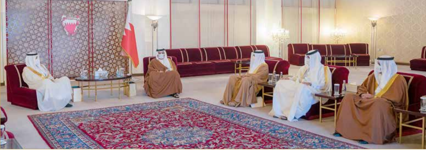
سمو ولي العهد رئيس مجلس الوزراء يستقبل وكيل وزارة الداخلية لشؤون الجنسية والجوازات والإقامة