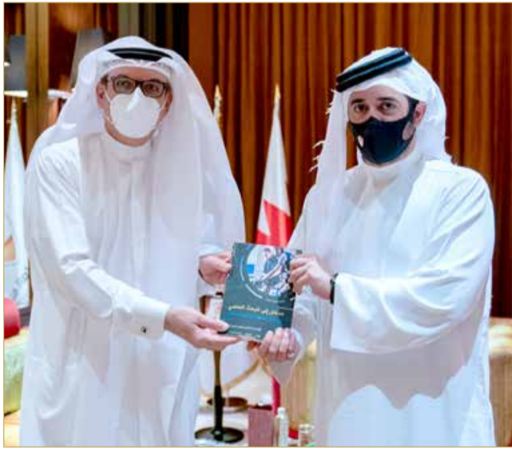
سموه يتسلم نسخة من الكتاب