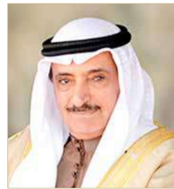
الشيخ سلمان بن عبدالله

أحد رئيس جهاز المساحة والتسجيل العقاري رئيس مجلس إدارة مؤسسة التنظيم العقاري الشيخ سلمان بن عبدالله بن حمد آل خليفة أن يوم المرأة البحرينية الذي يصادف الأول من شهر ديسمبر من كل عام يعتبر مناسبة وطنية مضيئة نستذكر من خلالها ما حقته المرأة البحرينية من إنجازات وما أسهمت وشاركت به في مسيرة الوطن وبناء الدولة الحديثة.