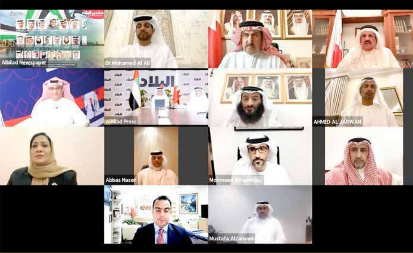
صورة جماعية لعدد من المشاركين بمنتدى "البلاد"