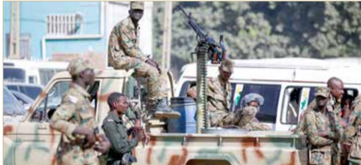
قوات أمنية في الخرطوم

وقال في مقابلة عبر الفيديو مع صحيفة بوليتيكو، أمس الأربعاء: "أوروبا والولايات المتحدة قد تواجهان زيادة في عدد اللاجئين، إذ لا تدعم السلطة والنظام في البلاد في ظل الحكومة الجديدة التي ستشكل". كما اعتبر أن الغرب ليس لدي خيار سوى دعم الحكومة لتجنب أزمة اللاجئين.