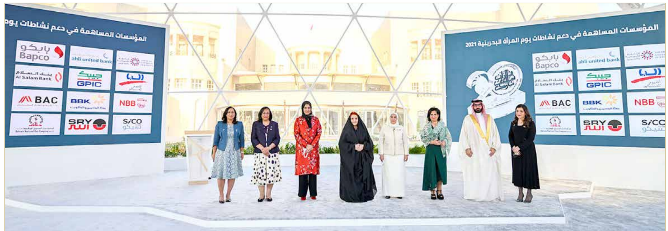
صورة جماعية مع الجهات التي تصدرت التقرير الثاني للتوازن بين الجنسين

العاهل ينيب سمو الأميرة سبيكة بنت إبراهيم لحضور الاحتفال بيوم المرأة البحرينية