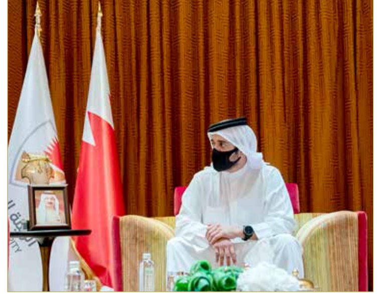
سمو الشيخ خالد بن حمد