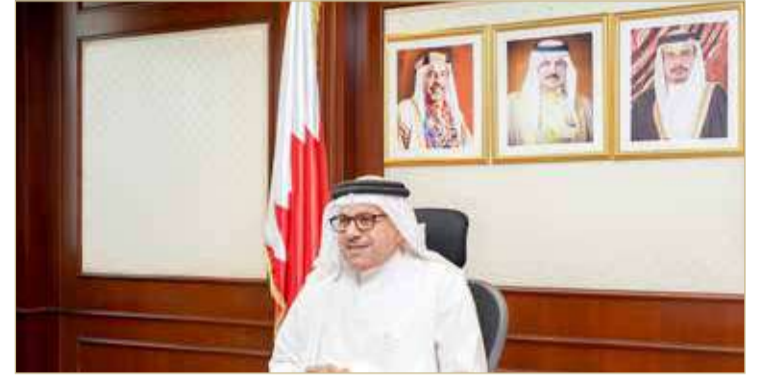
المنامة - وزارة الخارجية

هنأ وزير الخارجية عبداللطيف الزياني، كافة منسبات وزارة الخارجية، وذلك بمناسبة يوم المرأة البحرينية الذي يصادف الأول من ديسمبر، مشيرًا إلى عطاء المرأة البحرينية المتواصل من خلال مشاركتها في مسيرة النهضة والتنمية في مملكة البحرين وفي مختلف الميادين والمجالات.