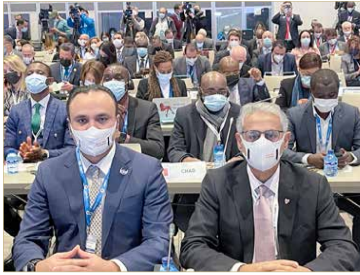
الزياني مشاركاً في اجتماعات منظمة السياحة العالمية

كما تم عرض مبادرة الشباب وتنمية المواهب التابعة لمنظمة السياحة العالمية حيث يتنافس مجموعة من الطلبة من جميع أنحاء العالم لتزويد قطاع السياحة بأفكارهم الرامية إلى معالجة تحديات القطاع في مواضيع ترتبط بأهداف التنمية المستدامة للأمم المتحدة. وتقام على هامش اجتماعات الجمعية العمومية لمنظمة السياحة العالمية اجتماعات ثنائية مع ممثلين رفيعي المستوى من القطاع العام لمناقشة قضايا التعاون بين القطاعين العام والخاص، والاطلاع على النشاط العام لمنظمة السياحة العالمية. ومن المقرر أن يصوت مندوبو الدول المشاركون في الاجتماعات على إعادة تعيين زوراب بولوليكاشفيلي أميناً عاماً لمنظمة السياحة العالمية للفترة 2022-2025، ويستمعون إلى تقريره عن الاتجاهات الراهنة للسياحة الدولية.