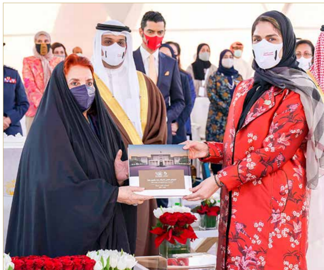
قرينة العاهل تتسلم كتاب المجلس الأعلى للمرأة بعد عشرين عاماً من أمين عام المجلس