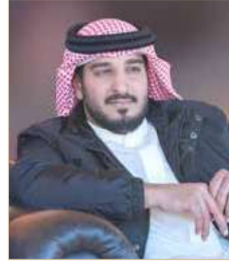
سمو الشيخ عيسى بن عبدالله