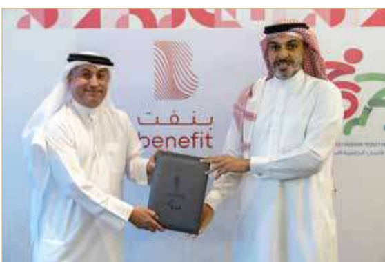
عقب توقيع الشراكة بين الجانبين