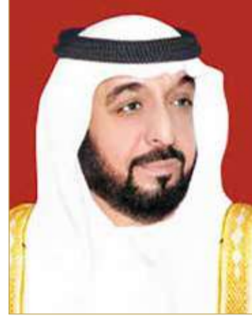
سمو الشيخ خليفة بن زايد آل نهيان