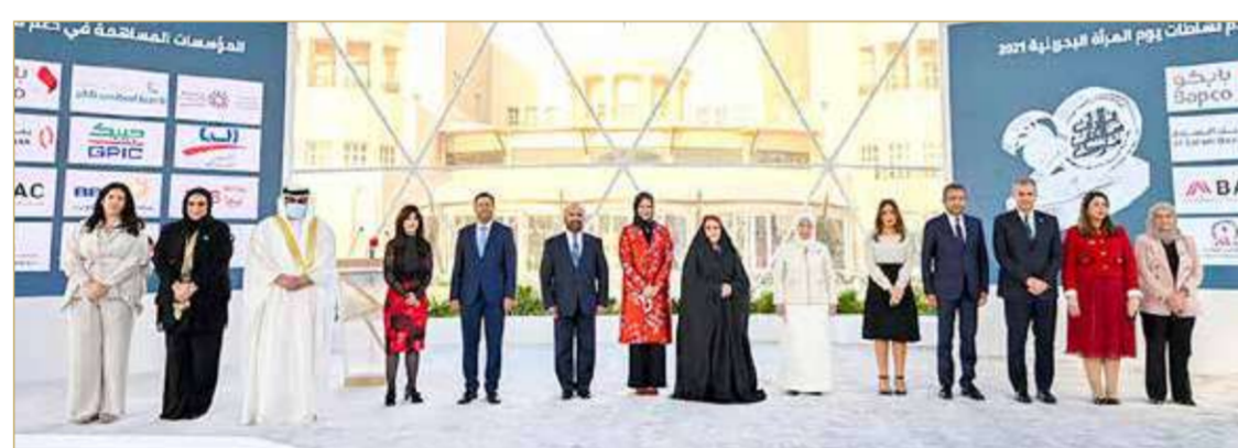
صورة مع الجهات المساهمة في يوم المرأة البحرينية

سموها تدشن "أثر" ليكون معلماً وطنياً يحتفي بإنجازات المرأة البحرينية