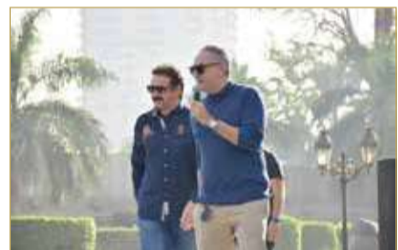
المخرج داود عبد السيد

وتم اختيار اسم كيت كات على اسم حي شعبي بسيط يعيش فيه الشيخ حسني الكفيف مع أمه المسنة، وابنه الشاب الذي يتطلع للخروج منه بعد صعوبة الحصول على وظيفة بعد تخرجه من الجامعة، ويدخل في علاقة مع جارتة الفنانة عايدة رياض التي تعشق هذا الشاب بجنون. وقال داود عبد السيد أن شخصية الشيخ حسني