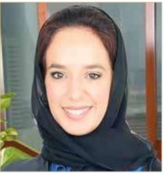
سمو الشبيخة حصة بنت خليفة

رفعت عضو المجلس الأعلى للمرأة سمو الشبيخة حصة بنت خليفة بن حمد آل خليفة خالص التهاني والتبريكات إلى قرينة العاهل رئيسة المجلس الأعلى للمرأة صاحبة السمو الملكي الأميرة سبيكة بنت إبراهيم آل خليفة، بمناسبة يوم المرأة البحرينية الذي جرى تخصيصه هذا العام للمرأة البحرينية في التنمية الوطنية.