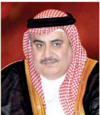
الشيخ خالد بن أحمد

محمد آل خليفة عن عميق شكره وامتنانه لمبادرات صاحبة السمو الملكي الأميرة سبيكة بنت إبراهيم آل خليفة الرائدة ودعم سموها المتواصل للمرأة ولما يقوم به المجلس الأعلى للمرأة من جهود حيثية وما يحرص عليه من توفير مختلف سبل الرعاية بالمرأة لتواصل دورها البارز كشريك مهم ورئيس في دفع المسار التنموي لآفاق رحبة على المستويات كافة.