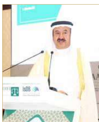
الشيخ إبراهيم بن خليفة متحدثاً في المؤتمر

واستعرض الشيخ إبراهيم بعض الإحصاءات، فعلى صعيد التجزئة بلغ متوسط حصة التكنولوجيا المالية (فنتك) من عائدات الخدمات المصرفية العالمية على م مختلف المنتجات