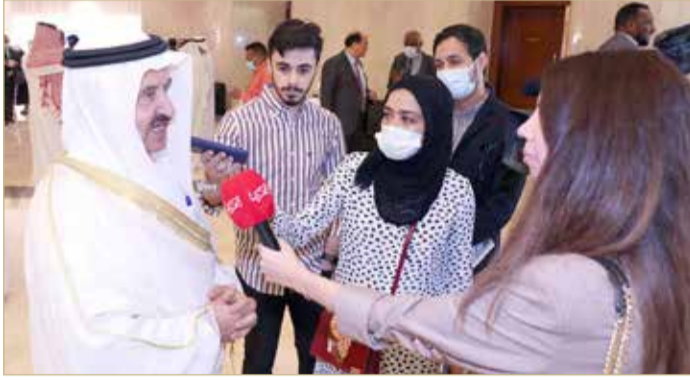
الشيخ إبراهيم بن خليفة متحدثاً للصحافيين