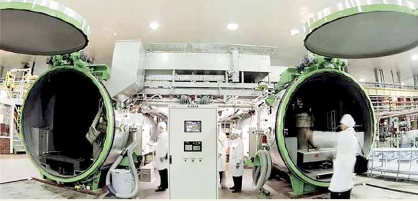
تخصيب اليورانيوم بنسبة 20٪ في منشأة فوردو