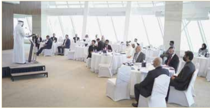
جانب من اللقاء البحريني الروسي

روسية تهدف إلى زيادة التعاون التجاري بينهم، وتعزيز العلاقات الثنائية والتعاون الاقتصادي المشترك. وأعرب السادة عن استعداد الغرفة لمزيد من التنسيق المشترك مع كافة الجهات الروسية المعنية، للترويج للتغيرات الإيجابية التي يشهدها مناخ الاستثمار في روسيا، بما يتناسب مع مجتمع الأعمال البحريني من حيث تنوع الفرص الاستثمارية المتاحة، مبيئاً أن بيئة الاستثمار في مملكة البحرين خصبة ولديها الكثير من المقومات الجاذبة والمشجعة على الاستثمار في الكثير من القطاعات التجارية والاستثمارية والصناعية. ولفت إلى أن القطاع الخاص البحريني يعمل على تعزيز العلاقات التجارية والاستثمارية وتعزيزها مع روسيا، مؤكداً على سعي الغرفة لفتح آفاق جديدة للاقتصاد من خلال التعاون، وتشجيع مجتمع الأعمال.