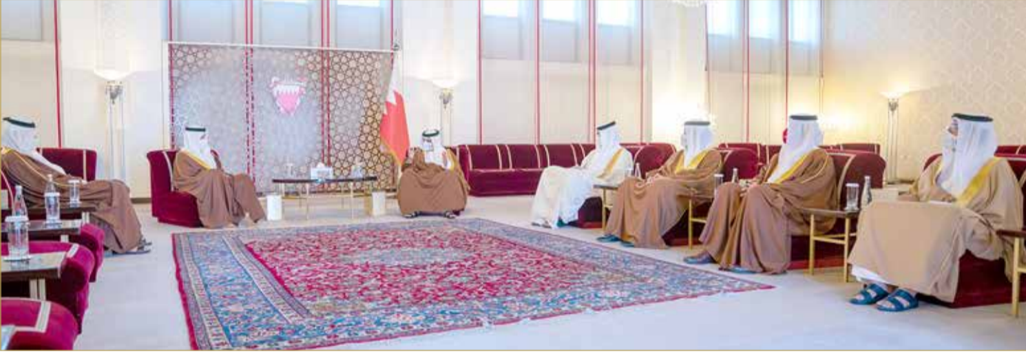
سمو ولي العهد رئيس مجلس الوزراء يستقبل وكيل وزارة المواصلات والاتصالات لشؤون الموانئ والملاحة البحرية