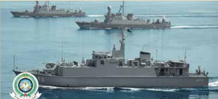
قطع عسكرية من أسطول البحرية السعودية

أعلن التحالف عن اعتراض وتدمير طائرة مسيرة في أجواء محافظة عمران بعد إقلاعها من مطار صنعاء الدولي. وأكد أنه تم تجميع وتفخيخ الطائرة المسيرة بكتيبة الدفاع الجوي في مطار صنعاء. وكشف أن الحوثيين حاولوا نقل أسلحة نوعية من الكتيبة بعد إنذار التحالف.