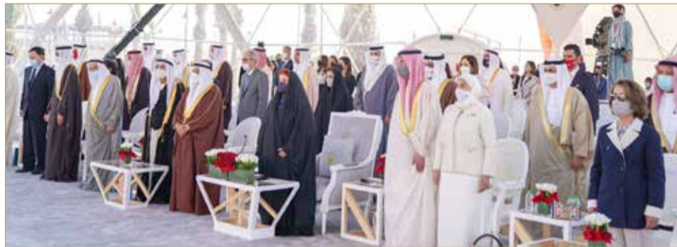
قرينة جلالة الملك في الاحتفال بيوم المرأة البحرينية

جديدة تأخذ بخلاصة التجربة لرسم توجهات المستقبل، حيث تستمر المرأة في الحفاظ على مكانتها كشريك جدير في نهوض المجتمع، وحفظ استقراره، والارتقاء بشؤونه ضمن مسيرة تنطلق إلى الأمام بكل عزم وثقة وثبات تحت راية هذا الوطن المعطاء. (08) و(09)