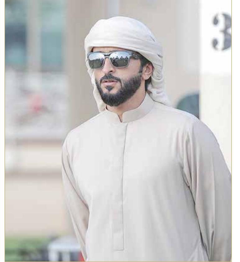
سمو الشيخ ناصر بن حمد

وأوضح سمو الشيخ ناصر بن حمد آل خليفة أن فوز "صمت"