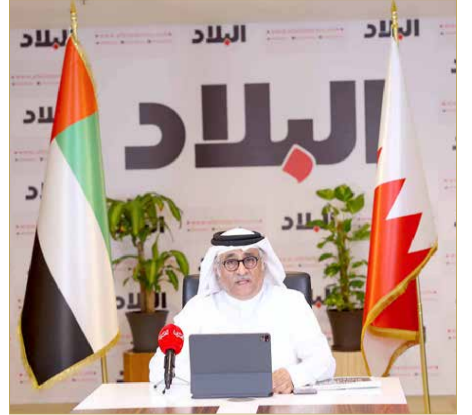
رئيس التحرير يلقي كلمته بافتتاح المنتدى

حمد بن عيسى آل خليفة ملك البلاد المفدى، مقاليد الحكم في مارس 1999، حيث تجرّي زيارات رفيعة المستوى بين المسؤولين بكلا البلدين. وأشار إلى أن أحدث تلك الزيارات كانت زيارة حضرة صاحب الجلالة الملك المفدى للقيادة الإماراتية، والتي تلتها زيارة ولي العهد رئيس مجلس الوزراء صاحب السمو الملكي الأمير سلمان بن حمد آل خليفة، حيث توجت بتوقيع 16 مذكرة تفاهم بين البلدين الشقيقين.