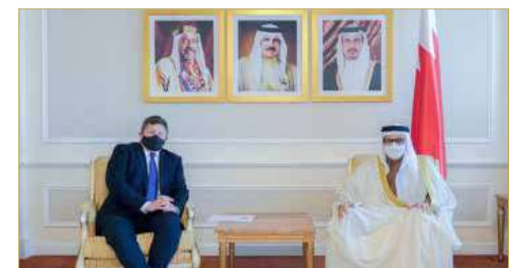
المنامة - وزارة الخارجية

استقبل وزير الخارجية عبداللطيف الزباني، في مكتبه بمقر وزارة الخارجية، أمس، سفير المملكة المتحدة لدى مملكة البحرين رودي دراوند. وتم خلال اللقاء بحث علاقات الصداقة التاريخية الوثيقة القائمة بين مملكة البحرين والمملكة المتحدة الصديقة في مختلف المجالات، وسبل تنمية وتطوير التعاون المشترك بما يخدم المصالح المشتركة للبلدين والشعبين الصديقين. كما تم استعراض النتائج الإيجابية التي أسفرت عنها المباحثات الرسمية التي عقدت في لندن بين وزير الخارجية، ووزيرة الخارجية والتنمية بالمملكة المتحدة ليز تروس، وكذلك الاجتماع الوزاري المشترك بين وزراء الخارجية بدول مجلس التعاون لدول الخليج العربية والمملكة المتحدة.