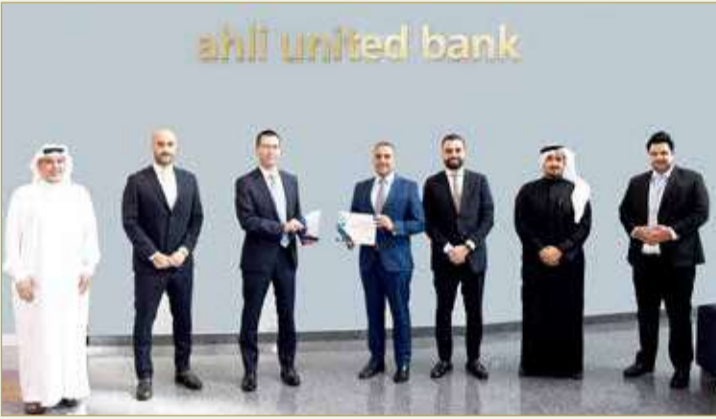
ثناء تسلم الجائزتين

فاز البنك الأهلي المتحد بجائزتين من فئة النخبة لمعاملات التحويلات الدولية بالدولار الأميركي التي تمنحها مؤسسة "جيه بي مورغان" العالمية تقديراً للعملاء الذين حققوا أفضل أداء تشغيلي رفيع في مجال المدفوعات والتحويلات الدولية خلال العام 2021، وذلك بناءً على البيانات الداخلية لمؤسسة "جيه بي مورغان". وقد كان البنك الأهلي المتحد البنك الوحيد في مملكة البحرين الذي حصل على جائزتين