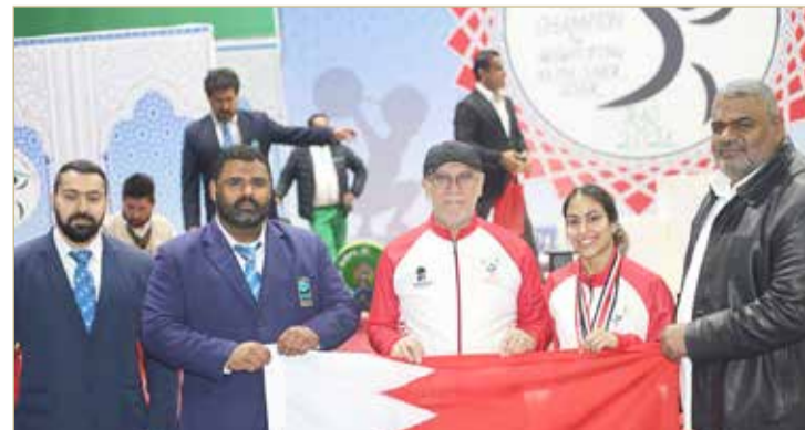
منتخب رفع الأثقال

المتابعة الفنية للفريق قائمة على قدم وساق من أجل تحقيق أفضل النتائج في هذه البطولة الخارجية الهامة وحصد أكبر عدد من الميداليات الملونة بوجود نخبة مميزة من لاعبي المنتخب الوطني.