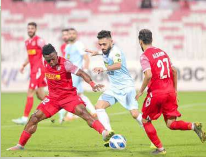
من لقاء المررق والرفاع بكأس الملك لكرة القدم