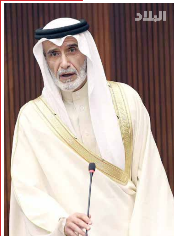
أول اطلالة برلمانية للوكيل الجديد لشئون الموانئ والملاحة البحرية بوزارة المواصلات والاتصالات الشيخ أحمد بن عيسى آل خليفة