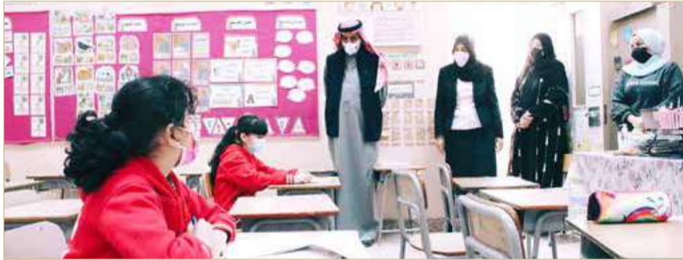
وزير التربية والتعليم يتفقد تنفيذ التطبيقات الشاملة

وزار وزير التربية والتعليم ماجد النعيمي عدداً من المدارس، اطمان خلالها على استعداداتها لتنفيذ التطبيقات، سواء من خلال المنصات الرقمية، أو عبر نظام الحضور للطلبة الراغبين في ذلك، وذلك لاستخدام الأجهزة الموجودة في مدارسهم، مع تقديم الدعم الفني اللازم لهم ليتكفوا من تنفيذ المطلوب منهم، مع الالتزام بالإجراءات الاحترازية المتبعة. كما اطلع الوزير على الإجراءات التي تتخذها المدارس في حال تعذر إرسال الطلبة للتطبيقات، حيث يتوجب على الطالب إبلاغ مدرسته حتى يتم تقديم الدعم الفني له، أو ترتيب إجراءات تقديمه لنموذج آخر من التطبيق وفق جدول