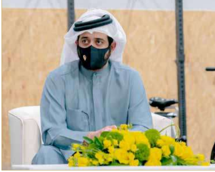
سمو الشيخ خالد بن حمد

خليفة، على الزيارة التي قام بها سموه، مؤكداً أنها تعكس تقدير سموه لجميع الجهات الرياضية، وحرص واهتمام سموه على تعزيز التواصل بهدف الدفع بالجهود نحو الارتقاء بمستوى الأندية الرياضية ومراكز التدريب، مشيداً بالجهود المتميزة التي يبذلها سموه في خدمة الرياضة البحرينية، مضيفاً أن سموه حريص على تقديم الدعم للجميع بهدف تحقيق نهضة شاملة في القطاع الرياضي لإحراز مزيد من الإنجازات، معاهدين سموه في استمرار الجهود لتحقيق مستقبل أكثر إشراقاً وازدهاراً للرياضة البحرينية.