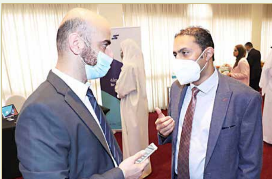
الرئيس التنفيذي لـ"صلة الخليج" متحدثاً لـ"البلاد"