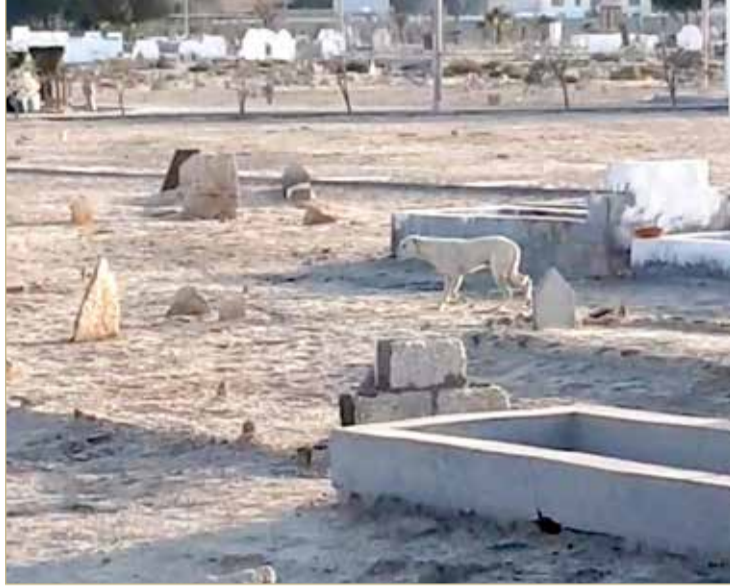
كلاب ضالة في مختلف مواقع المقبرة.. والصور بيوم الخميس 10 فبراير 2022