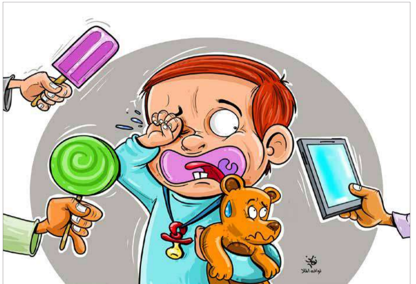
كارتيكاتير فخاف الملوك

ومع أن فرنسا توعدت بتعقب مخربي التمثال إلا أن مثل هذه الأعمال مرشحة للتكرار في ظل تغييب مراجعة موضوعية جادة لتاريخ فرنسا بخبره وشه وإصدار تشريعات ملزمة باحترام نتائجها.