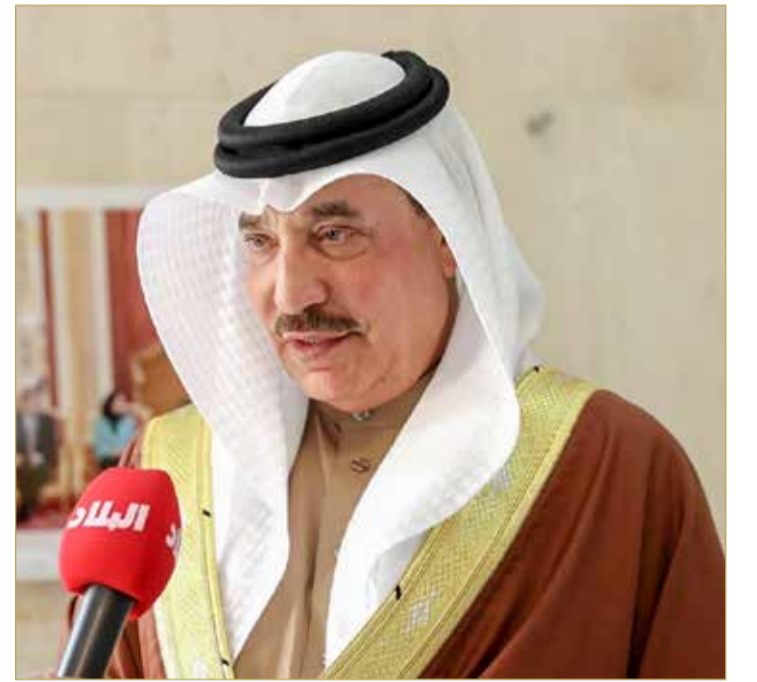
وزير العمل متحدًا لمندوبة "البلاد"