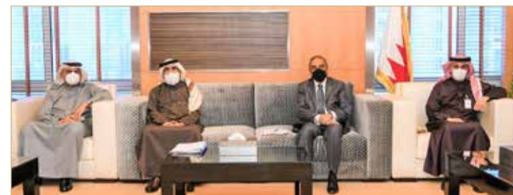
الوزير عصام خلف يجتمع مع النائب خالد بوعنق

استقبل وزير الأشغال وشؤون البلديات والتخطيط العمراني عصام خلف، ممثل الدائرة الخامسة بمحافظة المحرق النائب خالد بوعنق، لبحث احتياجات المنطقة من خدمات بنية تحتية ومتابعة مشاريعها.