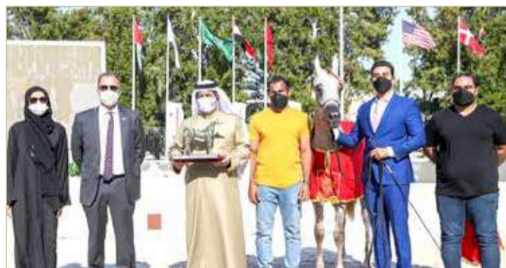
تتويج الفرس "جهندرا"