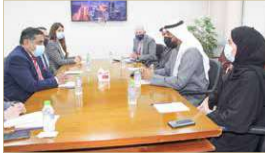
وحدة التحقيق الخاصة

التي تربط البلدين، والتي تمتد لسنوات طويلة من التنسيق المثمر والتعاون الوثيق في شتى المجالات. وفي ختام اللقاء، أشاد الممثل الخاص لرئيس وزراء المملكة المتحدة، بوحدة التحقيق الخاصة والدور الذي تضطلع به في حماية حقوق الإنسان، متمنياً حرص مملكة البحرين على تطبيق مبادئها الدستورية وسعيها إلى كفاءة حقوق الإنسان وحيرواته الأساسية، من خلال سن التشريعات اللازمة وإنشاء الآليات التي تتولى حماية وتعزيز تلك الحقوق وفقاً لأحكام الدستور والقانون.