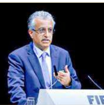
الشيخ سلمان بن إبراهيم آل خليفة

قال رئيس الاتحاد الآسيوي لكرة القدم الشيخ سلمان بن إبراهيم آل خليفة إنه نادم على ترشحه لرئاسة الاتحاد الدولي "الفيفا" في الانتخابات التي جرت العام 2016 وذلك بسبب التجريح غير المقبول الذي تعرض له. وأضاف "ندمت على القرار رغم أنه لم يكن سلبياً بالكامل... ولكنني واجهت إساءات تجاه ترشحي وصلت لحد التجريح رغم أنني ترشحت وقتها لتقديم عمل حقيقي للتطوير...". وكشف الشيخ سلمان بن إبراهيم في حديثه لصحيفة "الاتحاد" الإماراتية عن نيته للترشح لولاية جديدة لرئاسة الاتحاد الآسيوي وسط ترحيب كبير من الاتحادات الوطنية. وأوضح أن إقامة مونديال كأس العالم