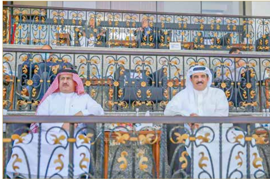
جانب من متابعة سفير المملكة لدى الإمارات

وأشاد بالمستويات الرفيعة التي شهدتها المشاركة البحرينية في البطولة والتتويج بعدة مراكز متقدمة، متمنيا لهم دوام التوفيق والنجاح.