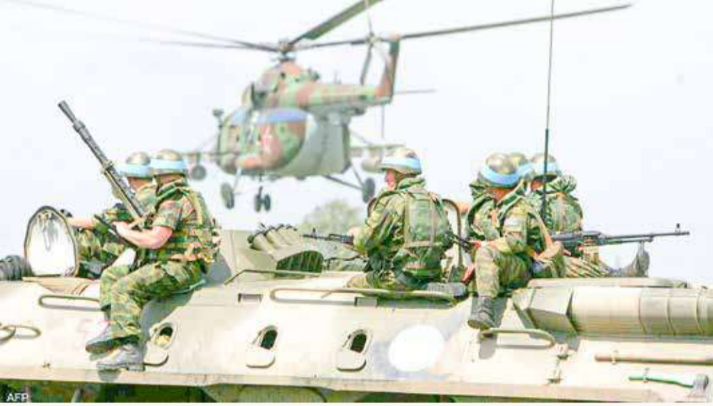
روسيا حشدت عشرات الآلاف من الجنود على حدود أوكرانيا

قال مسؤول عسكري روسي كبير، أمس (الاثنين)، إن موسكو مستعدة لفتح النار على أي سفن أو غواصات أجنبية تدخل مياها الإقليمية بصورة غير مشروعة، حسبما نقلت وكالة "إنترفاكس" الروسية للأنباء. إلا أن المسؤول ذكر أن أي قرار من هذا القبيل لن يتخذ إلا على "أعلى المستويات".