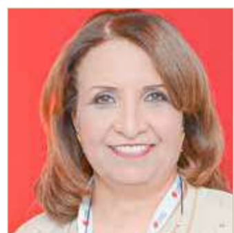
الشيخة حياة بنت عبدالعزيز