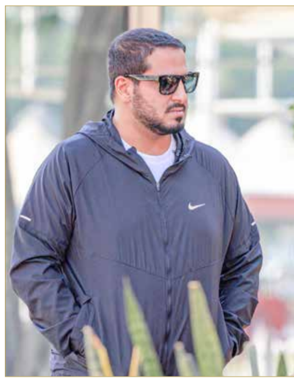
سمو الشيخ عيسى بن عبدالله

- السبت 19 فبراير 2022: السباق الرئيسي لمسافة 160 كم، وسباق الإسطبلات الخاصة المحلية لمسافة 120 كم.