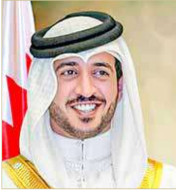
سمو الشيخ خالد بن حمد

أشاد النائب الأول لرئيس المجلس الأعلى للشباب والرياضة رئيس الهيئة العامة للرياضة رئيس اللجنة الأولمبية البحرينية سمو الشيخ خالد بن حمد آل خليفة، بالتفاعل المميز من بنك البحرين الوطني (NBB)، مع المبادرات التي يطلقها سموه لدعم المجالين الإنساني والاجتماعي. وقال سموه: "سعداء بتفاعل بنك البحرين الوطني لدعم مبادراتنا المختلفة لاسيما في المجالين الإنساني والاجتماعي، وأن إطلاقنا لمبادرة مع ابتسامة للأطفال المصابين بالسرطان، تهدف لتقديم الدعم اللازم للأطفال المصابين بمرض السرطان، والذي يشمل في مفهومه قيامنا جميعاً كأفراد وجهات ومؤسسات بتقديم الدعم للأطفال الذين يُكافحون مرض السرطان، ومنحهم الدعم النفسي والاجتماعي للمضي قدماً، حيث إننا ومن