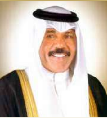
سمو أمير دولة الكويت