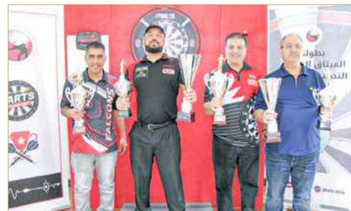
أصحاب المراكز الأربعة الأولى

بقوة اللعبة على الصعيد المحلي، ويعزز من خطة واستراتيجية اللجنة في تنظيم البطولات التي من شأنها أن ترتقي بقدرات منتسبيها ليكونوا خير سفراء لتمثيل مملكة البحرين في الاستحقاقات المقبلة.