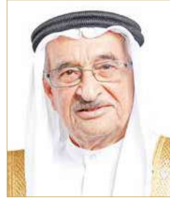
الشيخ محمد بن عبدالله