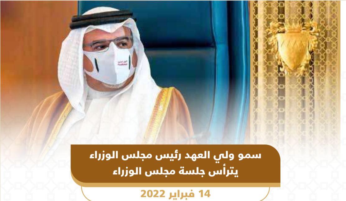
سمو ولي العهد رئيس مجلس الوزراء يترأس جلسة مجلس الوزراء