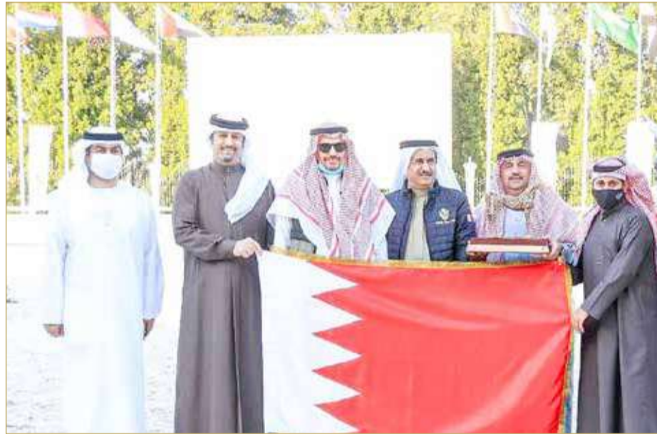
جانب من التتويج