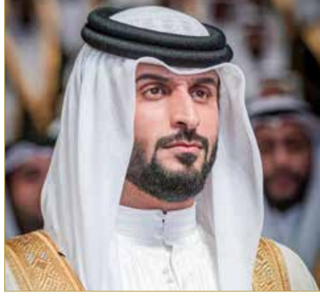
سمو الشيخ ناصر بن حمد آل خليفة

في إطار رؤية عاهل البلاد صاحب الجلالة الملك حمد بن عيسى آل خليفة وتطلعات ولي العهد رئيس مجلس الوزراء صاحب السمو الملكي الأمير سلمان بن حمد آل خليفة حفظه الله، أصدر ممثل جلالته الملك للأعمال الإنسانية وشؤون الشباب، رئيس مجلس إدارة الشركة القابضة للنفط والغاز سمو الشيخ ناصر بن حمد آل خليفة قراراً بتعيين عبدالحسين ميرزا مستشاراً لمجلس إدارة الشركة.