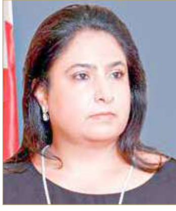
الشبيخة رنا بنت عيسى