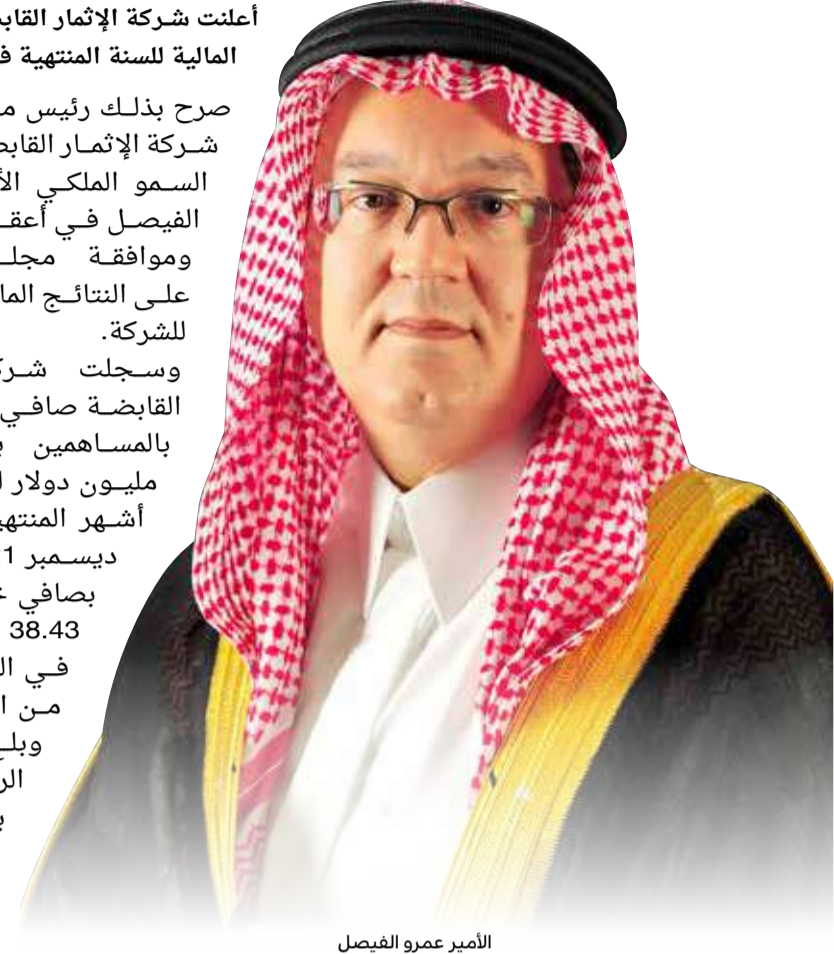
الأمير عمرو الفيصل

وسجلت شركة الإثمار القابضة صافي ربح خاص بالمساهمين بلغ 37.13 مليون دولار لفترة الثلاثة أشهر المنتهية في 31 ديسمبر 2021 مقارنة بصافي خسارة بلغت 38.43 مليون دولار في الفترة نفسها من العام 2020. وبلغ صافي الربح الخاص بالمساهمين للسنة المنتهية في 31