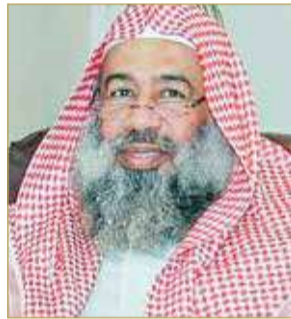
الشيخ جاسم السعدي