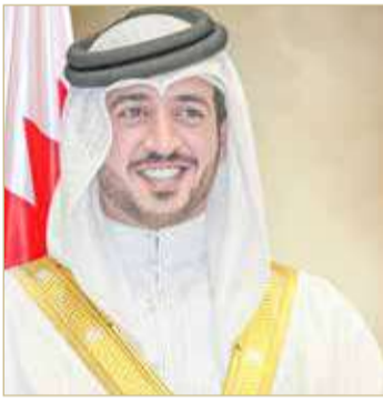
سمو الشيخ خالد بن حمد

أكد سمو الشيخ خالد بن حمد آل خليفة النائب الأول لرئيس المجلس الأعلى للشباب والرياضة ورئيس اللجنة الأولمبية البحرينية، أن ميثاق العمل الوطني، دفع لتحقيق نهضة رياضية شاملة، ساهمت في رفع مستوى الألعاب الرياضية وكفاءة منتسبيها، مضيفاً سموه أن ذلك مهد الطريق للفرق والمنتخبات الوطنية أن تحقق الإنجازات وأن ترفع علم مملكة البحرين عالياً في مختلف المحافل والمشاركات، حيث عزز ذلك من المكانة المرموقة التي تحتلها البحرين على مستوى خارطة الرياضة القارية والدولية.