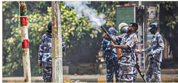
الامن السوداني يستخدم الغاز المسيل للدموع لتفريق محتجين على الانقلاب

أعلنت لجنة أطباء السودان المركزية، أمس الاثنين، مقتل متظاهر إثر إصابته بطلق ناري في الاحتجاجات التي شهدتها العاصمة الخرطوم، للمطالبة بالحكم المدني.