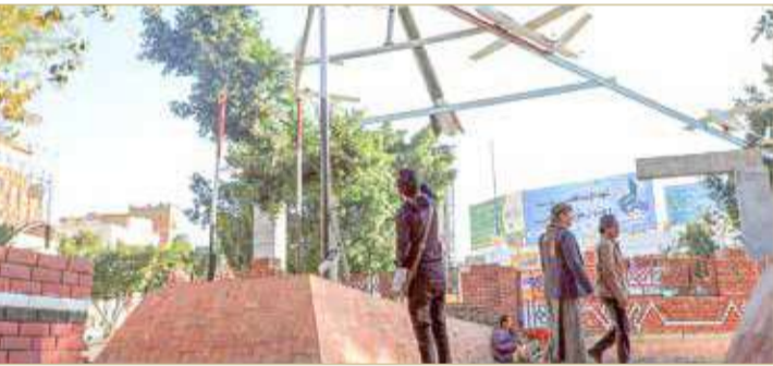
الحوثيون يستخدمون وزارة الاتصالات بصنعاء لدعم العمليات العدائية

أعلن التحالف الذي تقوده السعودية في اليمن أمس الاثنين أنه دمر نظام اتصالات، يستخدم بحسب قوله، في هجمات بطائرات مسيرة تابعة للحوثيين، ويقع قرب وزارة الاتصالات في صنعاء.