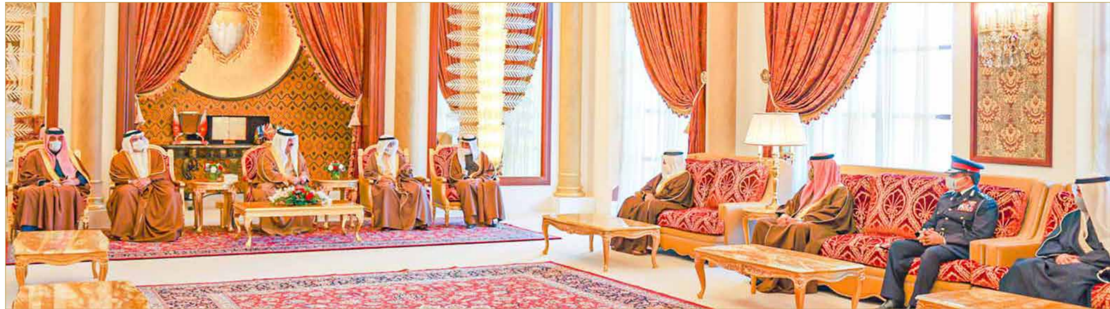
جلالة الملك يستقبل أعضاء مجلس العائلة المالكة

◆ توفير 40 ألف وحدة دافع لتحقيق مزيد من الخدمات المتكاملة للمواطنين