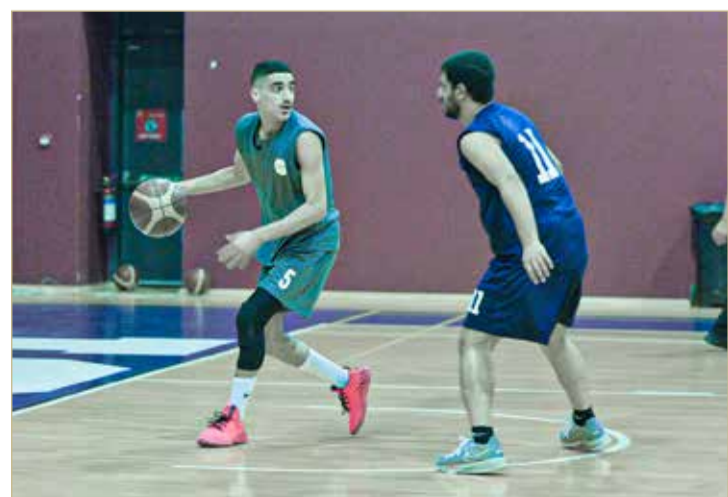
جانب من المنافسات

ألحق فريق جامعة البحرين للتكنولوجيا الخسارة الثالثة بفريق جامعة البحرين في ختام الدور التمهيدي لدوري الجامعات لكرة السلة، بفوزه عليه 82 مقابل 64. فقد انتهى الربيع الأول والثاني لمصلحته 22 مقابل 16، و25 مقابل 13، وأنهى جامعة البحرين الربع الثالث لصالحه 23 مقابل 15، واستطاع البحرين للتكنولوجيا الظفر بالربع الأخير 20 مقابل 12. ورفع البحرين للتكنولوجيا رصيده إلى 11 نقطة وأعلن تأهله إلى المربع، فيما حافظ جامعة البحرين على موقعه في الوصافة بـ 13 نقطة. وفي المباراة الثانية برع لاعبو الجامعة الخليجية والجامعة الأهلية في تقديم مباراة متميزة وقوية انتهت بفوز الخليجية بـ 9 مقابل 85، ليتصدر الخليجية الفرق بـ 15 نقطة، وضمن الأهلية مقعده في المربع بـ 12 نقطة.