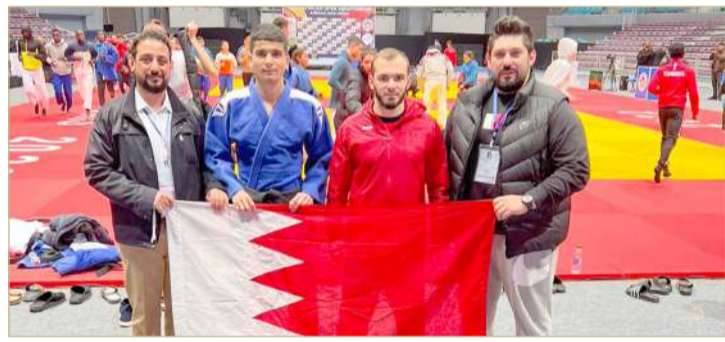
منتخبنا الوطني للجودو

من هذه المشاركة. وقال: "تعتبر بطولة تونس إحدى البطولات المهمة التي يشارك فيها المنتخب، وهي المحطة الأولى في سبيل الوصول لأولمبياد باريس 2024، حيث أن المنتخب مقبل على العديد من المشاركات القادمة، ونتطلع لتحقيق النتائج الإيجابية في هذه البطولة والمساهمة في تصنيف اللاعبين بأفضل صورة".