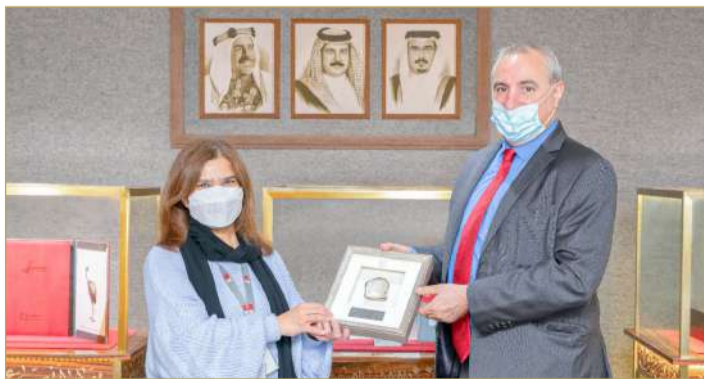
زيارة السفير الإسرائيلي لمعهد دانات

◆ إيتان نائي: مختبر "دانات" الأفضل من نوعه حول العالم