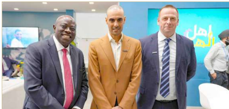
مشاركة وفد "زين" المؤتمر العالمي للاتصالات

وأكدت "زين" على هذا التوجه بحجم النشاطات والاتفاقيات التي دشنتها خلال فعاليات هذا الحدث، وهو ما يمثل دلالة على سعيها للتأثير في القطاع الرقمي وصناعة تكنولوجيا المعلومات والاتصالات. واستعرضت زين في جناحها الخاص الذي ضم قطاعات خدماتها التكنولوجية المبتكرة، بشكل يعكس مفهومها الخاص بخلق مستقبل رقمي مستدام، خططها في دعم بيئة الأعمال، والحلول الإبداعية لمنصات التكنولوجيا العالمية، مبيّنة أنها بوصفها مزوداً لخدمات الاتصالات المتنقلة، فإنها تلعب دوراً مؤثراً عندما يتعلّق الأمر بتوليد تأثيرات اقتصادية إيجابية.