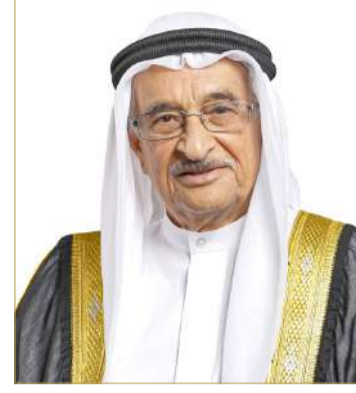
الشيخ محمد بن عبدالله بن خالد