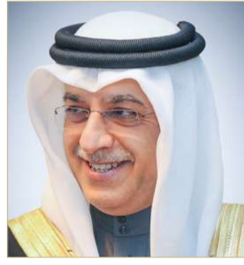
سلمان بن إبراهيم

خليفة أن الإنجاز الكبير يتوج الجهود المخلصة لسمو الشيخ خالد بن حمد آل خليفة النائب الأعلى لرئيس المجلس الأعلى للشباب والرياضة رئيس الهيئة العامة للرياضة