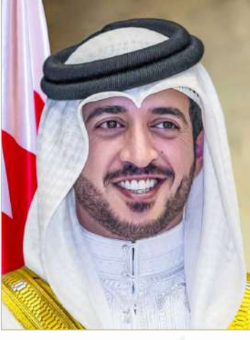
سمو الشيخ خالد بن حمد

وستختص اللجنة بالإشراف على كافة الإجراءات اللازمة للإعداد وتنظيم دورة الألعاب المدرسية بمملكة البحرين، وكذلك التنسيق مع كافة الجهات الحكومية والغير حكومية المعنية بتنظيم البطولة داخل وخارج مملكة البحرين. وترفع هذه الدراسة إلى سمو الشيخ خالد بن حمد آل خليفة رئيس الهيئة العامة للرياضة للاعتماد. على أن تختص كذلك بالترتيب للفعالية وتدبير كافة الاحتياجات اللازمة لإقامتها على أكمل وجه وبما يليق باسم مملكة البحرين.