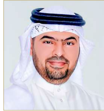
الشيخ مشعل بن محمد

خدمات الرعاية الاجتماعية والنفسية والصحية عبر مراكز متخصصة للرعاية الاجتماعية ومراكز إيواء مؤقتة وبديلة على نحو يساهم في تحسين مستوى الخدمة الاجتماعية المقدمة وتأهيل الفئات المستهدفة للاندماج في المجتمع وسوق العمل، الأمر الذي سينعكس بشكل إيجابي على تنمية المجتمع البحريني وتحقيق الاستدامة والرفاهية الاجتماعية، حيث يتكون المشروع من ستة مبانٍ متصلة وهي مركزاً لرعاية الأحداث ودور الكرامة للرعاية الاجتماعية والأمان لإيواء ضحايا الإتجار بالأشخاص ومركزاً لحماية الطفل ومركزاً للرعاية البديلة لإيواء الأطفال المتعرضين للعنف الأسري والاجتماعي،