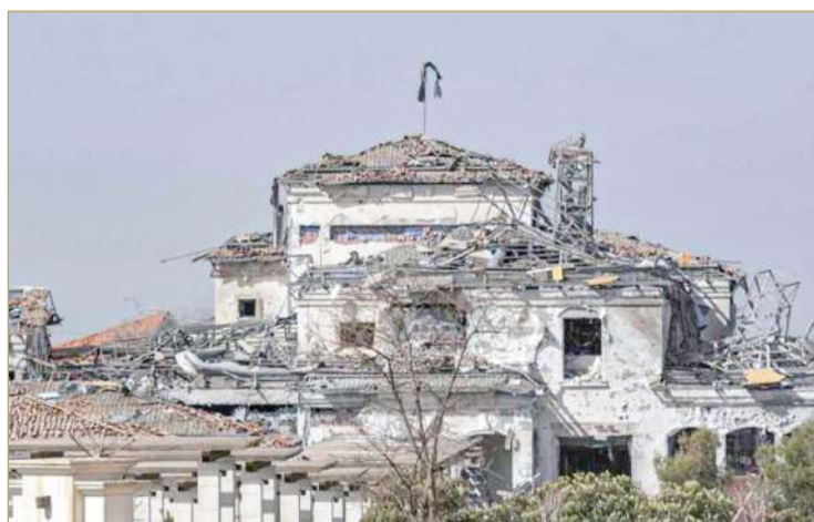
دمار جراء استهداف صواريخ إيرانية منطقة أربيل

بالأرواح، ما عدا خسائر مادية.. ونقلت وسائل إعلام رسمية إيرانية عن الحرس الثوري بيانا يعلن فيه المسؤولية عن هجمات صاروخية على ما سماها "مراكز استراتيجية" إسرائيلية في أربيل. (12)