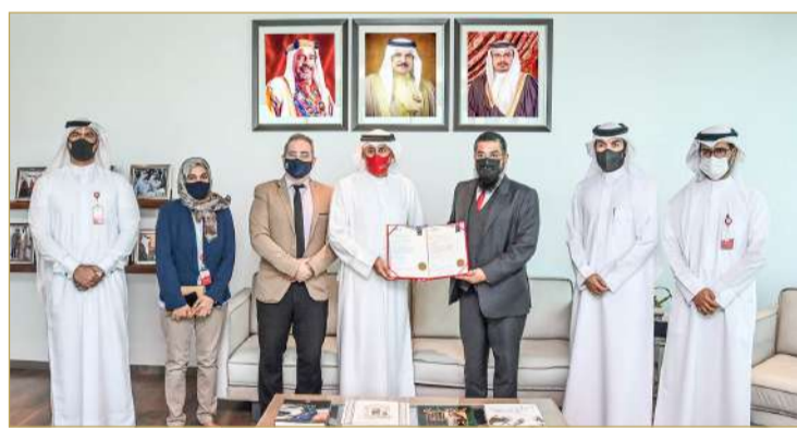
أثناء تسلم الشهادتين

مهنية وجودة الأداء، مما يساهم في رفع مستوى الكفاءة والإنتاجية في الوزارة عبر إتباع نظام إدارة الجودة أيزو 9001:2015 بما ينعكس على الارتقاء بالخدمات والأداء الرامي إلى تلبية تطلعات الزبائن في جودة وسرعة إنجاز الخدمات وكفاءة مقدمي الخدمة.