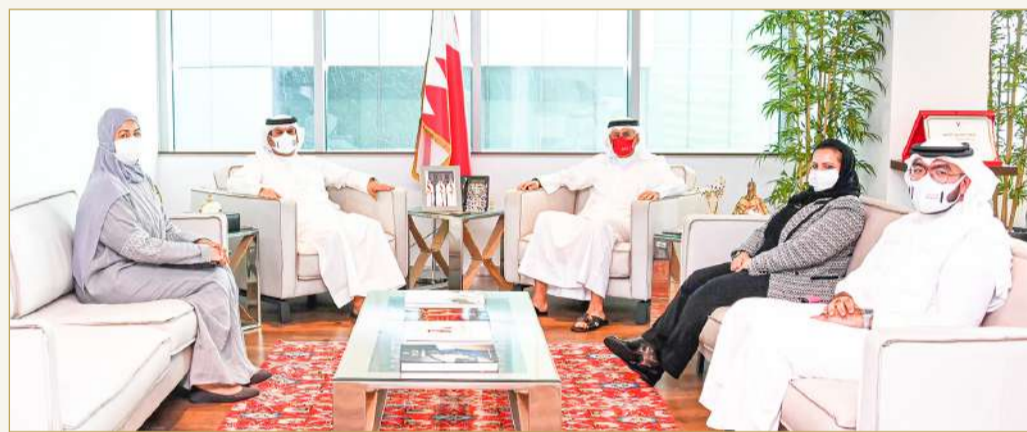
الوزير الزباني ملتقياً محمد بن دينة

النمو الاقتصادي وتنشيط الحركة التجارية والصناعية في مملكة البحرين وفق المعايير العالمية للحفاظ على البيئة وغيرها.