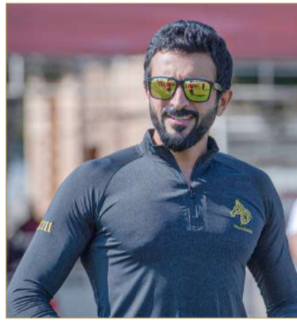
سمو الشيخ ناصر بن حمد

وباشرت اللجان تنفيذ توجيهات سمو الشيخ عيسى بن عبدالله آل خليفة رئيس الاتحاد الملكي للفروسية وسباقات القدرة بالتجهيز المبكر للبطولة والوصول إلى كامل الجاهزية قبل انطلاقها. وبهذه المناسبة، أكد سمو الشيخ ناصر بن حمد آل خليفة أن الجهود الكبيرة التي يبذلها الاتحاد الملكي للفروسية وسباقات القدرة محل تقدير واعتزاز من أجل تأمين كافة الاحتياجات للفرسان والإسطبلات لإخراج السباق بصورة مميزة من الناحيتين التنظيمية والفنية وهو ما يسهم في إعطاء الفرسان حافزاً للتألق والتميز في السباقات. وقال سمو الشيخ ناصر بن حمد آل