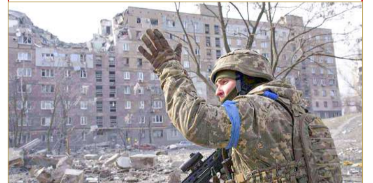
مسؤول أوكراني يتهم الجيش الروسي باستخدام قنابل فسفورية