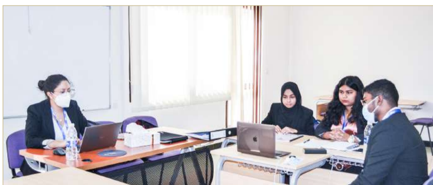
جانب من تصفيات المسابقة

للبنات، وهي الجامعة الوحيدة في المملكة التي تطرح برنامج قانون ثنائي اللغة، قد استضافت تصفيات نسخة الشرق الأوسط من المسابقة للمرة الخامسة في حرمها الجامعي بمملكة البحرين في إطار سعيها لربط الجانب الأكاديمي بالواقع المهني ورفع سوق العمل بكفاءات تعليمية تتماشى مع المتطلبات العالمية في المجال القانوني عبر تزويد الطلبة بتجربة تعليمية تركز على تطبيق المنهج النظري عملياً.