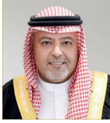
الشيخ خالد بن علي