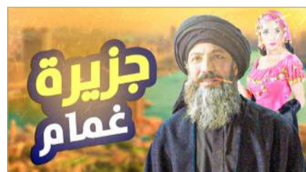
مسلسل جزيرة غمام