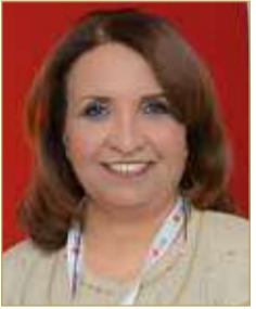
الشيخة حياة بنت عبدالعزيز