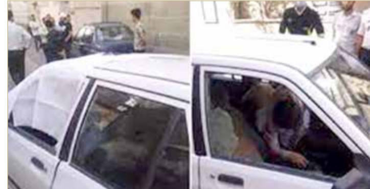
سيارة الضابط القتيل

اغتيال ضابط برتبة عقيد في الحرس الثوري الإيراني بإطلاق نار عليه قرب منزله في شرق طهران أمس، وفق ما أفادت مصادر رسمية إيرانية.