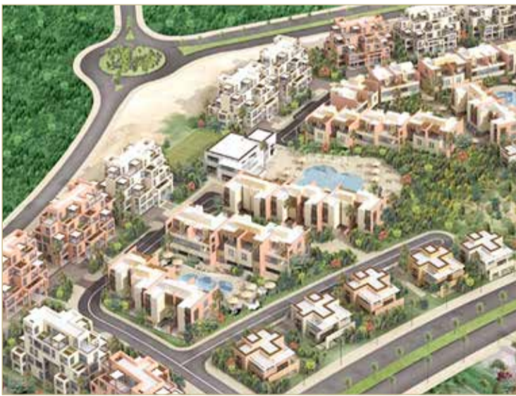
مخطط تلال الغروب

أعلنت لجنة تسوية مشاريع التطوير العقارية المنتهية عن طرح مشروع "المدينة الأنيقة" و"تلال الغروب" للبيع في مزاد علني باعتباره السبيل الأمثل لإزالة عثرات تلك المشاريع، إذ أشارت اللجنة حول مشروع "المدينة الأنيقة" إلى أنها استنفدت جميع سبل تسوية المشروع بالطرق الودية، وتبين لها عدم كفاءة المطور لإدارة المشروع فضلاً عن عدم تقديمه خطة مقبولة لحل التعثر خلال المواعيد المقررة قانوناً، ونظراً لبحجم الالتزامات التي على المشروع بما يحول دون قبول أي مطور جديد لاستكمالها، ارتأت اللجنة