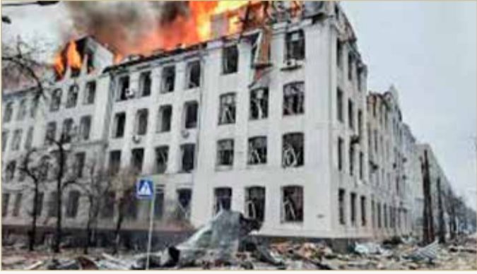
مظاهر القصف الروسي لشرق أوكرانيا