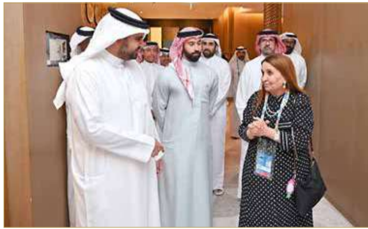
سموه أثناء استقبال الوفود