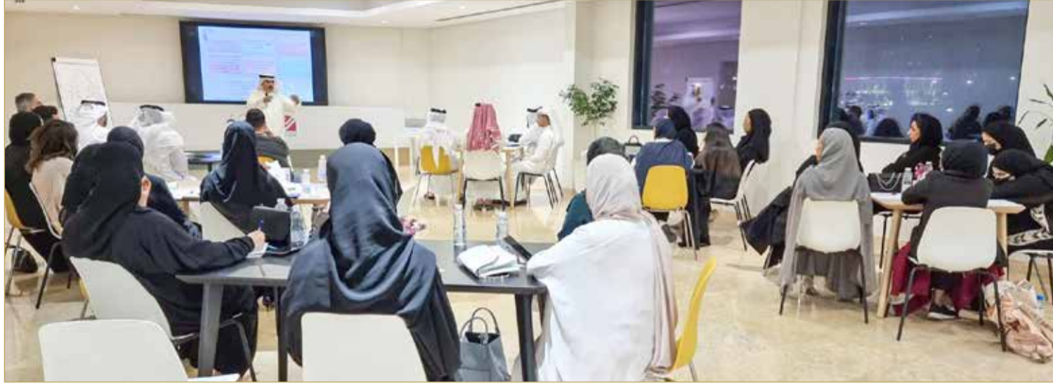
جمعية الكلمة الطيبة

انطلقت مساء السبت الماضي، أولى الورش التدريبية ضمن مبادرة سمو الشيخ عيسى بن علي آل خليفة لإعداد القادة الشباب بنسختها الثانية والتي تنظمها جمعية الكلمة الطيبة بالتعاون مع المعهد العربي للتخطيط بدولة الكويت خلال الفترة من 21 مايو وحتى 23 يونيو، بهدف إعداد شباب قادر على مواجهة التحديات وتحمل المسؤولية واتخاذ القرار وكذلك تمكينهم ورفع مستوى قدراتهم ومهاراتهم المهنية والقيادية.