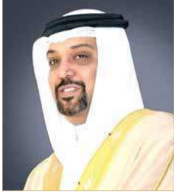
سلمان بن خليفة

بإسهامات سمو الشيخ ناصر بن حمد آل خليفة فيما حققته الرياضة البحرينية من إنجازات مشرفة تضاف لسجل الرياضة الحافل لمملكة البحرين. كما أشاد وزير المالية والاقتصاد الوطني بالمستوى المتقدم والمتطور الذي وصل إليه الفريق الملكي للقدرة بقيادة سمو الشيخ ناصر بن حمد آل خليفة في السباق، وما حققه من إنجازات رفعت اسم مملكة البحرين في مختلف المحافل الرياضية، متمنياً لسموه دوام التوفيق والنجاح في مواصلة تحقيق الإنجازات العالمية بقيادة الرياضة البحرينية نحو مزيد من النجاحات في شتى الميادين.