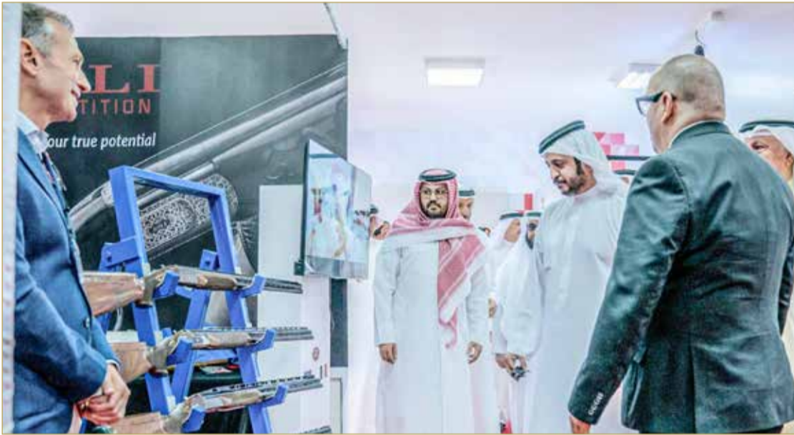
من افتتاح المعرض

المشاركة المشرفة في مختلف المحافل والبطولات. وقد قام سموه بجولة تفقدية في أرجاء المعرض وأقسامه، حيث اطلع سموه على التقنيات المستخدمة في مجال الرماية والصيد، واستمع سموه إلى شرح موجز عما يقدمه المعرض من خيارات ومنتجات وأدوات حديثة. كما التقى سموه بعدد من المشاركين في المعرض، وأشاد سموه بمشاركتهم متمنيا سموه لهم دوام التوفيق والنجاح.