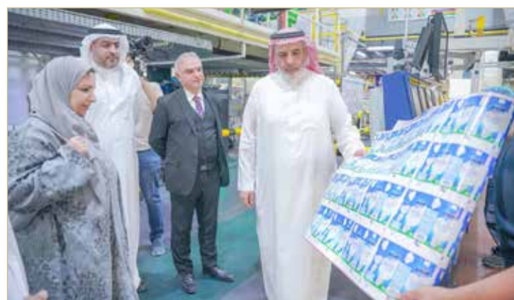
وكيل "الصناعة" تطلع على تجربة "مدن"