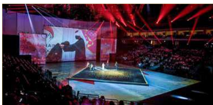
لوحة البحرين الغنائية في حفل الافتتاح

يستهل المنتخب الوطني للهوكي اليوم (الاثنين) مشواره في مسابقة الهوكي على الجليد، عندما يواجه المنتخب الكويتي عند الساعة 7 مساءً على الصالة الرئيسية لنادي الكويت للألعاب الشتوية.