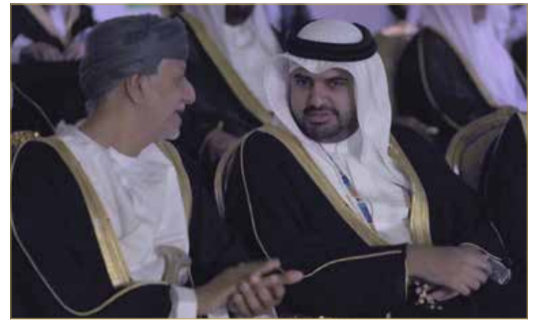
سمو الشيخ عيسى بن علي أثناء حضور حفل الافتتاح

ويشارك في المسابقة 4 منتخبات هي: البحرين، الكويت، السعودية والإمارات. ويتطلع أحمر الهوكي أن يحقق نتيجة إيجابية في هذه المشاركة من خلال الوصول لمنصة التتويج والمنافسة على إحدى المراكز الثلاثة الأولى.