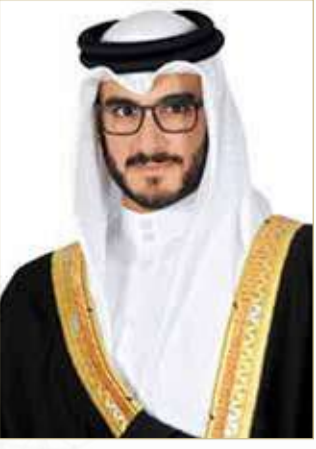
سمو الشيخ عيسى بن سلمان

كما أشاد سموه بإنجازات العالمية التي يحققها الفريق الملكي للقدرة بقيادة سمو الشيخ ناصر بن حمد آل خليفة، ما عزز من مكانة مملكة البحرين في رياضة الفروسية والخيل على المستويين الإقليمي والعالمي، وهي إنجازات محل فخر واعتزاز جميع أبناء البحرين وتدفع لمزيد من البذل والعطاء لرفع اسم المملكة في المحافل الرياضية، متمنياً لسموه دوام التوفيق والنجاح.