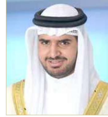
سمو الشيخ عيسى بن علي

هنا وكيل وزارة شؤون مجلس الوزراء نائب رئيس اللجنة الأولمبية البحرينية سمو الشيخ عيسى بن علي آل خليفة، ممثل جلالة الملك للأعمال الإنسانية وشؤون الشباب رئيس المجلس الأعلى للشباب والرياضة قائد الفريق الملكي للقدرة سمو الشيخ ناصر بن حمد آل خليفة بحصول سموه على المركز الأول في سباق 160 كم في بطولة مونتل سينو الدولية لسباقات القدرة التي أقيمت في إيطاليا، بالإضافة إلى فوز الفريق الملكي بلقب سباق 120 كم. وأشاد سموه بإنجاز سمو الشيخ ناصر الجديد في هذا السباق الذي