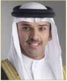
الشيخ علي بن خليفة