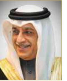
الشيخ سلمان بن إبراهيم