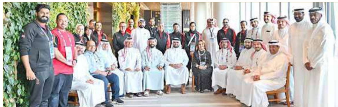
سمو الشيخ عيسى بن علي يتوسط الوفد الإداري

حصدت لاعبة منتخب السيدات للألعاب الإلكترونية نوف بخيت على المركز الثاني والذهبية الفضية، في منافسات مسابقة الألعاب الإلكترونية.