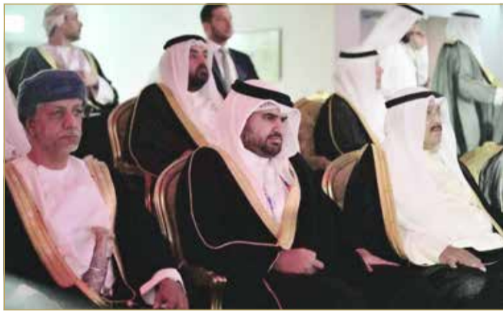
سموه يشهد حفل الافتتاح