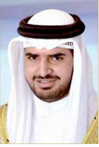
سمو الشيخ عيسى بن علي