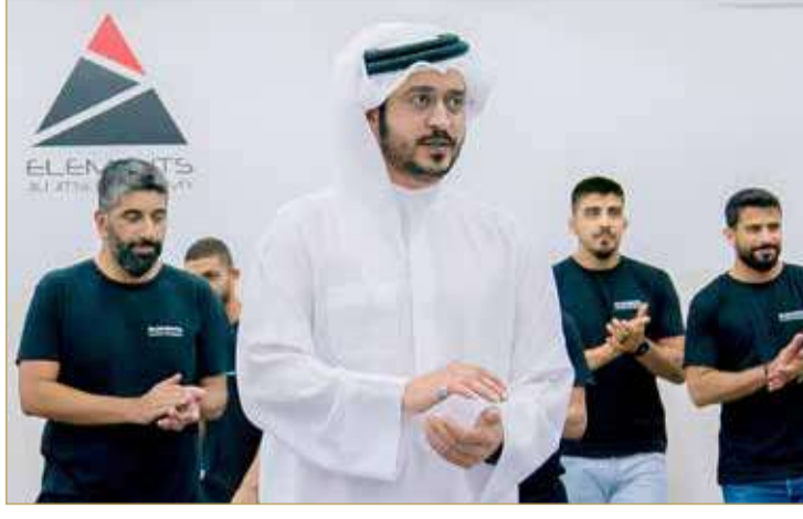
لقطات من افتتاح الصالة