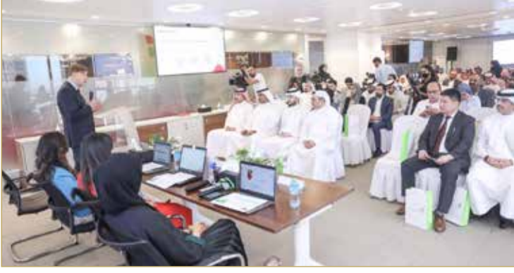
جانب من الحضور في الفعالية