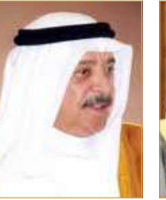
الشيخ خالد بن أحمد