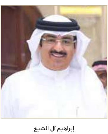
إبراهيم آل الشيخ

البحرين سوف يواصل بعزم وإرادة وعزيمة لا تلين تحقيق المزيد من الإنجازات والنجاحات بما يعود بالخير على الوطن والمواطن. وشدد آل على أن المستقبل بإذن الله تعالى مشرق ومزدهن، منوهاً إلى أنه على الجميع أن يبذل كل ما في وسعه من أجل التعاون مع القيادة الرشيدة في النهوض بالاقتصاد الوطني، لاسيما شركات القطاع الخاص والجمعيات الأهلية ومؤسسات المجتمع المدني.