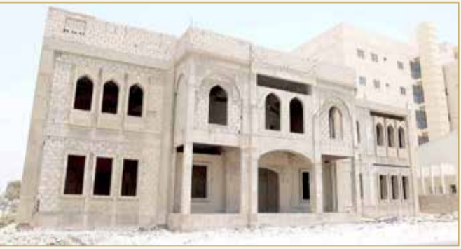
واجهة المقر الجديد العالق

البلاد | ليس مال الله إنصوير: رسول الحجري