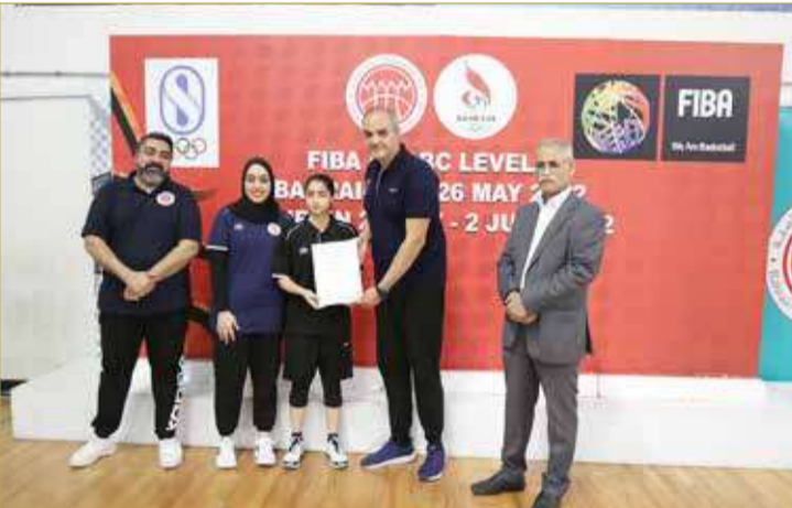
جانب من توزيع الشهادات على المشاركات

أرض الواقع. مشيداً بحرصها الشديد على التواجد في أغلب الفعاليات التي يقيمها اتحاد السلة ودعمها لإقامة مثل هذه الأنشطة والفعاليات التي تُعزز من دور المرأة في الجانب الرياضي.