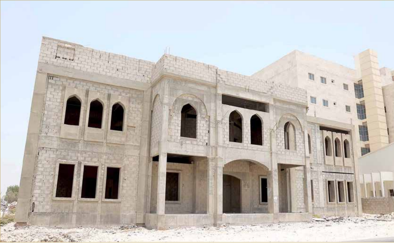
واجهة المقر الجديد العالق