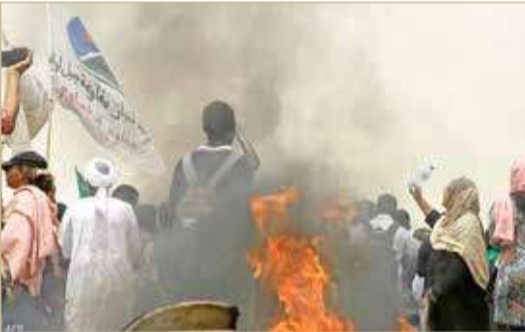
جانب مظاهرات الذكرى الثالثة لفض الاعتصام

وأغلقت السلطات جسورا وطوقت مقر قيادة الجيش لمواجهة احتجاجات معلنة بذكرى فض الاعتصام أمس الجمعة. وتأتي مواكب اليوم بالتزامن مع خطوات بدأتها السلطات السودانية لتهنئة المناخ لحوار ينهي الأزمة السياسية الطاحنة التي تعيشها البلاد، تمثلت في رفع حالة الطوارئ بعد 7 أشهر من السريان، وإطلاق سراح العديد من المعتقلين السياسيين.