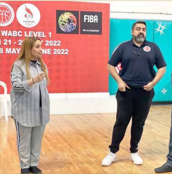
الشبيخة حياة بنت عبدالعزيز تتحدث للمشاركات

مملكة البحرين وخصوصاً ما يتعلق من جانبه قدم رئيس الاتحاد البحريني لكرة وليد العلوي شكره الجزيل للشبيخة حياة بنت عبدالعزيز على دعمها للرياضة النسائية في مملكة البحرين وخصوصاً ما يتعلق