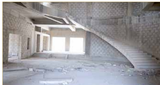
الطابق الأرضي بالمقر العالق

وأكمل المدفع أنه في اللقاء الأخير بين مجلس إدارة الجمعية ووزير العدل والشؤون الإسلامية والأوقاف الشيخ خالد بن علي آل خليفة تم مناقشة وضع المقر العالق، وطلب الوزير رفع خطاب بشأن طلب تخصيص ميزانية لاستكمال البناء لعرض الموضوع على مجلس الوزراء والذي يأمل من يكون آخر محطة في حلحلة موضوع المقر العالق منذ سنوات طويلة وأن جمعية المحامين البحرينية على ثقة تامة بأن الحكومة الرشيدة برئاسة صاحب السمو الملكي ولي العهد رئيس مجلس الوزراء لن تتردد في مد يد العون والمساعدة في هذا الأمر المهم.