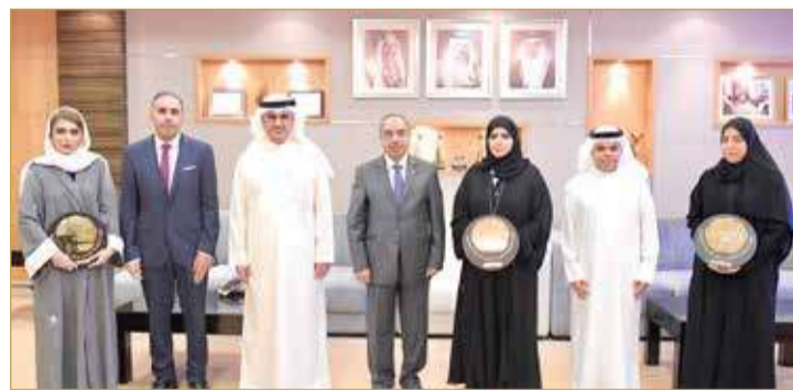
لقاء وزير الأشغال بالفائزين بجائزة الدرع الذهبي

البلدية بأعلى درجات الكفاءة والمهارة والسرعة مع ضمان استدامتها وفق أعلى درجات الجودة وبما يتناسب مع ركب التطوير والتقدم، ويرفد أهداف المسيرة التنموية الشاملة بقيادة حضرة صاحب الجلالة الملك حمد بن عيسى آل خليفة عاهل البلاد المعظم حفظه الله ورعاه. وأكد على ضرورة الاستمرارية في الارتقاء بالمراكز الخدمية وتحفيز كافة الموظفين في مختلف مواقع عملهم على التطوير والإبداع والتميز في تقديم الخدمات البلدية.