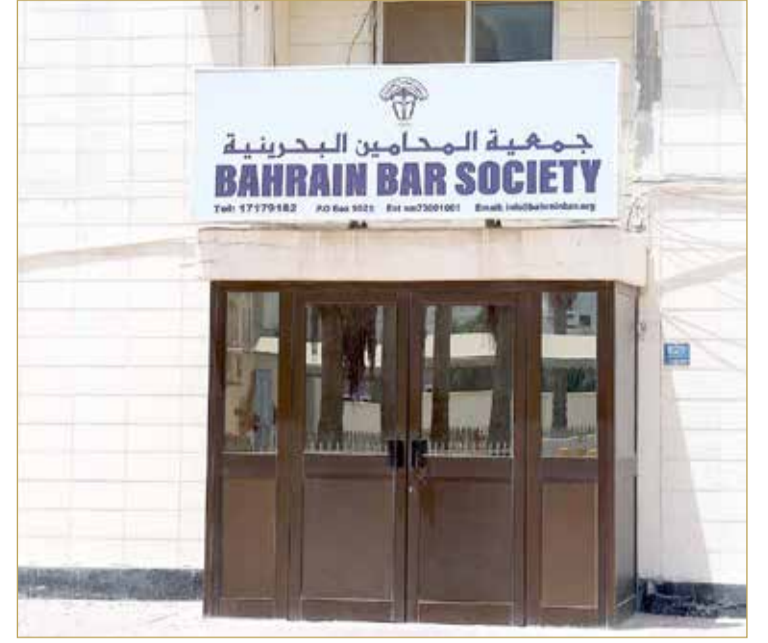
23 عاما في شقة صغيرة بالعدلية

بيت المحامين الجديد لا يزال بناء أسود منذ 17 سنة