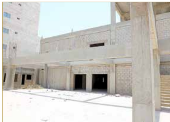
المقر الدائم ينتظر الاستكمال