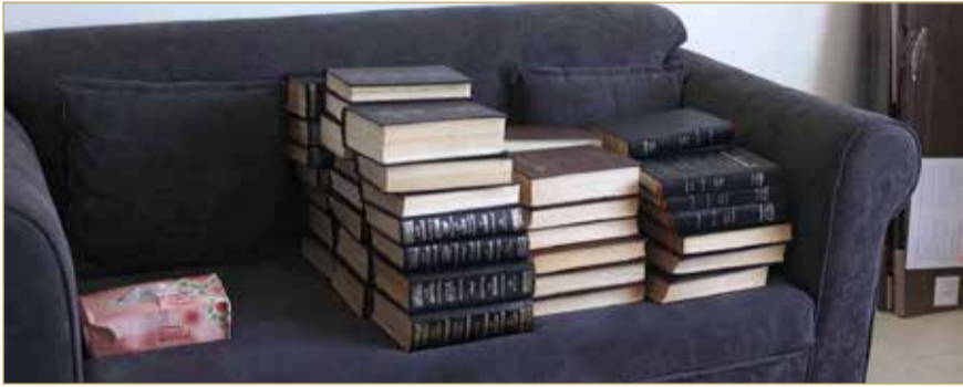
لا مكان للكتب بالمقر الحالي