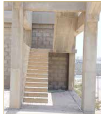
يقع المقر الجديد في البحر

الأخير الذي مضى عليه 18 عاما ليس لإشقة سكنية لا تليق بجمعية تمثل مملكة البحرين في كافة المحافل الدولية، كما أنها مستأجرة ويدفع من ميزانية الجمعية 154 دينارا شهريا كإيجار للمقر الحالي، فضلا عن فاتورة الكهرباء والماء والهاتف والإنترنت وأجر عامل وسكرتيرة. وأوضح أن جمعية المحامين لا دخل لها سوى اشتراكات المحامين