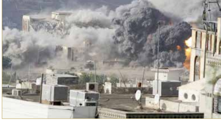
قصف حوثي سابق للمناطق السكنية في تعز

كما أعرب المجلس عن أمله في أن تترجم الهدنة المعززة إلى وقف دائم لإطلاق النار وتسوية سياسية شاملة، تحت رعاية الأمم المتحدة، داعياً الأطراف اليمنية إلى مواصلة مشاركتها مع المبعوث الأممي والتفاوض والتواصل مع بعضها بعضاً بروح الاحترام المتبادل والمصالحة. وحفلت الحكومة اليمنية، أمس، ميليشيا الحوثي مسؤولية تعثر استئناف مفاوضات فتح معابر والطرق في تعز برعاية الأمم المتحدة في العاصمة الأردنية عمان.