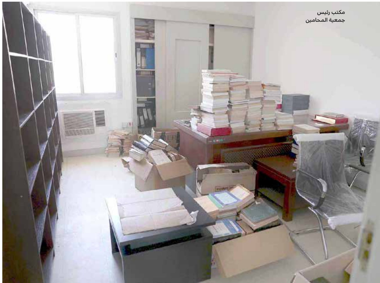
مكتب رئيس جمعية المحامين