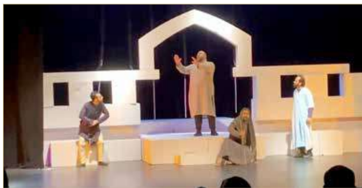
مشهد من المسرحية

في دور مختار القرية، في التأثير على المجتمعات وتوجيهها بالطريقة التي يرسمون ويخططون لها. ولم تخل المسرحية، من نقد لحب السلطة والجاء والاستئثار على حساب الآخرين وسلب حقوقهم، خصوصاً في المحور الرئيس الذي تناولته المسرحية حول اختتام رجلين ومعهم المختار، على قطعة أرض كلٌ يدعي أحقيته في امتلاكها.