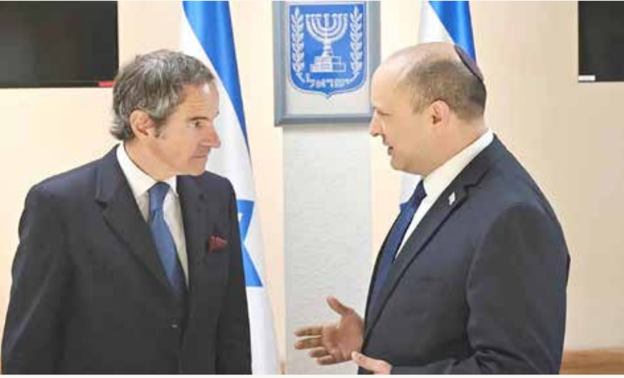
لقاء رافايل غروسي ونفتالي بينيت

وأضاف "بينما تفضل إسرائيل المساعي الدبلوماسية لحرمان إيران من إمكانية تطوير أسلحة نووية، فإنها تحتفظ بالحق في الدفاع عن النفس واتخاذ إجراءات ضد إيران؛ لوقف برنامجها النووي إذا فشل المجتمع الدولي في القيام بذلك خلال إطار