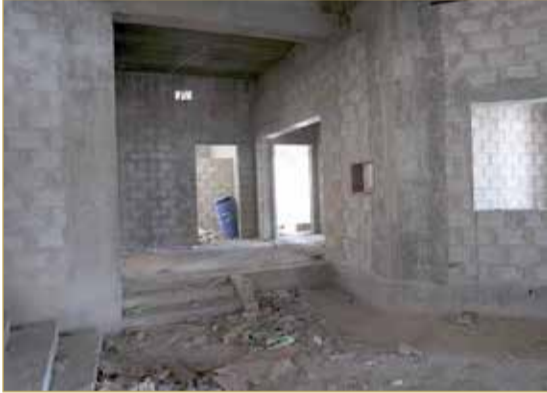
كل شيء على حاله

تقرير استكمال بناء المقر في عهدة إدارة المشاريع بوزارة الأشغال