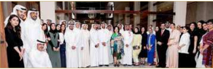
هيئة البحرين للثقافة والآثار

قدموه في هذه المشاركة التي عكست كثافة التاريخ والإرث المادي وغير المادي الذي تحتويه أرض البحرين الغنية بكتسباتها التاريخية. كما كانت مناسبة لشكر كل الداعمين والمساهمين في نجاح هذه التجربة من جهات عامة وخاصة. وحضر اللقاء 116 شخصاً ساهموا كل بحسب مسؤولياته بإنجاح تجربة جناح البحرين في الإكسبو الذي زاره خلال تنظيم هذا المعرض الدولي أكثر من مليون ونصف زائر من مختلف دول العالم، اكتشفوا أثناء زيارتهم تاريخ البحرين عبر المعارض التي قدمها جناح في مبنى لفت أنظار الكثرين بأعمده الـ 126 وارتفاعه الذي بلغ 24 متراً.