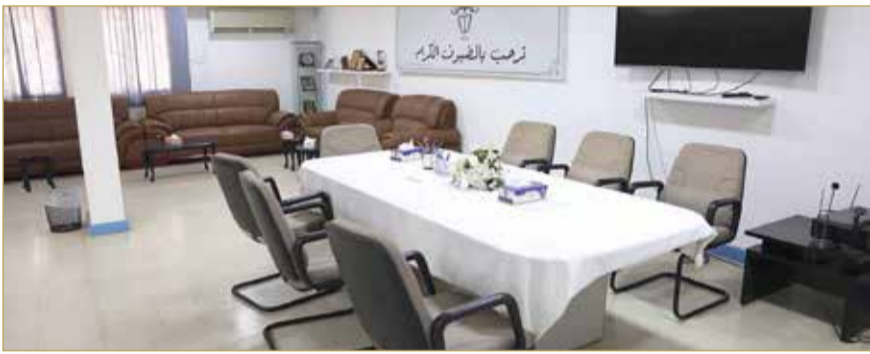
طاولة الاجتماعات في المقر الحالي