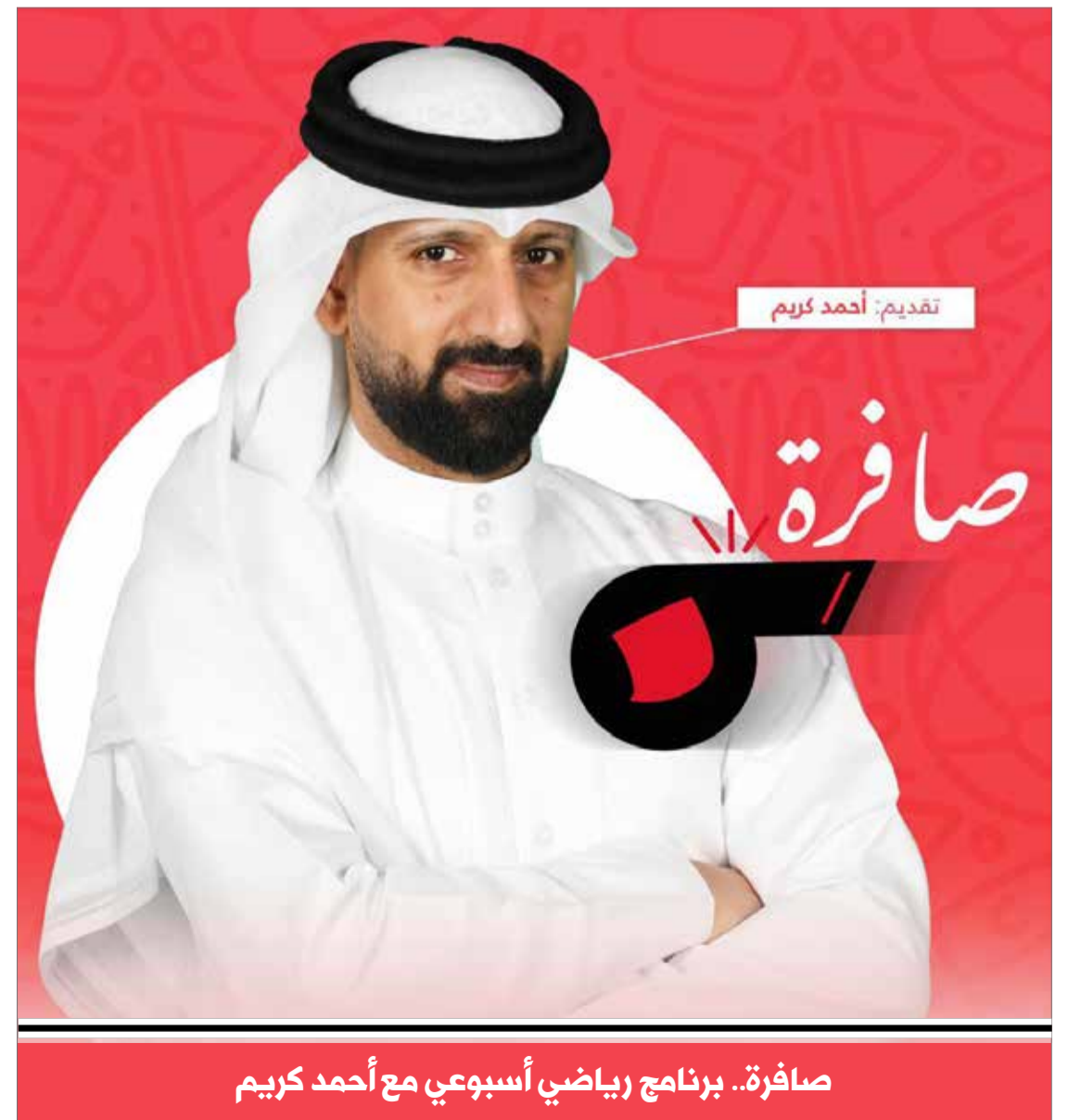
تقديم: أحمد كريم

جاء ذلك خلال استقبالها عضو هيئة التدريس بكلية البحرين للمعلمين، الشیخة هالة بنت علي آل خليفة، في مقر الجامعة بالصخير، وهنأتها لتأهلها