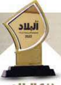
درج البلاد للمسؤولية الاجتماعية للشركات 2022

زاوية اسبوعية تسلط الضوء على أبرز المشاركين في جائزة درج البلاد للمسؤولية الاجتماعية للشركات للعام 2022 ومبادراتهم