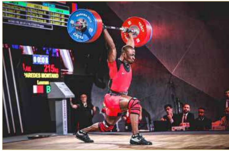
جانب من مشاركة البطل ليزمان

2022، حيث تقام المنافسات على 3 فترات، حيث تبدأ الفترة الأولى عند الساعة 10 صباحا بمنافسات وزن 109 كيلوجرامات للرجال، تليها الفترة الثانية عند الساعة 12:30 ظهرا وتشهد إقامة منافسات وزن فوق 87 كيلوجراما للسيدات، في حين تقام الفترة الثالثة عند الساعة 3 عصرا والتي يقام خلالها منافسات