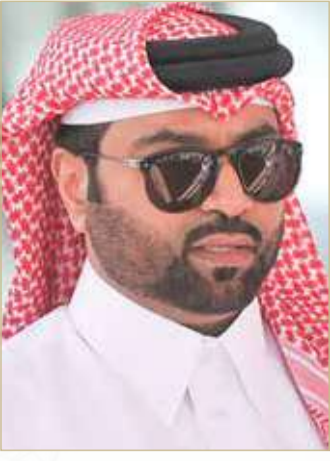
سمو الشيخ فيصل بن راشد

حصد المركز الأول في سباق 160 كلم، والفارس معيوف عبدالعزيز الريمحي الذي فاز بالمركز الأول في سباق 127 كلم، والفارس سمو الشيخ عيسى بن فيصل آل خليفة الذي حقق المركز الثالث في سباق 100 كلم. وأكد سموه أن توالي تحقيق مملكة البحرين للإنجازات الرياضية الدولية يعكس ما تحظى به الرياضة من دعم ومساندة من ملك البلاد المعظم، ومتابعة من سمو ولي العهد رئيس مجلس الوزراء.