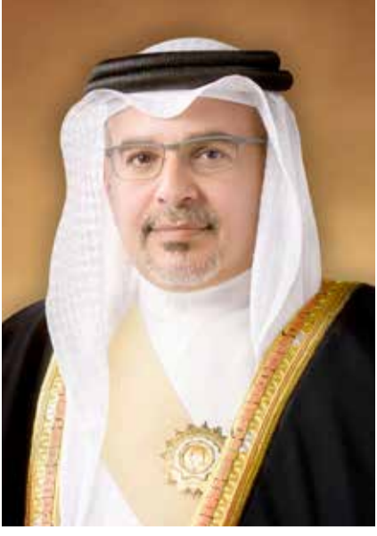
سمو ولي العهد رئيس الوزراء