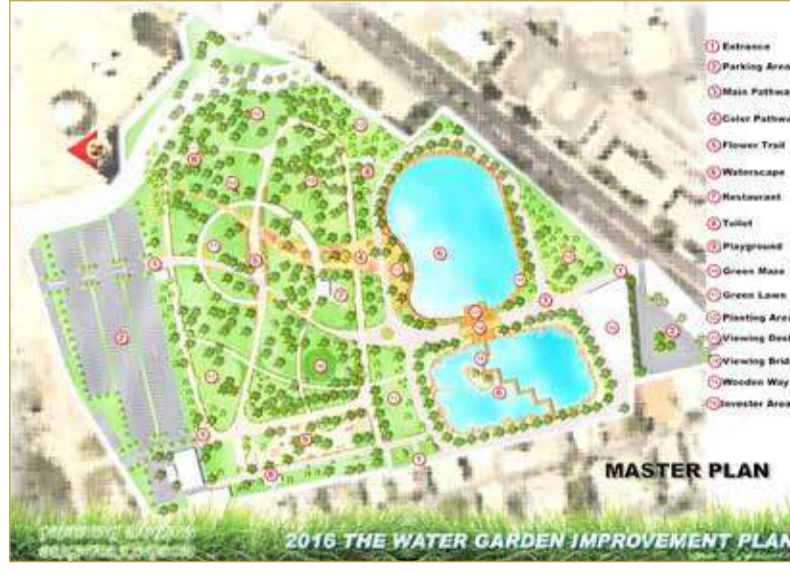
بحيرات ومساحات خضراء ولعب بمعايير أوروبية