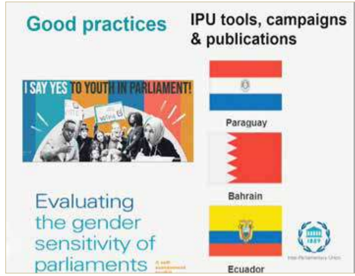
الاتحاد البرلماني الدولي يثني على التزام مجلسي الشورى والنواب بتسليم التقارير والبيانات الدورية ومراعاة التوازن بين الجنسين في أمانتي المجلسين