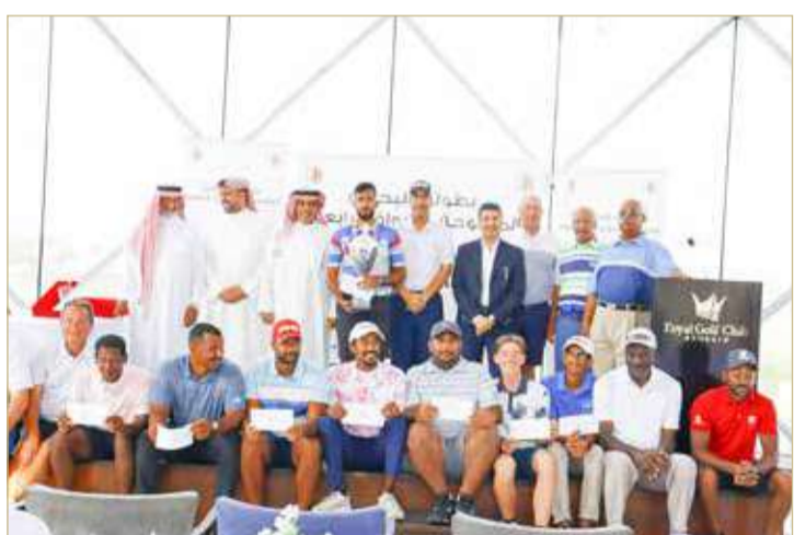
صورة جماعية بعد التتويج