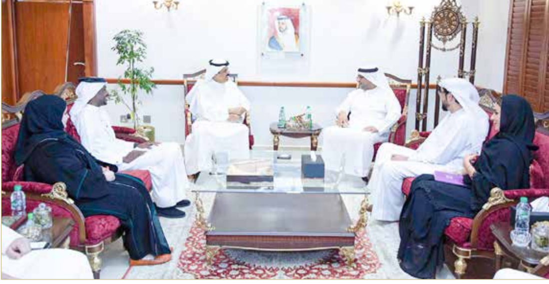
وزير التربية والتعليم يزور الأرشيف والمكتبة الوطنية بدولة الإمارات العربية المتحدة الشقيقة