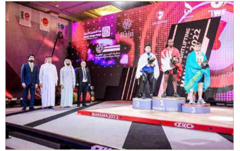
جانب من التتويج