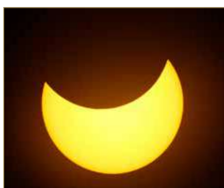
صورة أرشيفية للكسوف في مملكة البحرين