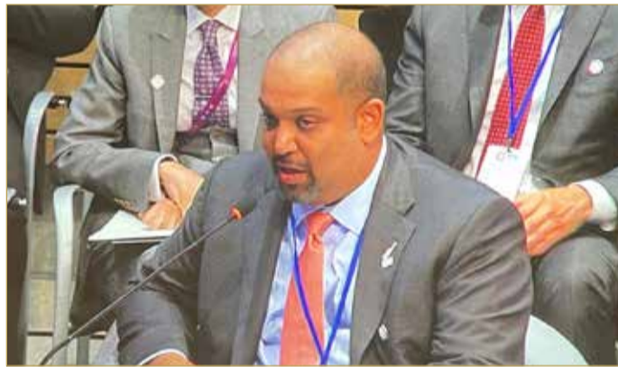
وزير المالية والاقتصاد الوطني يلقي البيان

المنامة - وزارة المالية والاقتصاد الوطني