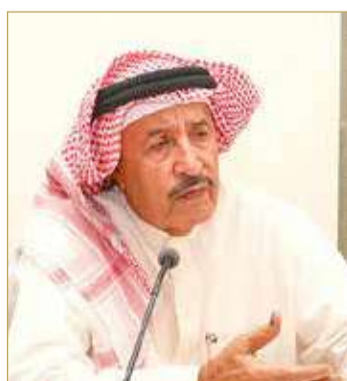
سلمان بن هندي

تشرف محافظ محافظة المحرق رئيس المجلس التنسيقي سلمان بن هندي المناعي باسمه وباسم جميع أعضاء المجلس بالتعبير عن جليل الامتنان والفخر بجهود القيادة الرشيدة والتي شملت دعوة ملك البلاد معظم صاحب الجلالة الملك حمد بن عيسى آل خليفة، لقداسة البابا فرنسيس بابا الفاتيكان والشيخ الإمام الأكبر أحمد الطيب شيخ الأزهر الشريف لزيارة مملكة البحرين شهر نوفمبر المقبل مؤكداً أن هذه الزيارة التاريخية فرصة للاطلاع على النسيج الإنساني المتميز في المملكة واللحمة الوطنية التي تشمل كل الأديان والطوائف للمقيمين على هذه الأرض الطيبة.