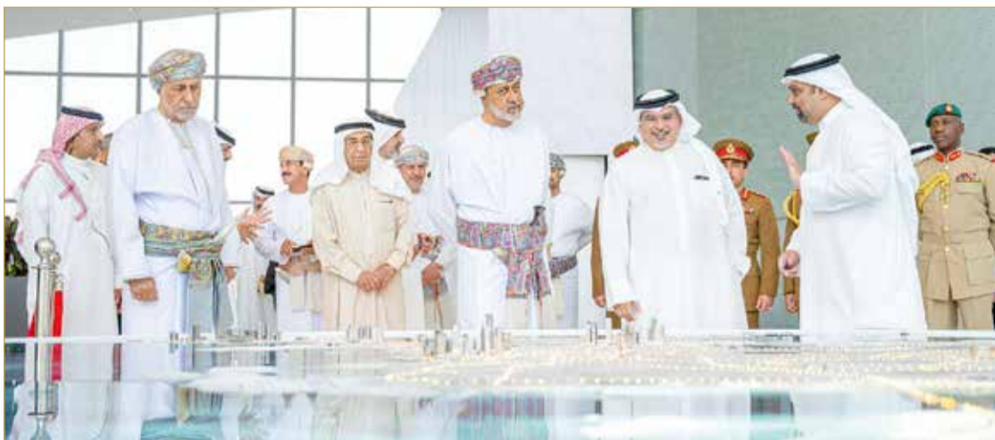
سمو ولي العهد رئيس الوزراء رئيس مجلس التنمية الاقتصادية في لقاء مع سلطان عمان الشقيقة

من تطور ونماء، وما وصلت إليه العلاقات من مستويات متميزة على الأصعدة كافة، والتي تعززها الاتفاقيات والزيارات المتبادلة بين الجانبين، منوهاً سموه بالاتفاقيات ومذكرات التفاهم التي شهد جلالته الملك المعظم و جلالة سلطان عمان مراسم التوقيع عليها أمس الأول، والتي تأتي لتدعم أوجه التعاون الاقتصادي والتجاري والاستثماري وتعود بالنفع والخير على البلدين والشعبين الشقيقين. (08)