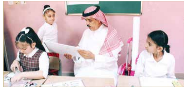
وزير التربية والتعليم يطلع على استراتيجيات تدريس اللغة العربية في المدارس الابتدائية

"تعزيز تعليم اللغة العربية، والنهوض بمستواها، بما يمكن من إتقانها واستخدامها في مختلف مجالات المعرفة"، في إطار سعي الوزارة إلى تعزيز القيم التربوية بكل أبعادها لدى الطلبة، والعمل على امتلاكهم المهارات العلمية والحياتية، وزيادة وعيهم بالقيم الوطنية والاجتماعية.