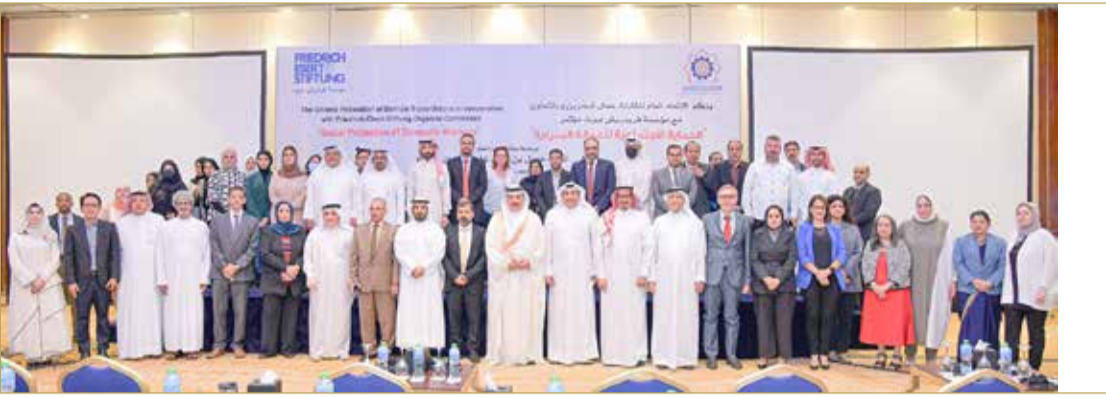
من افتتاح أعمال المؤتمر