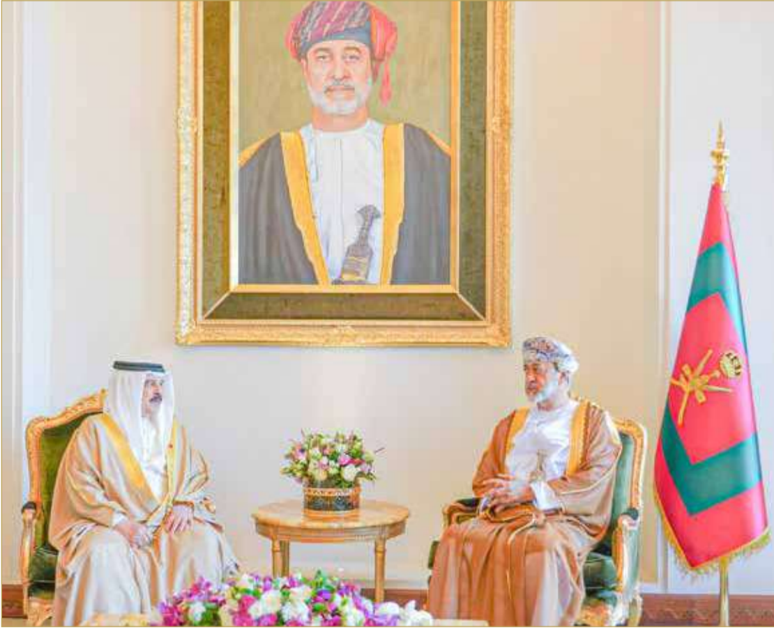
جلالة الملك المعظم يزور جلالة سلطان عمان في مقر إقامته