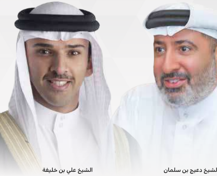
الشيخ علي بن خليفة

من جانبه، رحب رئيس مجلس إدارة الاتحاد البحريني لكرة القدم الشيخ علي بن خليفة بن أحمد آل خليفة بانضمام شركة البا إلى مجموعة الرعاية للمسابقتين برعاية فضية، مشيدًا بالجهود التي تبذلها الشركة في دعم القطاع الرياضي وبخاصة كرة القدم البحرينية، وذلك في سبيل تحقيق التطور والنماء في هذه اللعبة، معبرًا عن تقديره لمجلس إدارة شركة البا وحرصها على تقديم هذه الرعاية والدعم للمسابقتين، مؤكّدًا أن العمل المشترك بين اتحاد الكرة والشركة سيسهم في