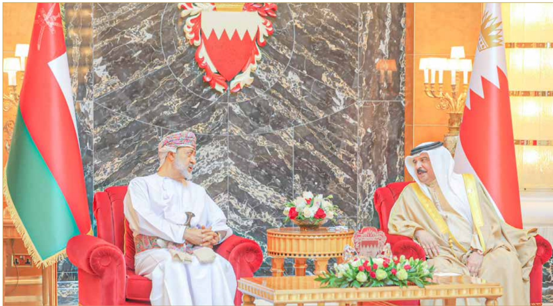
جلالة الملك المعظم و جلالة سلطان عمان يستعرضان الروابط التاريخية والتعاون الأخوي

♦ المملكة والسلطنة تمتازان بحضارتين عريقتين تمتدان لعقود طويلة وحاضر ومستقبل زاهر