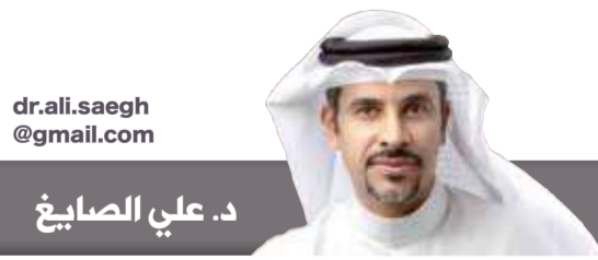
د. علي الصايغ

بعث "بيرجوليو"، ذات مرة من عام 2017، رسالة إلى اجتماع "تيد 2017"، الملتئم في فانكوفر بكندا تحت عنوان "المستقبل هو أنت"، عبر تسجيل مصور قال فيها "إن وجود كل واحد منا يرتبط بالآخرين"، ف"الحياة ليست وقتاً يمضي بل وقت لقاء". يومها تابع: إن لقائي أو إصغائي لمعاناة مرضى ومهاجرين يواجهون صعوبات جمة في البحث عن مستقبل أفضل، وسجناء يحملون الجحيم في قلوبهم،