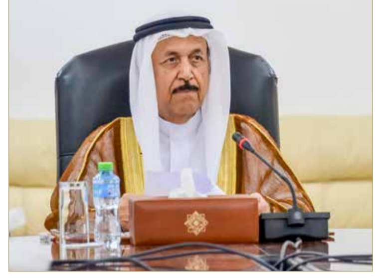
رئيس المجلس الأعلى للشؤون الإسلامية