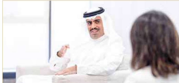
سفير مملكة البحرين لدى واشنطن يحاضر في أكاديمية محمد بن مبارك للدراسات الدبلوماسية

من جانبها، قدمت المدير العام لأكاديمية محمد بن مبارك آل خليفة للدراسات الدبلوماسية الشكر والتقدير للسفير على دعمه المتواصل لجميع البرامج والفعاليات التي تنظمها الأكاديمية، مشيرة إلى أن خبراته المهنية تعتبر مرجعاً ثرياً لجميع الدبلوماسيين، خصوصاً من هم في مقتبل مسيرتهم الدبلوماسية.