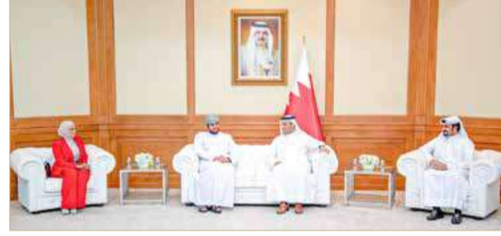
وزير شؤون الإعلام يستقبل الفريق المكلف بالتغطية التلفزيونية لزيارة جلالة سلطان عمان

وقدم وزير شؤون الإعلام شكره للفريق الإعلامي العماني المشارك في تغطية تلفزيون البحرين على مدى يومين احتفاءً بهذه الزيارة العزيرة، والذي ضم