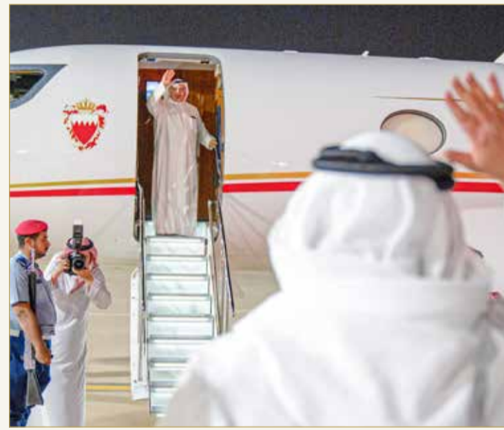
سمو ولي العهد رئيس مجلس الوزراء يغادر المملكة العربية السعودية