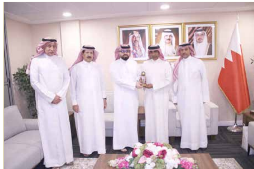
علي بن محمد لدى استقباله ممثل شركة طلبات

في مساندة الاتحاد لتسيير أنشطته وبرامجه على النحو الأمثل ونعتز كثيرًا بوجود طلبات ضمن قائمة شركائنا المحليين لما تحمله الشركة من سمعة ومكانة رائدة لتبرم شراكة ناجحة مع اتحاد الكرة الطائرة الذي يعتبر من الاتحادات الرياضية المنجزة على صعيد المنتخبات الوطنية ونتائجها الإيجابية بمختلف المشاركات الخارجية. وفي ختام اللقاء قدم الشيخ علي بن محمد بن راشد آل خليفة هدية تذكارية لعلي درويش تقديرًا وعرفانًا من الاتحاد بدعم شركة طلبات للاتحاد متمنياً للشركة دوام التوفيق والنجاح.