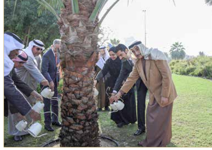
المنامة - بنا

في إطار دعم ولي العهد رئيس مجلس الوزراء صاحب السمو الملكي الأمير سلمان بن حمد آل خليفة، للخطة الوطنية للتشجير الهادفة إلى مضاعفة عدد الأشجار في مملكة البحرين، رعى نائب رئيس مجلس الوزراء الشيخ خالد بن عبد الله آل خليفة، فعالية غرس الشجرة رقم (150 ألفاً)، وهي الشجرة الأخيرة التي يتم زراعتها ضمن مبادرات الخطة الوطنية للتشجير العام الجاري 2022.