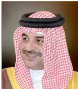
سمو الشيخ عبدالله بن حمد

حمد آل خليفة أن مملكة البحرين أصدرت أخيراً القانون رقم (7) لسنة 2022 بشأن البيئة بهدف تحديث القوانين البيئية التي تتماشى مع المتغيرات في مختلف المجالات البيئية والمناخية وتوأكب أفضل الممارسات الدولية في تطوير التنمية المستدامة ومواجهة التحديات البيئية الجديدة، كما أصدرت مملكة البحرين القانون رقم (27) لسنة 2012 بشأن الموافقة على انضمام مملكة البحرين إلى اتفاقية التجارة الدولية في الأنواع المهددة بالانقراض من مجموعات الحيوانات والنباتات الفطرية، وتعمل في الوقت الراهن على إصدار اللوائح القانونية التي تعزز من جهود مملكة البحرين في مكافحة الاتجار بالأنواع المهددة