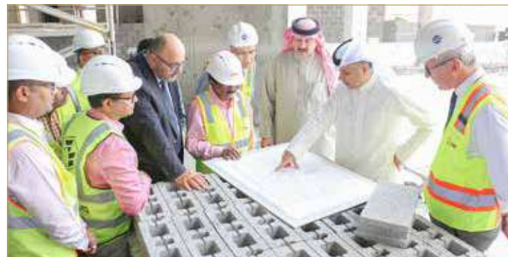
رئيس هيئة الكهرباء والماء في زيارة لمشروع مركز التحكم لشبكات الكهرباء والماء

جاء ذلك في الزيارة التي قام بها لمشروع مركز التحكم لشبكات الكهرباء والماء (New System Control Centre-NSSC) في منطقة الحد، والذي تبلغ تكلفته