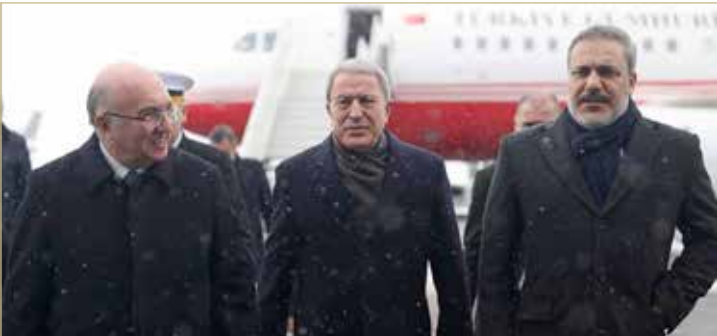
طاولة روسية تجمع تركيا والنظام السوري في موسكو