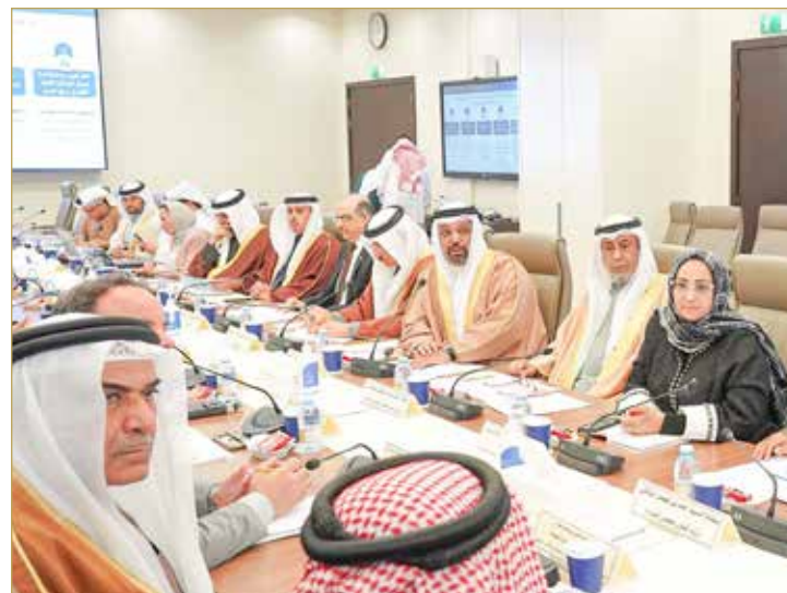
اللجنة النيابية المعنية بدراسة برنامج الحكومة تعقد اجتماعها الثاني مع الفريق الحكومي

أدخلت على برنامج الحكومة، إذ ضمت إعادة صرف الزيادة السنوية للمتقاعدين وتثبيت علاوة المعيشة المقدمة للمتقاعدين.