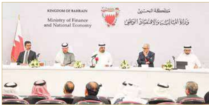
وزير المالية والاقتصاد الوطني متحدثاً في المؤتمر

ولفت الوزير في المؤتمر الصحفي الذي عقده لتسليط الضوء على آخر مستجدات الوضع الاقتصادي