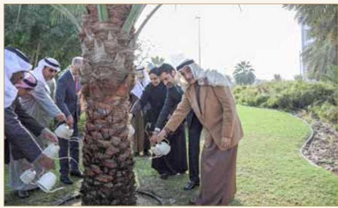
نائب رئيس مجلس الوزراء يرفع فعالية غرس الشجرة رقم 150 ألفاً

في إطار دعم ولي العهد رئيس مجلس الوزراء صاحب السمو الملكي الأمير سلمان بن حمد آل خليفة، للخطة الوطنية للتشجير الهادفة إلى مضاعفة عدد الأشجار في مملكة البحرين، رعى نائب رئيس مجلس الوزراء الشيخ خالد بن عبدالله آل خليفة، فعالية غرس الشجرة رقم (150 ألفاً)، وهي الشجرة الأخيرة