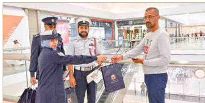
المنامة - بنا

العمل دعوتها جميع أفراد المجتمع إلى دعم جهود الجهات الحكومية للتصدي للممارسات غير القانونية في سوق العمل والعمالة غير النظامية حماية للمجتمع ككل، داعية الجمهور للإبلاغ عن أية شكاوى تتعلق