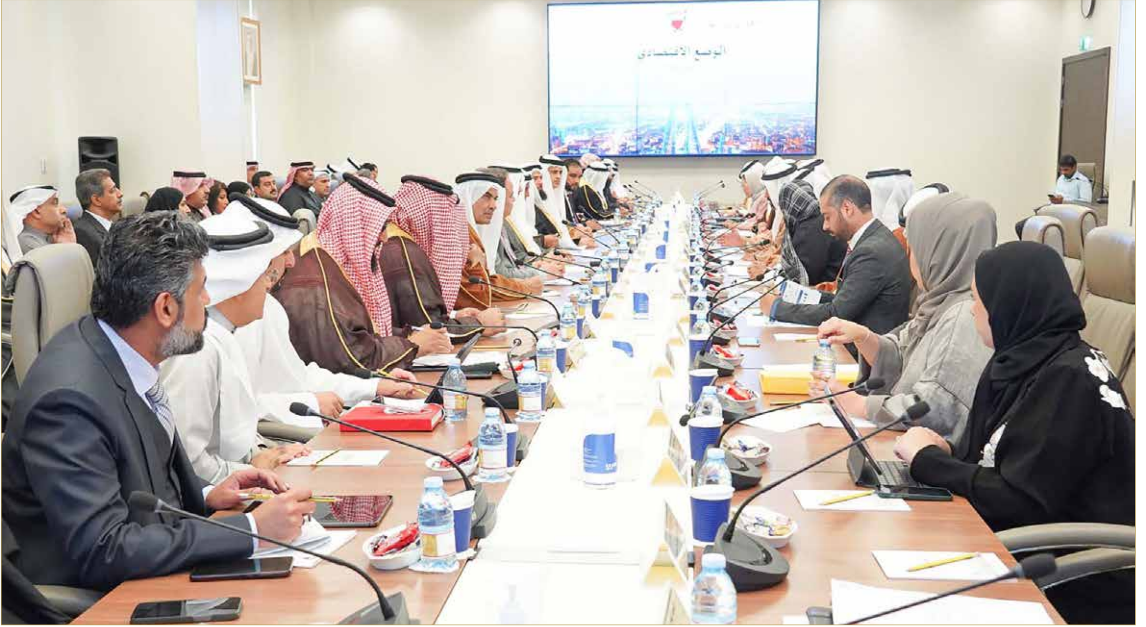
اللجنة النيابية المعنية بدراسة برنامج الحكومة تعقد اجتماعها الثاني مع الفريق الحكومي

مستمر على تنفيذ البرامج الرامية إلى تحسين الوضع الاقتصادي للمملكة ومردوده الإيجابي بما يسهم في تحسين المستوى المعيشي للمواطنين، وكان آخرها إطلاق خطة التعافي الاقتصادي التي تم تنفيذ العديد من مبادراتها وساهمت بشكل ملحوظ في تحسن مؤشرات البحرين الاقتصادية. هذا وأعرب وزير المالية والاقتصاد الوطني عن شكره وتقديره لرئيس مجلس النواب وأعضاء اللجنة على حرصهم واهتمامهم لإنجاز دراسة البرنامج، مشيراً إلى أن هذه الاجتماعات المشتركة تعكس الرغبة المتبادلة بين السلطتين التنفيذية والتشريعية لاعتماد وتنفيذ برنامج الحكومة للسنوات الأربع المقبلة، والعمل بروح فريق البحرين الواحد بما يحقق الغايات المنشودة.