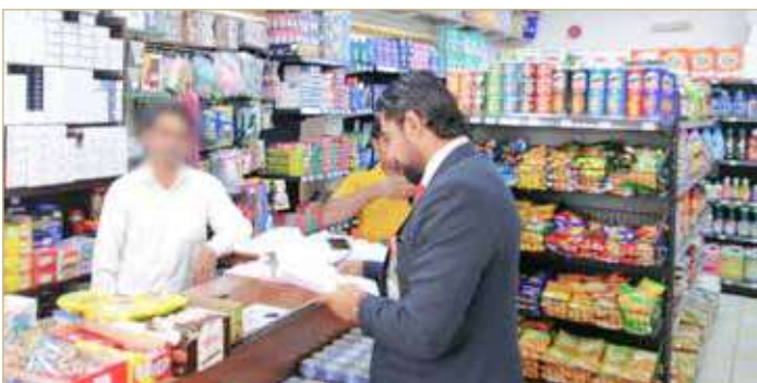
المنامة - هيئة تنظيم سوق العمل

نفذت هيئة تنظيم سوق العمل حملتين تفتيشيتين مشتركتين بالتنسيق مع وزارة الداخلية ممثلة في شؤون الجنسية والجوازات والإقامة، ومديريات الشرطة، في محافظتي العاصمة والمحرق شملت عدداً من المحال التجارية ومواقع العمل وأماكن تجمع العمالة.