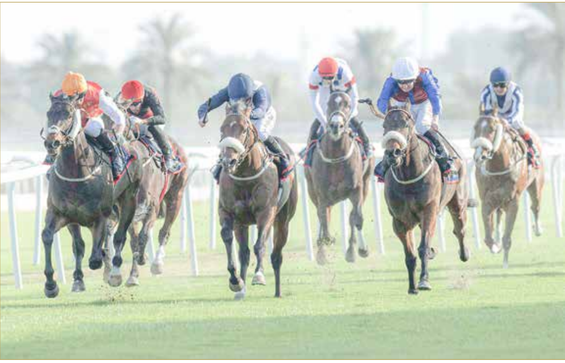
منافسات منتظرة للفوز بكؤوس بطولة البحرين الدولية وشركة المنيوم البحرين (ألبا)

ينظم نادي راشد للفروسية وسباق الخيل عند الواحدة و20 دقيقة من ظهر اليوم سباق الجولة الثانية من سلسلة بطولة البحرين الدولية لسباق الخيل والتي تقام برعاية ودعم "مجلس التنمية الاقتصادية وشركة المنيوم البحرين" ألبا وشركة بتلكو وبنك البحرين الوطني وبنك البحرين والكويت وبنك السلام ومجموعة جي إف أنش العالمية، وسايا كورب، ومركز البحرين للمجوهرات، وبمشاركة ملك ومدربين وجياد من مختلف أنحاء العالم وذلك ضمن السباق الثاني عشر لهذا الموسم على مضمار النادي بالرفعة بالصخير.