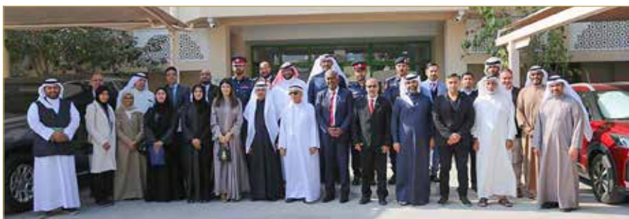
البيدع - مجلس بلدي الشمالية

وفي ختام الاجتماع عبر ممثلو المؤسسات المشاركة عن سعادتهم بالمستوى العالي من التفهم والتفاهم والتوافق الذي ساد الاجتماع مؤكداً أن الحوار الإيجابي يشكل تحولا نوعيا في مسار عمل المجلس البلدي الشمالي.