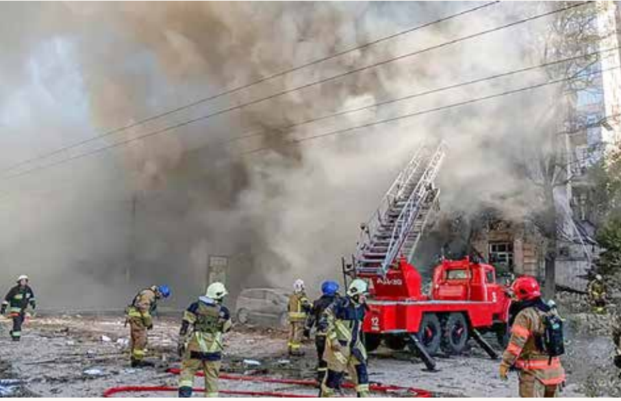
من القصف الروسي بمسيرات على كييف

دوري، منذ أكتوبر الماضي، ما تسبب في أضرار بالغة في شبكة الكهرباء بأوكرانيا.