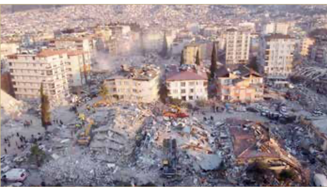
تعرضت أنطاكية لدمار كبير عقب الزلزال

ولفتت إلى مواصلة 29 ألفاً و160 منقذاً أعمال البحث والإنقاذ بالمنطقة يساندهم في ذلك 11 ألفاً و488 منقذاً من دول أخرى، مضيفة