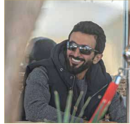
سمو الشيخ ناصر بن حمد آل خليفة