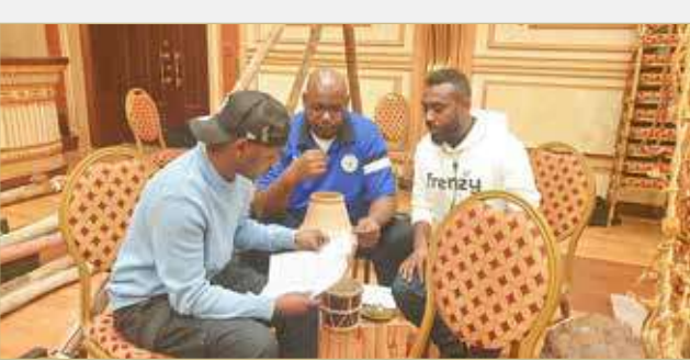
استعدادات قبل البروفة

السبت 18 فبراير 2023 - 27 رجب 1444 - العدد 5240