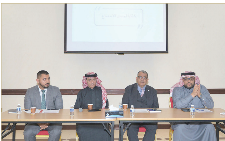
مدينة عيسى - وزارة العمل

نظمت وزارة العمل وبالتعاون مع كل من صندوق العمل "تمكين"، وجمعية مكاتب المحاماة لقاءً تعريفياً للبرنامج التأهيلي المتخصص "محامي تحت التدريب لخريجي القانون والحقوق"، وذلك بمبنى الوزارة في مدينة زايد. وتم خلال اللقاء استعراض الآليات والشروط التي سيتم من خلالها توفير دعم للفتات المستهدفة من خريجي القانون والحقوق وفق خيارين وهما برنامج دعم أجور المحامين الحالي لثلاث سنوات منذ التحاقهم بالعمل، وبرنامج محامي تحت التدريب بمكاتب المحاماة -دعم من صندوق العمل (تمكين)، ويضم ثلاث مسارات وهي دعم بمقدار 300 دينار شهرياً تدفع مباشرة للمتدرب