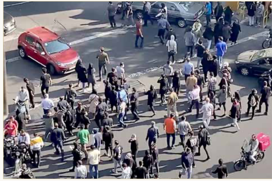
المحتجون يطالبون بالنار من النظام بعد سقوط عدد كبير من القتلى

وفي مقطع قيل إنه من مدينة مشهد الشيعية المقدسة في الشمال الشرقي ردد محتجون "أخي