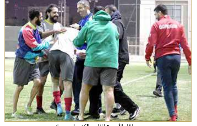
من لقاء الأسبوع الثامن الكهراء وجيبك

فيها اتجاه الهواء ليسجل هدفا خادعا وجميلا عند الدقيقة 86. وحاول الكهراء الضغط في الوقت المتبقي لإدراك التعادل لكن اصطدم بصلابة دفاعية. وانتهى اللقاء بفوز فريق جيبك بالهدف الوحيد في المباراة.