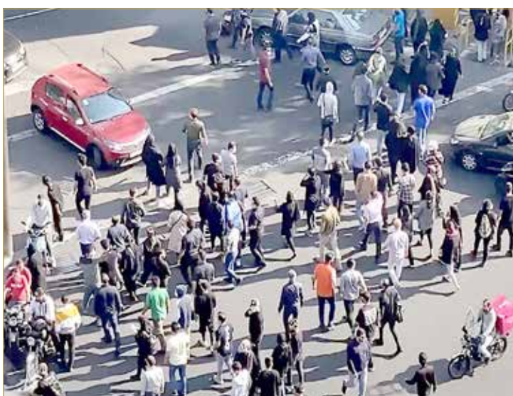
المحتجون يطالبون بالنار من النظام بعد سقوط عدد كبير من القتلى

أيضاً احتجاجات. فيما قارن أحد أبرز رجال الدين السنة في البلاد، والزعيم الروحي للشعب البلوشي، مولوي عبد الحميد إسماعيل زهي، الناقد الدائم لـ "نظام الجمهورية الإسلامية الإيرانية"، الوضع الحالي في البلاد، بـ"يوم القيامة" في خطبته بعد صلاة الجمعة بمسجد مكي في زاهدان، داعياً إلى إجراء استفتاء؛ لتحديد نوع الحكم في البلاد. كما لمح في جزء آخر من خطبته إلى خامنئي، قائلاً "لا يمكن لأحد أن يدعي بأنه معين من قبل الله ليحكم". وأكد أن الحاكم هو من يحدده الشعب الذي لديه الحق في تقرير مصيره بيده. (10)