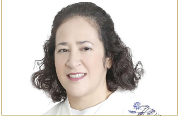
الشيخة إيشاع بنت محمد

حظيت به الشيخة إيشاع من تقدير وتكريم لجهودها ضمن نخبة متميزة من السيدات العربيات عن خالص تمنياتها بالمزيد من التفوق والنجاح، وأن يبارك الله سعيها المخلص لخدمة مملكة البحرين الغالية ورفعة شأنها، تحت راية قائد مسيرتنا الوطنية الشاملة عاهل البلاد المعظم صاحب الجلالة الملك حمد بن عيسى آل خليفة.