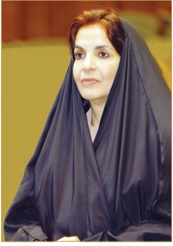
سمو الأميرة سبيكة بنت إبراهيم