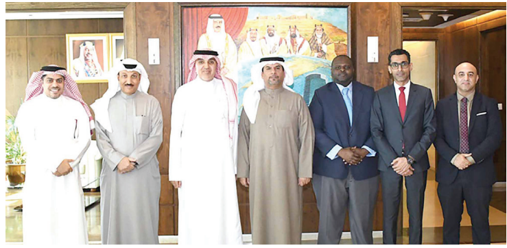
وزير النفط والبيئة يجتمع مع رئيس مؤتمر ومعرض (ميوس وجيو 2023)

وغيرها من الموضوعات، بالإضافة إلى معرض يضم كبرى الشركات النفطية العالمية من 40 دولة من دول العالم لاستعراض أحدث ما توصلت إليه التقنيات الحديثة في مجال الاستكشاف والإنتاج بمساحة قدرها 18 ألف متر مربع، ومن أهم الشركات المشاركة في المعرض المصاحب الشركة القابضة للنفط والغاز، وشركة أرامكو السعودية، وشركة هالبرتون، وشركة بيكرهوجز، وشركة شيفرون، ومؤسسة البترول الكويتية، وشركة اكسون موبيل، وشركة نيسر، وشركة ادنوك، وشركة ابني الإيطالية وغيرها من الشركات من دول مجلس التعاون لدول الخليج العربية، وأستراليا وكندا والصين وفرنسا والهند وإيطاليا والولايات المتحدة الأمريكية وغيرها من دول العالم.