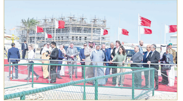
المنامة - بنا

قامت رئيسة المجر الصديقة كاتالين نوفاك أمس بزيارة إلى موقع أول بئر نفط تم اكتشافه في مملكة البحرين، الذي يعود إلى 1932 ولدى وصولها كان في الاستقبال وزير النفط والبيئة المبعوث الخاص لشؤون المناخ محمد بن دينة، وعدد من كبار المسؤولين في الشركة القابضة للنفط والغاز. واستمعت رئيسة المجر إلى شرح عن الموقع وما يمثله من بدايات لاكتشاف النفط في المنطقة والتقت فيها بعدد من الشباب البحريني العاملين بالقطاع النفطي، كما زارت متحف النفط اطاعت