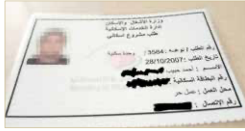
الطلب الإسكاني لأحمد

هذه وتنتظر فيها بشكل مباشر وفوري بعيداً عن بيروقراطية بعض الموظفين والأقسام والاتصالات التي تردني منها بلا نهاية سعيدة. وما زلت أمني نفسي بالحصول على بيت العمر بأي مشروع إسكاني، وما يثير غيظي