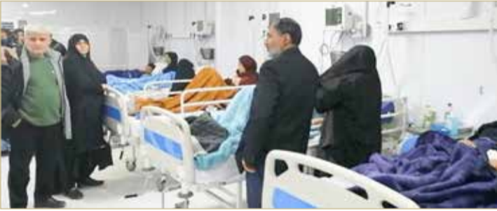
نقل 108 أشخاص إلى المستشفى بسبب التسمم

مبرر، ليس هناك ما يُلامان عليه”. وجاء قرار إيران رداً على طرد برلين دبلوماسيين إيرانيين قبل أسبوع بعدما حكمت محكمة في طهران بالإعدام على المعارض الألماني الإيراني جمشيد شامهد البالغ من العمر 67 عاماً. وتوقف السلطات الإيرانية عدداً من الأجانب أو حملة الجنسية المزدوجة على خلفية قضايا أمنية أو شبهات تجسس.