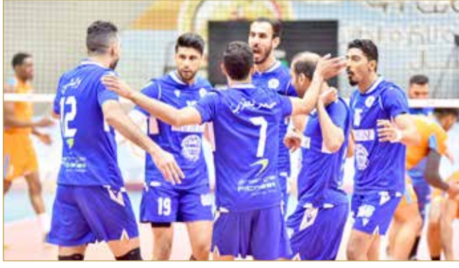
النصر يسعى لتحقيق أول لقب عربي في تاريخه