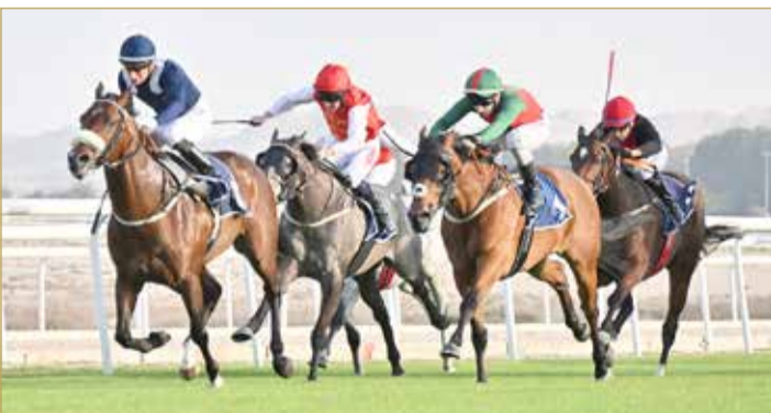
لقطة من السباقات