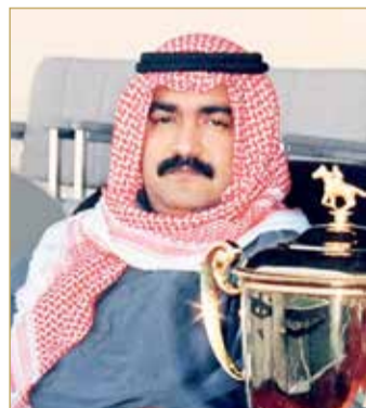
المغفور له الشيخ راشد بن محمد آل خليفة

الجيد "كارينا، هيركوليس، خيلان، سكوربيوس، قليشا، مجره، رهيبه". الشوط الرابع يقام لجياد سباق التوازن "إنتاج محلي" مسافة 2200 متر وبمشاركة الجياد "إراد، مغيره، مشاوير، جباره، جدله، ساموراي جاك، لحوق، أصله، البروفسور".