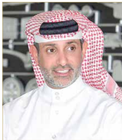
الشيخ سلمان بن عيسى

خلال الحجوزات الفندقية لهذا الموسم، والتي تدعونا لتقديم أفضل الخدمات لزوار المملكة بالتعاون مع القطاع السياحي والتأكد من الجودة التامة لاستقبالهم". بدوره، قال الرئيس التنفيذي لحلبة البحرين الدولية الشيخ سلمان بن عيسى آل خليفة "تواصل مملكة البحرين ريادتها في استضافة أحد أضخم الأحداث الرياضية على مستوى العالم وتصدر روزنامة البطولة العالمية كأول سباقات الموسم بما يعكس تفردنا في حسن التنظيم والضيافة. ونشيد بالتعاون المستمر