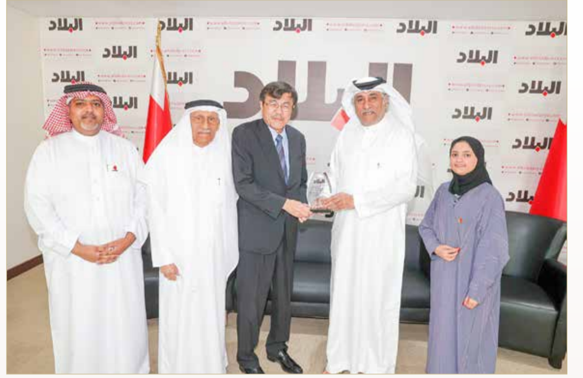
هدية تذكارية لسفير اليابان

دليل مطبوع لكيفية استضافة الزوار المسلمين في اليابان