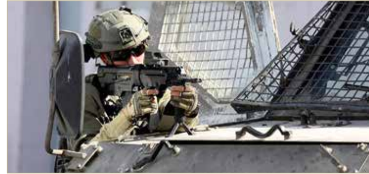
جندي إسرائيلي يصبّو بنديقيه أثناء مواجهات في نابلس

كما أفادت وسائل الإعلام عن حالات تسمم جديدة في ثلاث مدارس على الأقل في طهران. وقدرت المتحدثة باسم لجنة الصحة البرلمانية، زهراء شيخي، أمس إصابة نحو 800 طالبة في مدينة قم منذ تسجيل أولى حالات التسمم عبر الجهاز التنفسي في أواخر