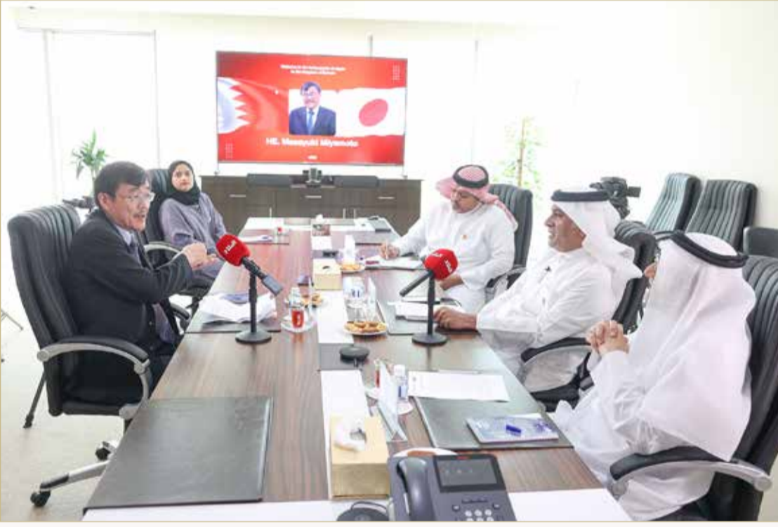
خلال اللقاء بالسفير