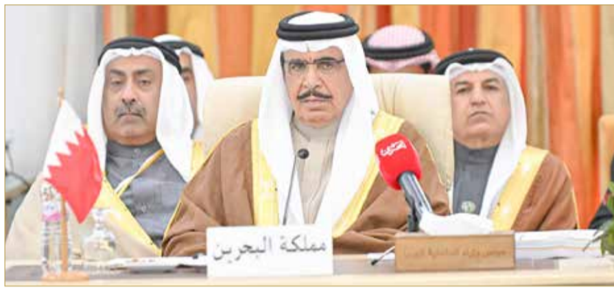
وزير الداخلية مترسدا وفد البحرين لاجتماع وزراء الداخلية العرب

استقبل رئيس جمهورية تونس الشقيقة قيس سعيد، أمس، وزراء الداخلية العرب، بمناسبة انعقاد الدورة الأربعين لمجلس وزراء الداخلية العرب. وترأس وزير الداخلية الفريق أول الشيخ راشد بن عبدالله آل خليفة، وفد مملكة البحرين المشارك بالاجتماع، والذي عقد برئاسة وزير الداخلية في دولة فلسطين الشقيقة اللواء زياد هب الريح. وخلال جلسة العمل، ألقى وزير الداخلية كلمة مملكة البحرين، وأكد فيها أن التعامل مع التحديات الأمنية لا يتوقف عند إجراءات التصدي وردود الأفعال الأمنية، وإنما يتطلب الأمر إجراءات استباقية. (02)