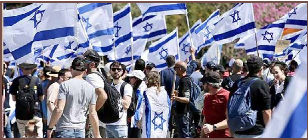
احتجاجات شعبية تقودها المعارضة ضد قانون الإصلاح القضائي

ولمواجهة خطط الحكومة، قال زعيم المعارضة الإسرائيلية يائير لابيد: "حالما