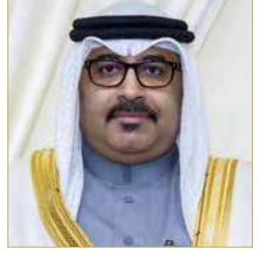
محمد بن مبارك جمعة

البلاد | منال الشيخ أصدر وزير التربية والتعليم محمد مبارك قراراً رقم (207) لسنة 2023 بتنظيم إجراءات التحقيق في المخالفات المرتكبة من قبل المرخص لهم بإنشاء مؤسسات التعليم العالي الخاصة في العدد الأخير للجريدة الرسمية، والذي جاء فيه أنه يُصدر مجلس الأمناء، بعد الاطلاع على نتائج التحقيق، قراراً مسبقاً ومنها توقيع غرامة إجمالية بما لا يجاوز مئة ألف دينار بحريني، وأنه يجوز للمؤسسة الصادر ضدها قرار وفقاً لأحكام المادة (1) من هذا القرار الطعن فيه أمام المحكمة المختصة خلال مدة لا تتجاوز ستين يوماً من تاريخ إخطارها بالقرار. كما أن على الأمين العام لمجلس التعليم العالي والمعنيين - كلٌ فيما يخصه - تنفيذ أحكام هذا القرار، ويعمل به من اليوم التالي لتاريخ نشره في الجريدة الرسمية. (06)