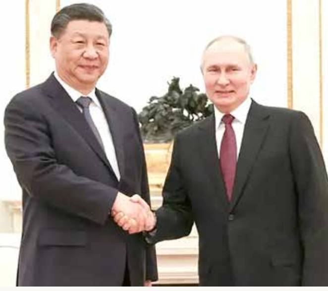
الرئيس الصيني دعا نظيره الروسي لزيارة الصين خلال العام الجاري

وقال شي خلال لقاء مع رئيس الوزراء الروسي ميخائيل ميشوستين قبل بدء جولة ثانية من المحادثات مع بوتين: "دعوت بالأمس الرئيس بوتين لزيارة الصين هذه السنة في الوقت الذي يناسبه"، حسب المصدر ذاته. وفي السياق، أكد الرئيس الصيني أن بكين ستواصل جعل العلاقات مع روسيا "أولوية"، واصفا الدولتين بأنهما "شريكان استراتيجيان".