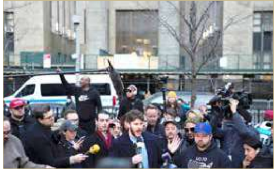
انصار للرئيس ترامب يتجمعون في نيويورك

وفي الوقت الذي تتخذ فيه شرطة واشنطن إجراءات احترازية، فإن قوة شرطة الكابيتول الأميركية "لا تتعقب حاليا