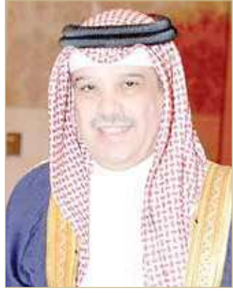
الشيخ عبدالرحمن بن مبارك

والذي يعتبر من أصعب المواسم بعد رفع عدد الفرق فيه وتدعيم الفرق لصفوفها بلاعبين مميزين على مستوى عالٍ. وعبر الشيخ عن بالغ شكره وتقديره لهيئة الفني بقيادة المدرب اسماعيل كرامي ومعاونيه وبقية الجهاز الإداري على ما قاموا به من عمل في سبيل النهوض بالفريق بعد الهبوط الذي لم يؤثر على عزمهم بل زادهم إصراراً وقوة لتصحيح المسار والعودة للمكان الطبيعي.