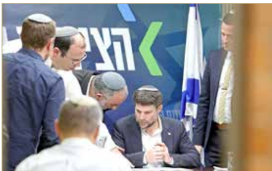
تصريحات سموتريتش تهدف لضرب الاتفاق على الهدنة

وشعم الوزير وهو يقول في مقطع مصور من ألقاها في مؤتمر في فرنسا وتم تداوله على نطاق واسع على وسائل التواصل الاجتماعي "هل هناك تاريخ أو ثقافة فلسطينية؟ لا يوجد شيء اسمه شعب فلسطيني". وألقى سموتريتش الذي يرأس حزبا دينيا قوميا في ائتلاف رئيس الوزراء بنيامين نتنياهو اليميني المتشدد كلمته في نفس اليوم الذي التقى فيه مسؤولون إسرائيليون وفلسطينيون في منتجع شرم الشيخ المصري لوقف التصعيد قبل حلول شهر رمضان المبارك وعيد الفصح اليهودي.