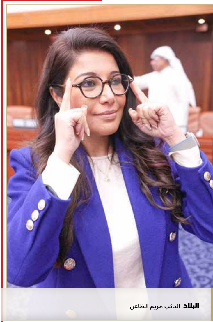
البلاد النائب مريم الطعان