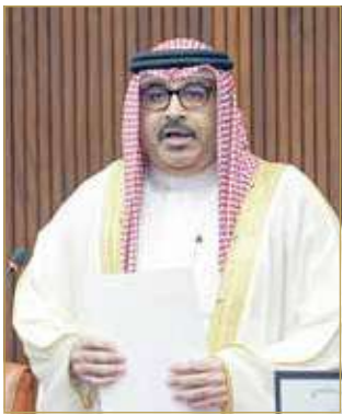
وزير التربية والتعليم

البلاد أكد وزير التربية والتعليم محمد بن مبارك جمعة أن طلبة التربية الخاصة يحظون بالدعم وأن المؤسسات التعليمية تلعب دوراً كبيراً في هذا الشأن. ولفت إلى أن الدمج من الخدمات المهمة التي تقدم لهذه الفئة في حال ثبوت تشخيص حالة الطالب أنها قابلة للدمج، مشيراً إلى أن الوزارة تخضع جميع غير المتخصصين في رعاية ذوي الاحتياجات الخاصة إلى دورات مكثفة. وأوضح أن الوزارة في طور التوسع في الخدمات المقدمة إلى طلبة الحالات الخاصة، من جانبه، اعتبر النائب هشام العوضي أن طلبة الحالات الخاصة يفتقرون إلى الاهتمام والرعاية وأنه لا يعقل أن يتعامل معلم الرياضة مع هذه الفئة.