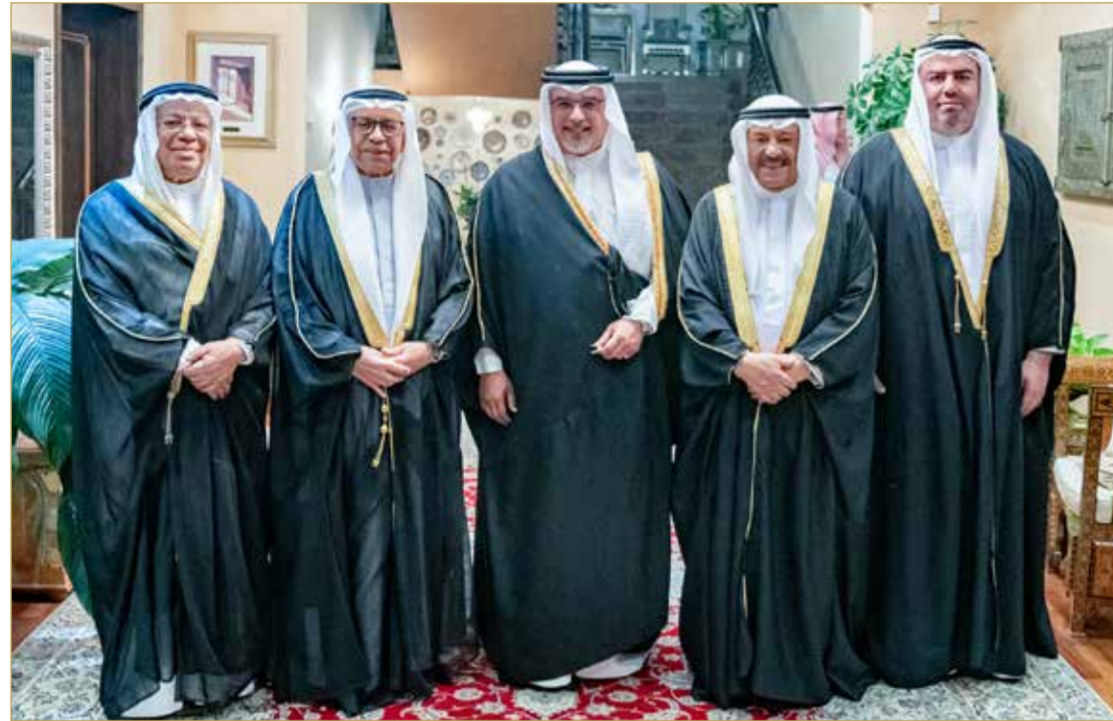
سمو ولي العهد رئيس مجلس الوزراء يزور مجلس رئيس مجلس الشورى