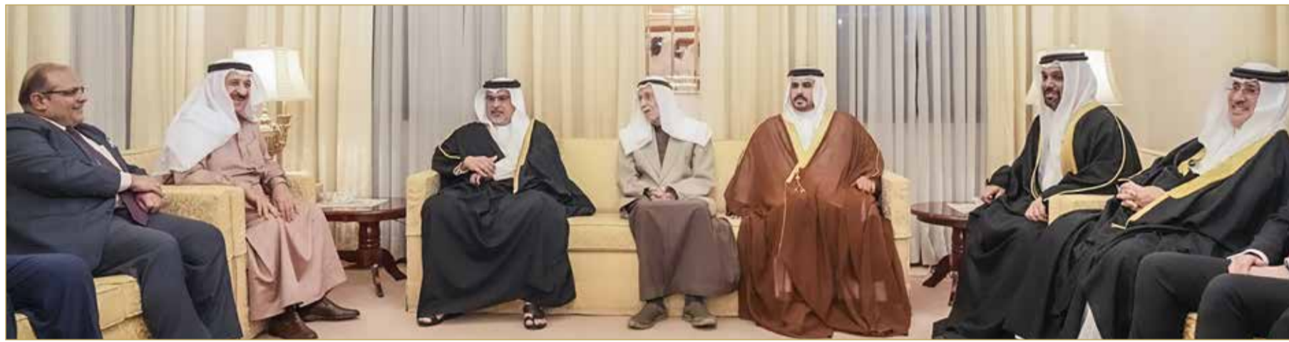
سمو ولي العهد رئيس الوزراء لدى زيارته مجلس عائلة كانو

عزم أبناء الوطن يشكل على الدوام داعما لتحويل التحديات إلى فرص حقيقية للإنجاز المتميز. (02) و(03)