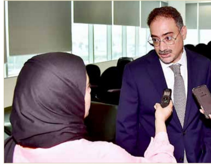
تصريح العريض لمندوبة "البلاد"

ملموسة لجميع الأطراف ذات المصلحة، تعززها استثمارات هامة على مدى السنوات القليلة الماضية، وتهدد الطريق نحو تحقيق النمو لأعمالها، وتوطيد علاقات التعاون على المدى البعيد، فضلاً عن إحداث نقلة واسعة في نظام مواقف السيارات من خلال حلول سلسلة ومبتكرة وسهلة الاستخدام. وقد حققت الشركة عدداً من الإنجازات في عام 2022، معززة مكانتها الراسخة باعتبارها شركة رائدة في مجال التنقل في المنطقة. ويشمل ذلك إطلاق خدمة الدفع عبر أبل باي لمستخدمي هواتف الآيفون لتيسير عملية الدفع الآمن عبر المواقع التي تمتلكها أو تديرها الشركة. وقد ساهمت مثل هذه الشراكات المثمرة