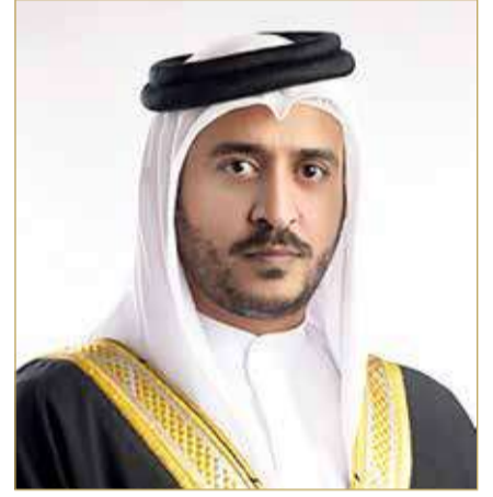
سمو الشيخ خالد بن حمد

وحضر الملتقى نائب رئيس الهيئة العامة للرياضة سمو الشيخ سلمان بن محمد آل خليفة ووكيل وزارة شؤون مجلس الوزراء نائب رئيس اللجنة الأولمبية سمو الشيخ عيسى بن علي بن خليفة آل خليفة ووزير التربية والتعليم محمد بن مبارك جمعة ووزير شؤون الإعلام رمضان بن عبدالله النعيمي ووزيرة الشباب روان بنت نجيب توفيق والرئيس التنفيذي للهيئة العامة للرياضة عبدالرحمن صادق عسكر والأمين العام للجنة الأولمبية فارس مصطفى الكوهجي ورئيس مجلس أمناء مدرسة بيان البحرين الشبيخة مي العتيبي ورئيس الاتحاد البحريني الرياضي للمدارس والجامعات الشيخ صقر بن سلمان آل خليفة.