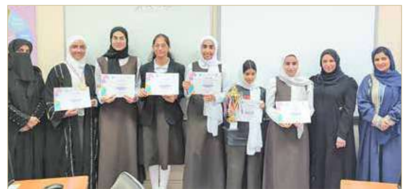
مدينة عيسى - وزارة التربية والتعليم

شاركت 40 طالبة من 8 مدارس إعدادية للبنات في مسابقة "أهلاً رمضان" التي نظمتها مدرسة الرفاع الشرقي الإعدادية للبنات، لإعداد أفضل تصميم ترحيبي بمقدم الشهر الفضيل باستخدام برنامج "ماين كرافت" الرقمي. يذكر أن وزارة