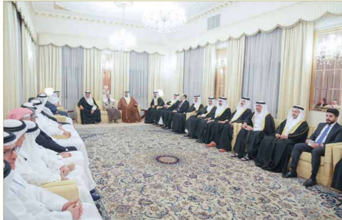
سمو ولي العهد رئيس مجلس الوزراء يزور مجلس عائلة كانو