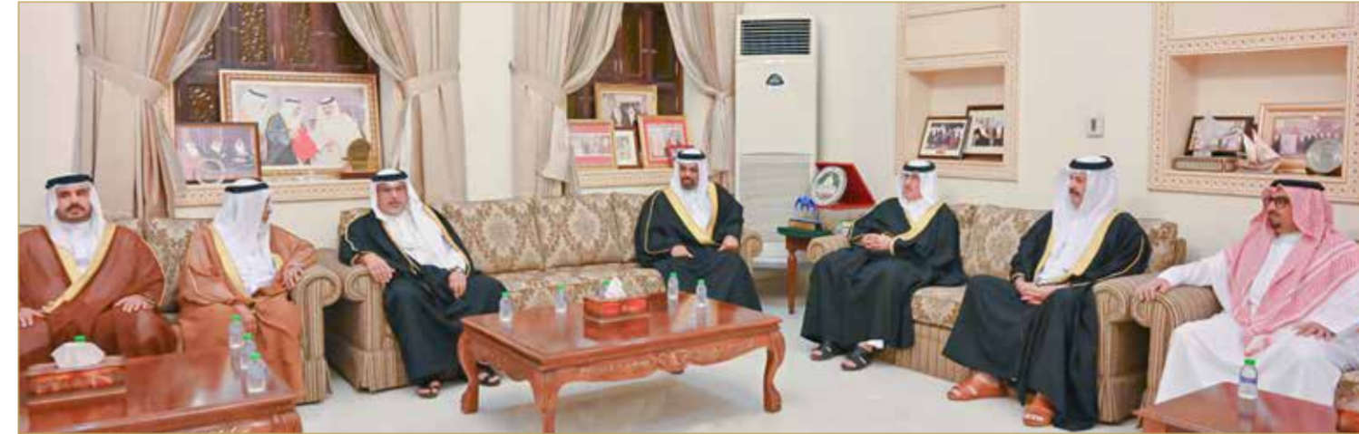
سمو ولي العهد رئيس مجلس الوزراء يزور خليفة الظهراني

بنتواصل أبنائها وتلاحمهم. وأشار سموه إلى أن ما يمر به العالم من حالة عدم استقرار ألفت بظلالها على الاقتصاد العالمي وخلفت تحديات للجميع، ولكن مملكة البحرين بفضل قيادة جلالة الملك المعظم تخرج دائماً من التحديات وهي أقوى مما كانت عليه. لافتاً سموه إلى أن عزم أبناء الوطن يشكل على الدوام داعماً لتحويل التحديات إلى فرص حقيقية للإنجاز المتميز. وجانبهم أعرب أصحاب المجالس والحضور عن شكرهم وتقديرهم لصاحب السمو الملكي ولي العهد رئيس مجلس الوزراء على تفضله بزيارتهم، والتي تأتي لتؤكد نهج التواصل الذي يحرص سموه على ترسيخه من خلال اللقاءات المستمرة مع كافة أبناء البحرين في مجالسهم الرضائية بمختلف محافظات المملكة.