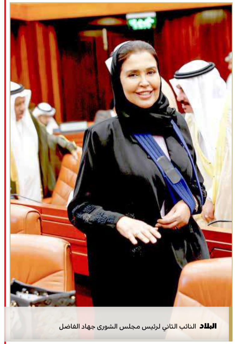
البلاد النائب الثاني لرئيس مجلس الشورى جهاد الفاضل